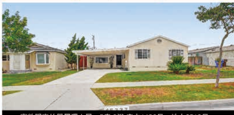
宽敞明亮的单層獨立屋，5房3浴 室内1496尺，地大6513尺，1958年建，在這個區域很少見到的单層5卧室的獨立屋

15030 La Donna Way, Hacienda Heights • $950,000