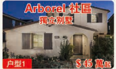
Arborel 社區 獨立別墅 戶型1 $45萬起 1953平方呎 3臥室 2.5浴室 2車位

好的生活盡在安大略牧場，帶著家人探索全新的家園，並在這個區域植根。享受新的小区，並擁抱家庭。現在是逃避喧囂，享受你一直想象的生活的時候了。擁有設施齊全的公園，野餐的綠色草坪，夏日燒烤的涼亭和噴水池，您可以在自己的後院體驗度假式娛樂的健康樂趣。放鬆在度假村門廊，與巨大的平面屏幕上的朋友觀看大遊戲，或在室內-室外酒吧享用晚間飲品。