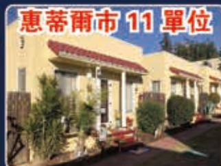
惠蒂爾市 11 單位

臨近海邊位置 位於太平洋海岸公路旁 大約25%的租金上漲率 超過5%的投資回報率 短期租賃證書 賣方可做貸款 買方可接替現有貸款