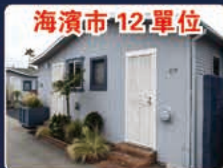
海濱市 12 單位

6個聯排住宅單位 1980年代的建築 建築內外已裝修 大約25%的租金上漲率 超過5%的投資回報率