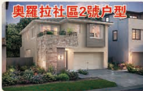
奧羅拉社區2號户型