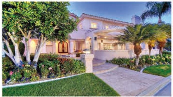
30421 Via Andalusia | San Juan Capistrano | $1,545,000

4房 4衛浴, 包括一個量身定制建造的小屋, 及樓下的主人房, 美金售價 一百六十七萬五千