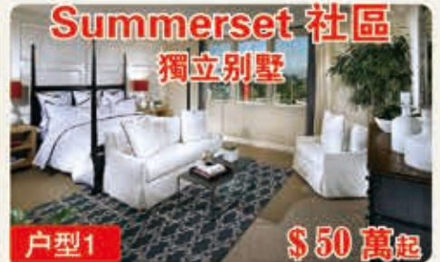
Summerset 社區 獨立別墅 戶型1 $50萬起 3133平方呎 4-5臥室 3浴室 2車位