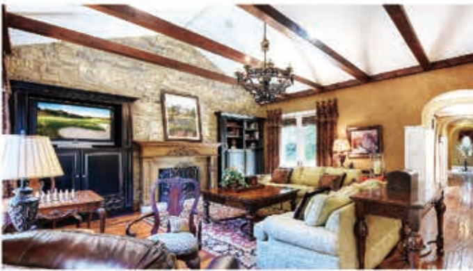
5 Padre Place | Covenant Hills, Ladera Ranch | $1,675,000

5房 6衛浴, 室內面積 3,789 平方英尺, 售價美金 二百九十九萬九千至 三百二十萬 之間