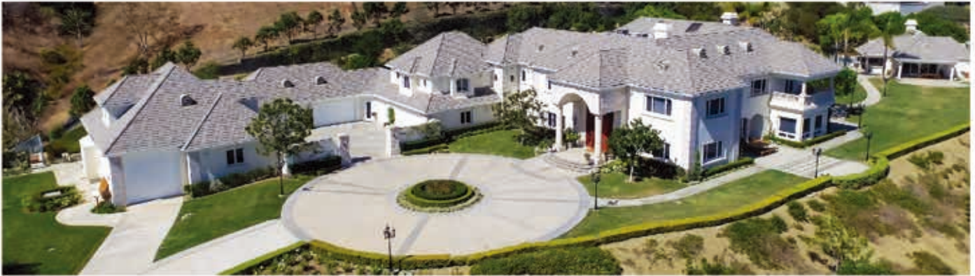
COMING SOON! | 14 Morning Dove | Laguna Niguel | $11,888,000

極品豪宅, 即將推出! 建商 Bear Brand Ranch, 8房 10衛浴, 室內面積15,000平方英尺, 5.5英畝 售價美金一千一百八十八萬八千