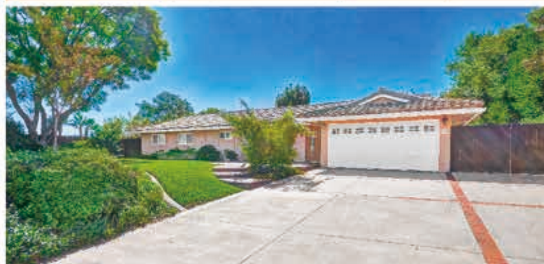
3房2浴，地大17490尺，全新高級裝修，一層樓，後院近公園

2001 Turnbull Canyon Road, Hacienda Heights • $978,888