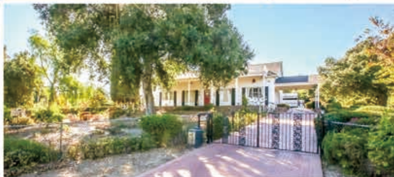
坐落于著名的特恩布爾峽谷，風景如詩如畫，3房2浴，室内2479尺，地大33114尺，1924年建，在該地段很少見的1英畝以上的角落地段

2914 Descending Drive, Hacienda Heights • $748,888