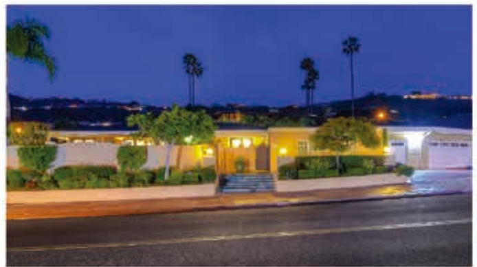
32702 Seven Seas Dr | Monarch Beach | $2,998,880

5房 6衛浴, 室內面積 3,789 平方英尺, 售價美金 二百九十九萬九千至 三百二十萬 之間