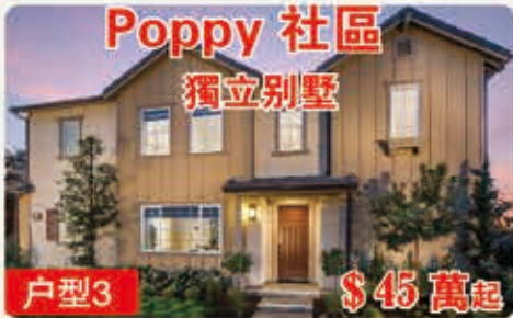
Poppy 社區 獨立別墅 戶型3 $45萬起 2110平方呎 4臥室 3浴室 2車位