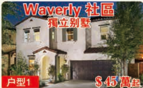
Waverly 社區 獨立別墅 戶型1 $45萬起 2110平方呎 4臥室 3浴室 2車位