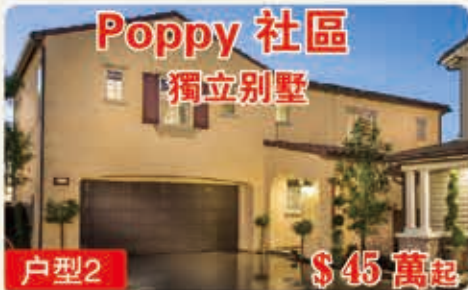
Poppy 社區 獨立別墅 戶型2 $45萬起 2003平方呎 3臥室 2.5浴室 2車位