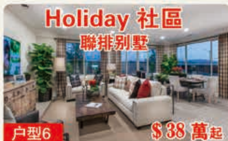
Holiday 社區 聯排別墅 戶型6 $38萬起 811平方呎 3臥室 2.5浴室 2車位 2層