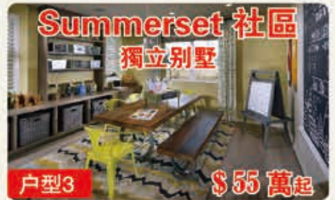
Summerset 社區 獨立別墅 戶型3 $55萬起 3354平方呎 4-5臥室 3.5-4.5浴室 2車位