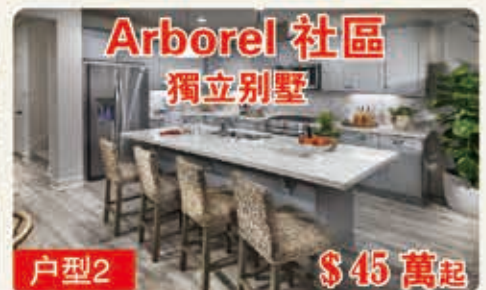
Arborel 社區 獨立別墅 戶型2 $45萬起 2068平方呎 4臥室 3浴室 2車位