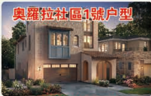
奧羅拉社區1號户型

这是位于尔湾中心的拥有封闭式豪华住宅的整体规划型高档门禁社区。它位于橙县的中心地带，也是尔湾的黄金地段，住户可尽享度假胜地般的生活。此全新住宅毗邻尔湾最佳地段，附近有 Irvine Spectrum，提供最好的餐饮、娱乐和购物场所，并有世界知名品牌商店。该社区拥有一个面积高达7100平方英尺的俱乐部，有高雅的接待区，活动室和俱乐部室等。孩子们可享有顶级尔湾联合学区的全十分高水准教育，Beacon Park 学校，Jeffrey Trail Middle School 中学，Portola 高中。