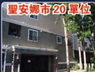
聖安娜市 20 單位

超過5%的投資回報率 全部兩臥室公寓 建築最近裝修 位於惠蒂爾上城區的優越位置 煤氣和電力單獨計量