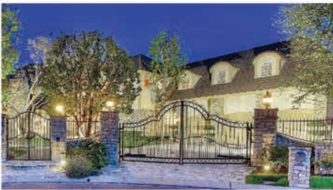
25502 Rodeo Cr | Laguna Hills | $3,658,800

極品豪宅, 即將推出! 建商 Bear Brand Ranch, 8房 10衛浴, 室內面積15,000平方英尺, 5.5英畝 售價美金一千一百八十八萬八千