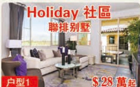
Holiday 社區 聯排別墅 戶型1 $28萬起 976平方呎 1臥室 1.5浴室 1車庫 2層