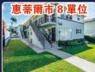
惠蒂爾市 8 單位