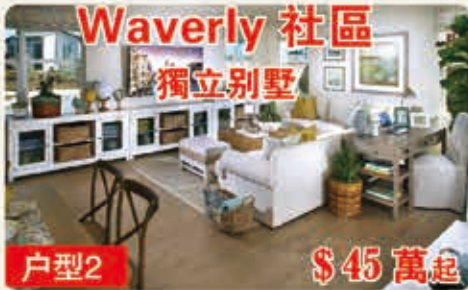
Waverly 社區 獨立別墅 戶型2 $45萬起 2200-2275平方呎 4臥室 3浴室 2車位