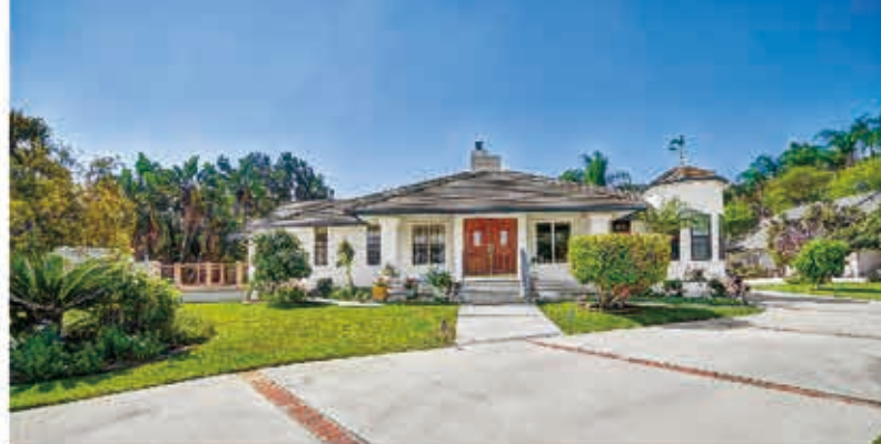
众里难寻一层楼，主屋加客房 (Guest House)，全部平地大院共24259尺，室内面积2402尺，1917年建

14746 Orange Grove Ave, Hacienda Heights • $989,000