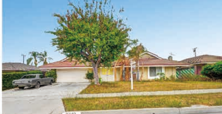
宽敞明亮的单層獨立屋，4房2浴，室内1,859平方英尺，地大10,630平方英尺，1962年建，絕佳的自住或投資機會

14746 Orange Grove Ave, Hacienda Heights • $989,000