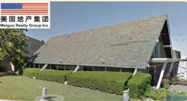
美國地產集團 Meigu Realty Group Inc