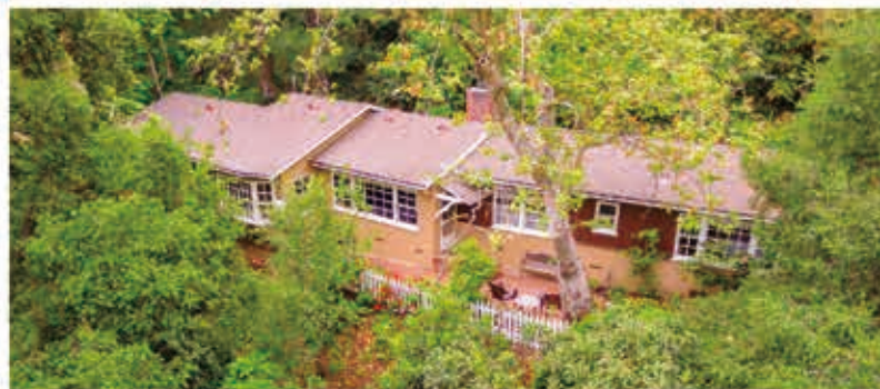
美麗幽靜的牧場風格的獨立屋，3房2浴，室内1793尺，地大26876尺，1953年建，僻靜，郁郁葱葱，可欣賞城市的燈光、風景、山坡和峽谷

2742 Montellano Avenue, Hacienda Heights • $650,000