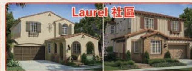
Laurel 社區 3種戶型選擇 4-5臥室 3-4浴室 2214-2805平方呎