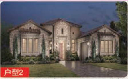
戶型2 4558-5824平方呎 423-541平方呎 4-6臥室 4.5-6.5浴室 4車庫