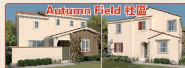
Autumn Field 社區 4種戶型選擇 3-4臥室 3-3.5浴室 1838-2120平方呎