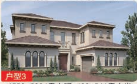
戶型3 4558-5824平方呎 423-541平方呎 5-9臥室 4.5-6.5浴室 4車庫