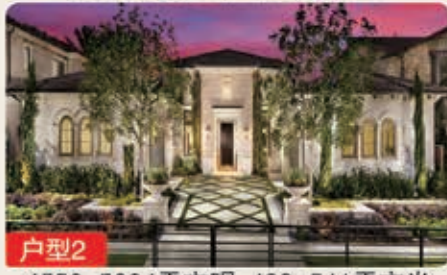
戶型2 4558-5824平方呎 423-541平方呎 4-6臥室 4.5-6.5浴室 4車庫