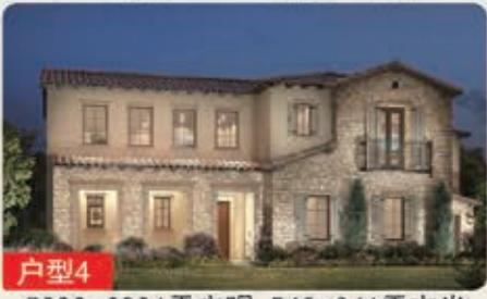
戶型4 5883-6901平方呎 546-641平方呎 5-7臥室 5.5-7.5浴室 4車庫