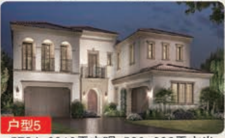
戶型5 5794-6813平方呎 538-632平方呎 5-6臥室 5.5-6.5浴室 4車庫