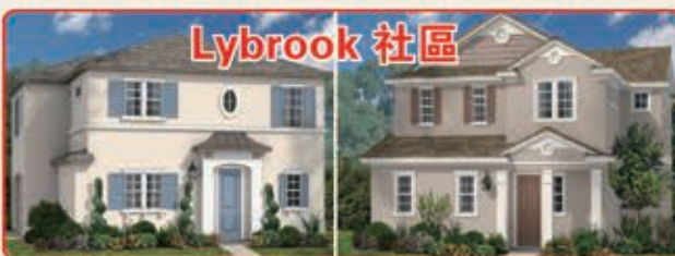
Lybrook 社區 7種戶型選擇 3臥室 2.5浴室 1610-2241平方呎

奇諾 (Chino) 是加州重點發展區域，社區規劃完善，交通便利。但目前該片區房價仍處於較低水平，平均40萬美金即可購置一處3房舒適住所，相比起擁有類似區位的奇諾崗 (Chino Hills)，鑽石吧 (Diamond Bar)，核桃市 (Walnut) 等熱門城市，這裡的房價低了一半，購買門檻低了不少。隨著洛杉磯市中心的東移，居住需求不斷增加，房價上漲也只是時間問題。