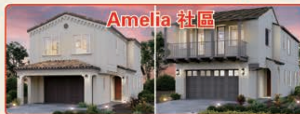
Amelia 社區 3種戶型選擇 4臥室 3浴室 2002-2168平方呎