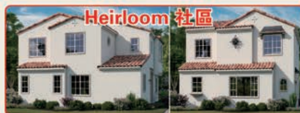
Heirloom 社區 4種戶型選擇 3-4臥室 3-3.5浴室 1386-1644平方呎