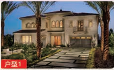
戶型1 5939-7129平方呎 551-662平方呎 5-7臥室 5.5-7.5浴室 4車庫