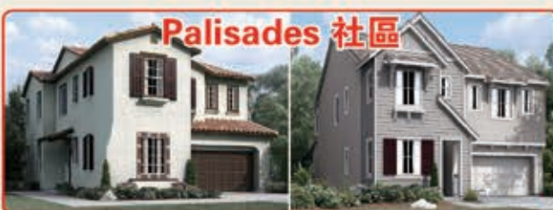
Palisades 社區 3種戶型選擇 3臥室 2.5浴室 2,438-2,775平方呎