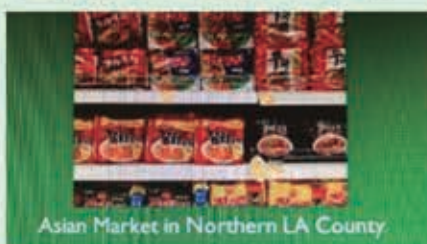
Asian Market in Northern LA County

年毛收入: $452,116, 月现金流: $77,000 超市创建于1997年, 二十多年来一直没有易主, 店主赚得相当丰厚的利润, 现打算退休。生意长期稳定, 周围几英里没有同类超市竞争, 仅需三名全职员工即可全天七天营业。店面二千四百平方英尺, 月租三千块, 租约还有十年, 店主提供四个星期的交接培训。