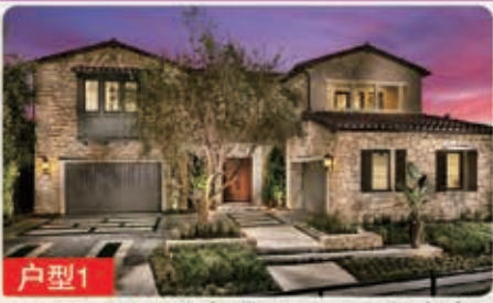
戶型1 5939-7129平方呎 551-662平方呎 5-7臥室 5.5-7.5浴室 4車庫