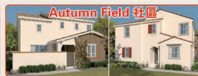
Autumn Field 社區 4種戶型選擇 3-4臥室 3-3.5浴室 1838-2120平方呎