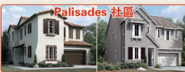
Palisades 社區 3種戶型選擇 3臥室 2.5浴室 2,438-2,775平方呎