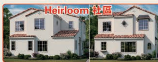
Heirloom 社區 4種戶型選擇 3-4臥室 3-3.5浴室 1386-1644平方呎