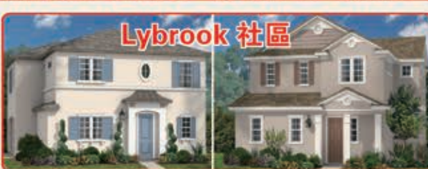
Lybrook 社區 7種戶型選擇 3臥室 2.5浴室 1610-2241平方呎

奇諾 (Chino) 是加州重點發展區域，社區規劃完善，交通便利。但目前該片區房價仍處於較低水平，平均40萬美金即可購置一處3房舒適住所，相比起擁有類似區位的奇諾崗 (Chino Hills)，鑽石吧 (Diamond Bar)，核桃市 (Walnut) 等熱門城市，這裡的房價低了大半，購買門檻低了不少。隨著洛杉磯市中心的東移，居住需求不斷增加，房價上漲也只是時間問題。