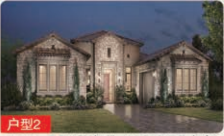
戶型2 4558-5824平方呎 423-541平方呎 4-6臥室 4.5-6.5浴室 4車庫