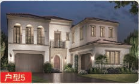
戶型5 5794-6813平方呎 538-632平方呎 5-6臥室 5.5-6.5浴室 4車庫