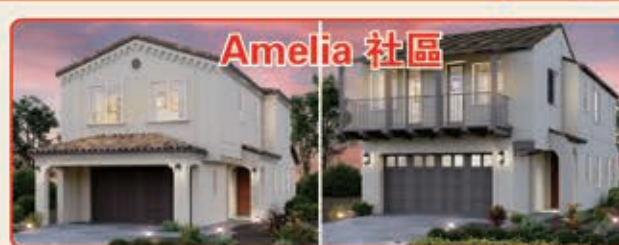
Amelia 社區 3種戶型選擇 4臥室 3浴室 2002-2168平方呎