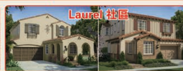
Laurel 社區 3種戶型選擇 4-5臥室 3-4浴室 2214-2805平方呎