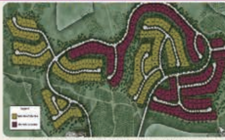
紅色部分為阿爾塔維斯塔小區 黃色部分為貝拉維斯塔小區

阿爾塔維斯塔小區坐落在一個僻靜的山頂上，果園山提供如詩如畫的小徑和鱈梨果園的壯麗景色，享受無與倫比的度假式設施。這個擁有5個獨特的2層家居設計，從5591到7197平方英尺不等，有4-9間臥室和4.5-9.5浴室，還有一個4558平方英尺的單層住宅，有4-6間臥室和4.5-6.5浴室。優秀的學校，便利的購物和靠近橙縣的主要交通樞紐使阿爾塔維斯塔烏斯山是一個很好的召喚回家的地方。廣闊的家園面積平均11,441平方英尺毗鄰鱈梨果園與橙縣，太平洋和卡塔利娜的壯麗景色。位於格羅斯夫爾大門後面，提供一流的設施，包括度假式休閒中心，美麗的公園和數英里的風景線。學生將就讀於頂級的塔斯廷聯合學區，已獲得加利福尼亞州傑出學校獎等榮譽表彰。包括費爾蒙私立學校在內的優秀私立學校就在附近。擁有寬敞的平面鏡頭，庭院式車道的新居設計，可選擇單層住宅。位置便利，距購物區、餐飲場所僅幾分鐘路程，包括烏斯山購物中心，市集廣場和歐文光譜中心。