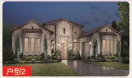
戶型2 4558-5824平方呎 423-541平方呎 4-6臥室 4.5-6.5浴室 4車庫