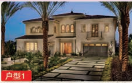
戶型1 5939-7129平方呎 551-662平方呎 5-7臥室 5.5-7.5浴室 4車庫