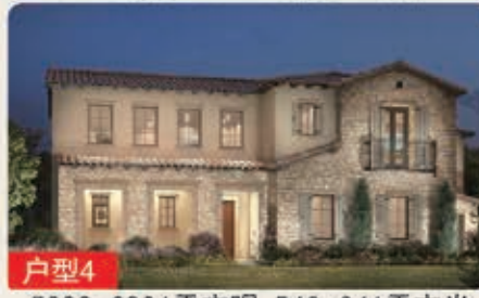
戶型4 5883-6901平方呎 546-641平方呎 5-7臥室 5.5-7.5浴室 4車庫