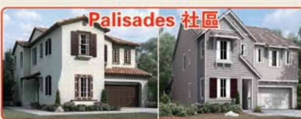
Palisades 社區 3種戶型選擇 3臥室 2.5浴室 2,438-2,775平方呎