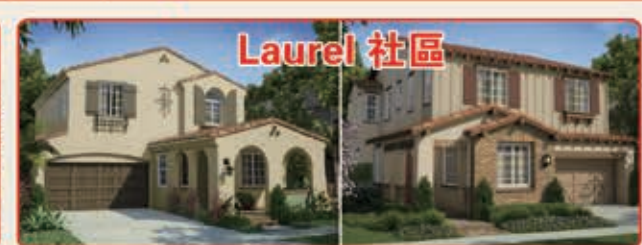
Laurel 社區 3種戶型選擇 4-5臥室 3-4浴室 2214-2805平方呎