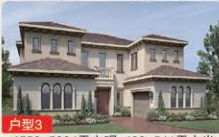
戶型3 4558-5824平方呎 423-541平方呎 5-9臥室 4.5-6.5浴室 4車庫