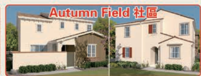
Autumn Field 社區 4種戶型選擇 3-4臥室 3-3.5浴室 1838-2120平方呎