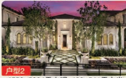
戶型2 4558-5824平方呎 423-541平方呎 4-6臥室 4.5-6.5浴室 4車庫