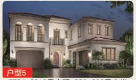
戶型5 5794-6813平方呎 538-632平方呎 5-6臥室 5.5-6.5浴室 4車庫