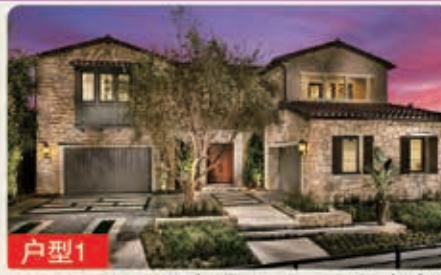
戶型1 5939-7129平方呎 551-662平方呎 5-7臥室 5.5-7.5浴室 4車庫