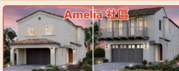
Amelia 社區 3種戶型選擇 4臥室 3浴室 2002-2168平方呎