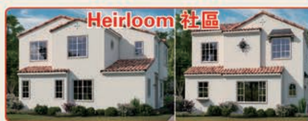
Heirloom 社區 4種戶型選擇 3-4臥室 3-3.5浴室 1386-1644平方呎