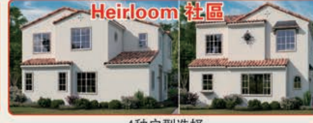
Heirloom 社區 4種戶型選擇 3-4臥室 3-3.5浴室 1386-1644平方呎