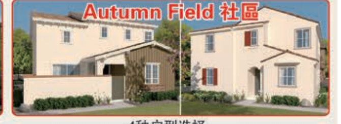
Autumn Field 社區 4種戶型選擇 3-4臥室 3-3.5浴室 1838-2120平方呎