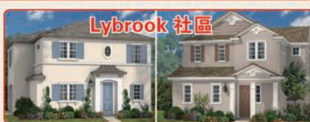
Lybrook 社區 7種戶型選擇 3臥室 2.5浴室 1610-2241平方呎

8個小區 多種戶型 風格各異 1386-2805平方呎 3-5臥室 2-3浴室 距離安大略國際機場僅8英里 鄰近71號和91號公路出口 華人區滿分小學/中學 升值潛力大 外國人投資首選 奇諾(Chino)是加州重點發展區域，社區規劃完善，交通便利。但目前該片區房價仍處於較低水平，平均40萬美金即可購置一處3房舒適住所，相比起擁有類似區位的奇諾崗(Chino Hills)，鑽石吧(Diamond Bar)，核桃市(Walnut)等熱門城市，這裡的房價低了大半，購買門檻低了不少。隨著洛杉磯市中心的東移，居住需求不斷增加，房價上漲也只是時間問題。