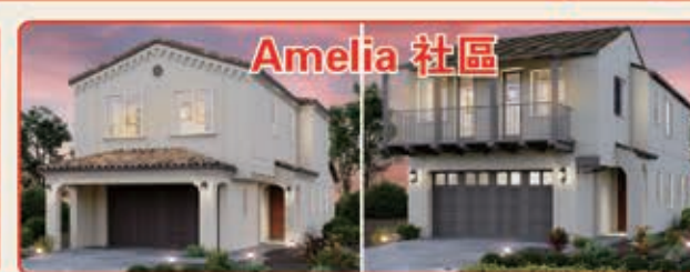
Amelia 社區 3種戶型選擇 4臥室 3浴室 2002-2168平方呎