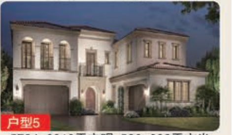
戶型5 5794-6813平方呎 538-632平方呎 5-6臥室 5.5-6.5浴室 4車庫