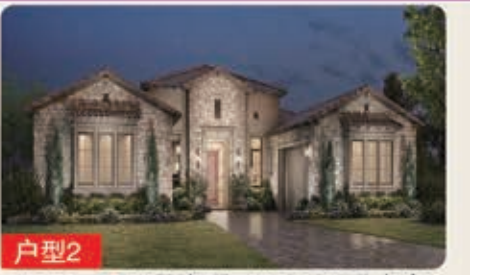
戶型2 4558-5824平方呎 423-541平方呎 4-6臥室 4.5-6.5浴室 4車庫