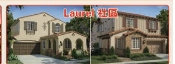
Laurel 社區 3種戶型選擇 4-5臥室 3-4浴室 2214-2805平方呎