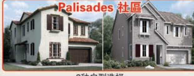
Palisades 社區 3種戶型選擇 3臥室 2.5浴室 2,438-2,775平方呎