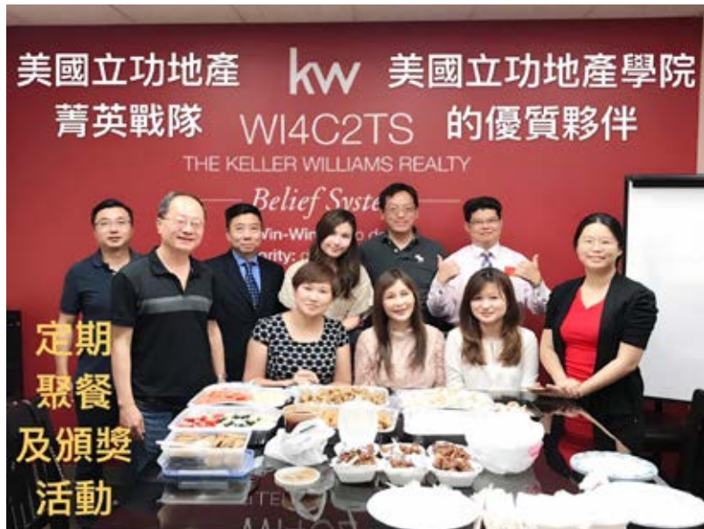
美國立功地產 kw 美國立功地產學院 菁英戰隊 W14C2TS 的優質夥伴 THE KELLER WILLIAMS REALTY Belief System Fin-Win Realty