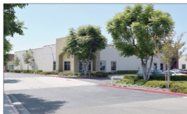
Chino 9,477 呎 $203萬7