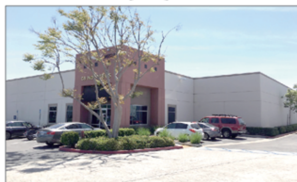
Chino 8,252 呎 $180萬7