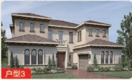
戶型3 4558-5824平方呎 423-541平方呎 5-9臥室 4.5-6.5浴室 4車庫