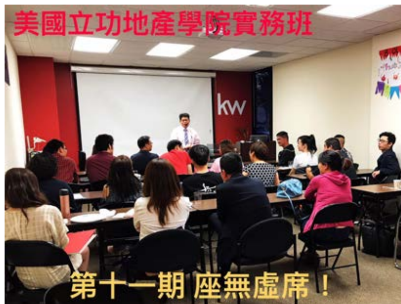
美國立功地產學院實務班