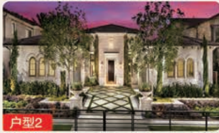
戶型2 4558-5824平方呎 423-541平方呎 4-6臥室 4.5-6.5浴室 4車庫