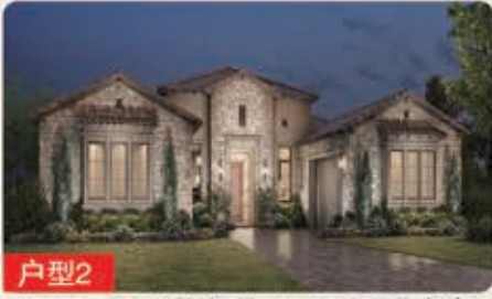
戶型2 4558-5824平方呎 423-541平方呎 4-6臥室 4.5-6.5浴室 4車庫