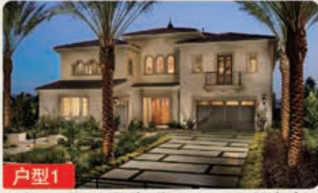
戶型1 5939-7129平方呎 551-662平方呎 5-7臥室 5.5-7.5浴室 4車庫