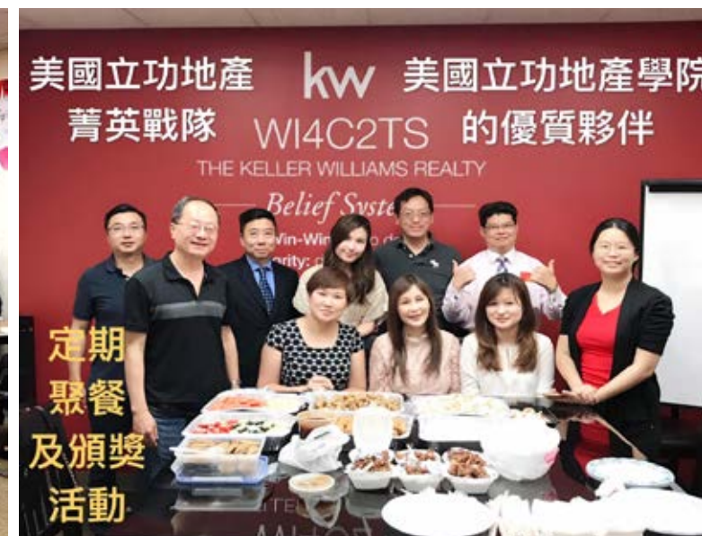
美國立功地產 kw 美國立功地產學院 菁英戰隊 W14C2TS 的優質夥伴 THE KELLER WILLIAMS REALTY Belief System Fin-Win Realty