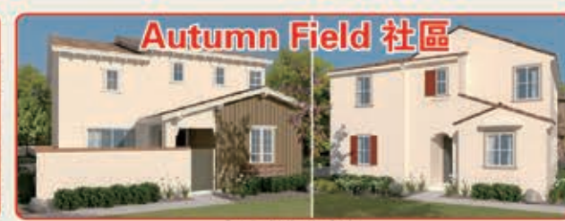
Autumn Field 社區 4種戶型選擇 3-4臥室 3-3.5浴室 1838-2120平方呎