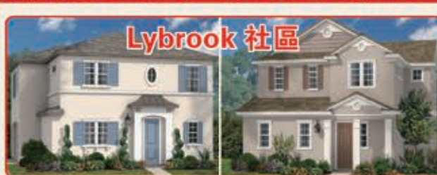
Lybrook 社區 7種戶型選擇 3臥室 2.5浴室 1610-2241平方呎

奇諾 (Chino) 是加州重點發展區域，社區規劃完善，交通便利。但目前該片區房價仍處於較低水平，平均40萬美金即可購置一處3房舒適住所，相比起擁有類似區位的奇諾崗 (Chino Hills)，鑽石吧 (Diamond Bar)，核桃市 (Walnut) 等熱門城市，這裡的房價低了一半，購買門檻低了不少。隨著洛杉磯市中心的東移，居住需求不斷增加，房價上漲也只是時間問題。