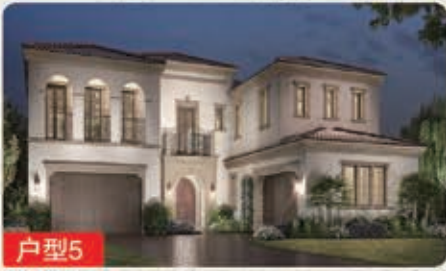
戶型5 5794-6813平方呎 538-632平方呎 5-6臥室 5.5-6.5浴室 4車庫