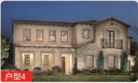
戶型4 5883-6901平方呎 546-641平方呎 5-7臥室 5.5-7.5浴室 4車庫