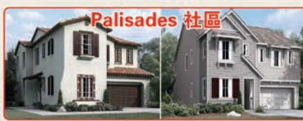
Palisades 社區 3種戶型選擇 3臥室 2.5浴室 2,438-2,775平方呎