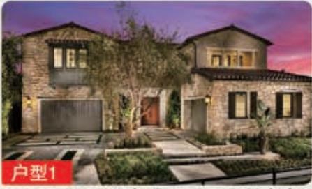
戶型1 5939-7129平方呎 551-662平方呎 5-7臥室 5.5-7.5浴室 4車庫