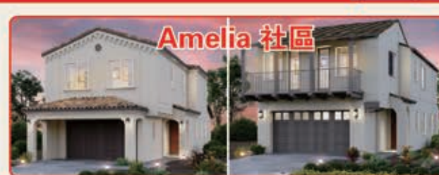
Amelia 社區 3種戶型選擇 4臥室 3浴室 2002-2168平方呎