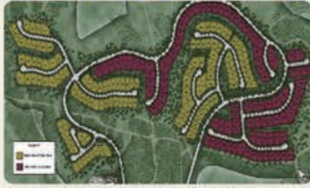
紅色部分為阿爾塔維斯塔小區 黃色部分為貝拉維斯塔小區

阿爾塔維斯塔小區坐落在一個僻靜的山頂上，果園山提供如詩如畫的小徑和鱈梨果園的壯麗景色，享受無與倫比的度假式設施。這個擁有5個獨特的2層家居設計，從5591到7197平方英尺不等，有4-9間臥室和4.5-9.5浴室，還有一個4558平方英尺的單層住宅，有4-6間臥室和4.5-6.5浴室。優秀的學校，便利的購物和靠近橙縣的主要交通樞紐使阿爾塔維斯塔烏山是一個很好的召喚回家的地方。廣闊的家園面積平均11,441平方英尺毗鄰鱈梨果園與橙縣，太平洋和卡塔利娜的壯麗景色。位於格羅斯夫的大門後面，提供一流的設施，包括度假式休閒中心，美麗的公園和數英里的風景線。學生將就讀於頂級的塔斯廷聯合學區，已獲得加利福尼亞州傑出學校獎等榮譽表彰。包括費爾蒙私立學校在內的優秀私立學校就在附近。擁有寬敞的平面鏡頭，庭院式車道的新居設計，可選擇單層住宅。位置便利，距購物區，餐飲場所僅幾分鐘路程，包括烏昂山購物中心，市集廣場和歐文光譜中心。