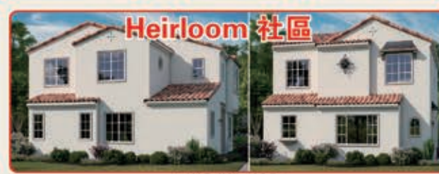
Heirloom 社區 4種戶型選擇 3-4臥室 3-3.5浴室 1386-1644平方呎