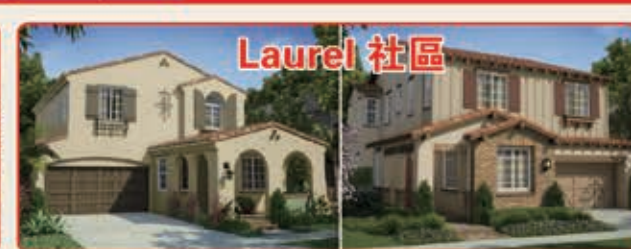
Laurel 社區 3種戶型選擇 4-5臥室 3-4浴室 2214-2805平方呎