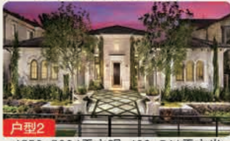
戶型2 4558-5824平方呎 423-541平方呎 4-6臥室 4.5-6.5浴室 4車庫