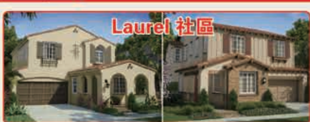
Laurel 社區 3種戶型選擇 4-5臥室 3-4浴室 2214-2805平方呎