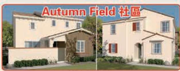
Autumn Field 社區 4種戶型選擇 3-4臥室 3-3.5浴室 1838-2120平方呎