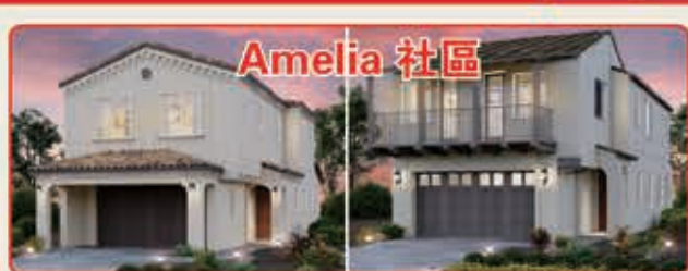
Amelia 社區 3種戶型選擇 4臥室 3浴室 2002-2168平方呎