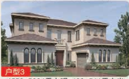
戶型3 4558-5824平方呎 423-541平方呎 5-9臥室 4.5-6.5浴室 4車庫