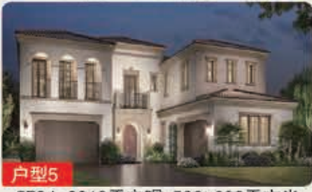
戶型5 5794-6813平方呎 538-632平方呎 5-6臥室 5.5-6.5浴室 4車庫