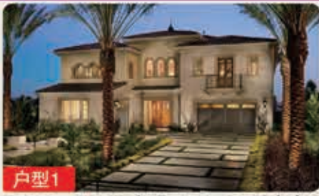
戶型1 5939-7129平方呎 551-662平方呎 5-7臥室 5.5-7.5浴室 4車庫