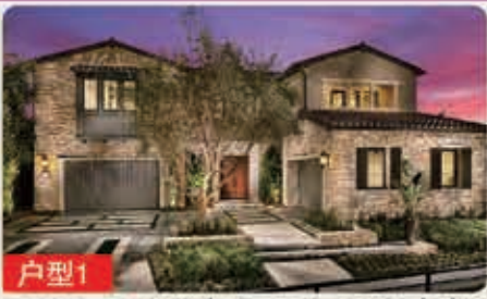
戶型1 5939-7129平方呎 551-662平方呎 5-7臥室 5.5-7.5浴室 4車庫