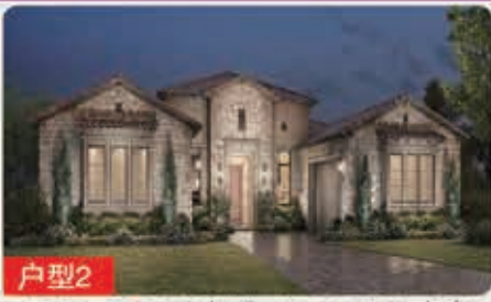
戶型2 4558-5824平方呎 423-541平方呎 4-6臥室 4.5-6.5浴室 4車庫