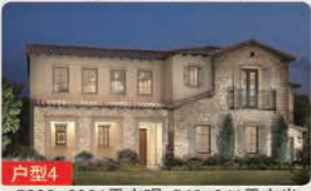
戶型4 5883-6901平方呎 546-641平方呎 5-7臥室 5.5-7.5浴室 4車庫