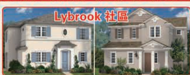
Lybrook 社區 7種戶型選擇 3臥室 2.5浴室 1610-2241平方呎

奇諾 (Chino) 是加州重點發展區域，社區規劃完善，交通便利。但目前該片區房價仍處於較低水平，平均40萬美金即可購置一處3房舒適住所，相比起擁有類似區位的奇諾崗 (Chino Hills)，鑽石吧 (Diamond Bar)，核桃市 (Walnut) 等熱門城市，這裡的房價低了大半，購買門檻低了不少。隨著洛杉磯市中心的東移，居住需求不斷增加，房價上漲也只是時間問題。