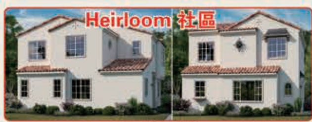
Heirloom 社區 4種戶型選擇 3-4臥室 3-3.5浴室 1386-1644平方呎