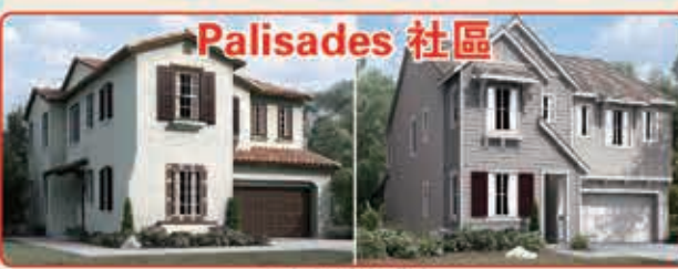
Palisades 社區 3種戶型選擇 3臥室 2.5浴室 2,438-2,775平方呎