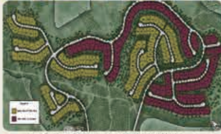
紅色部分為阿爾塔維斯塔小區 黃色部分為貝拉維斯塔小區

阿爾塔維斯塔小區坐落在一個僻靜的山頂上，果園山提供如詩如畫的小徑和鱒果園的壯麗景色，享受無與倫比的度假式設施。這個擁有5個獨特的2層家居設計，從5591到7197平方英尺不等，有4-9間臥室和4.5-9.5浴室，還有一個4558平方英尺的單層住宅，有4-6間臥室和4.5-6.5浴室。優秀的學校，便利的購物和靠近橙縣的主要交通樞紐使阿爾塔維斯塔烏普山是一個很好的召喚回家的地方。廣闊的家園面積平均11,441平方英尺毗鄰鱒果園與橙縣，太平洋和卡塔利娜的壯麗景色。位於格羅斯夫的大門後面，提供一流的設施，包括度假式休閒中心，美麗的公園和數英里的風景線。學生將就讀於頂級的塔斯廷聯合學區，已獲得加利福尼亞州傑出學校獎等榮譽表彰。包括費爾蒙私立學校在內的優秀私立學校就在附近。擁有寬敞的平面鏡頭，庭院式車道的新居設計，可選擇單層住宅。位置便利，距購物區，餐飲場所僅幾分鐘路程，包括烏普山購物中心，市集廣場和歐文光譜中心。