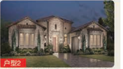
戶型2 4558-5824平方呎 423-541平方呎 4-6臥室 4.5-6.5浴室 4車庫