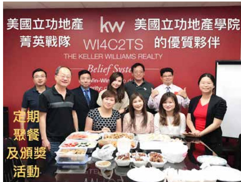
美國立功地產 kw 美國立功地產學院 菁英戰隊 W14C2TS 的優質夥伴 THE KELLER WILLIAMS REALTY Belief System 定期聚餐及頒獎活動