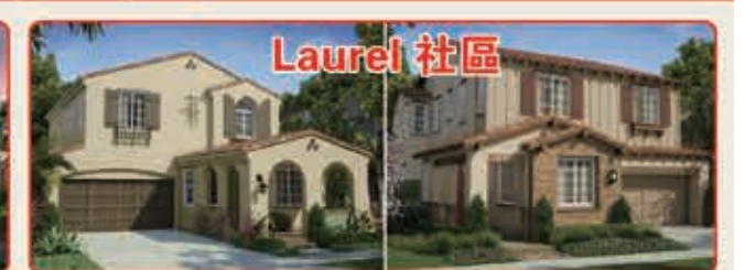
Laurel 社區 3種戶型選擇 4-5臥室 3-4浴室 2214-2805平方呎