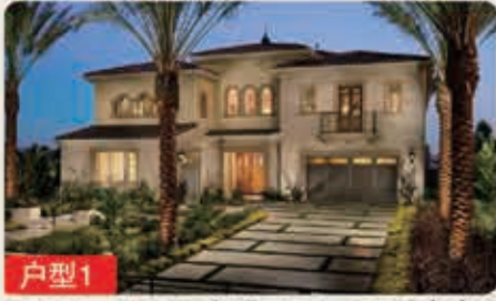
戶型1 5939-7129平方呎 551-662平方呎 5-7臥室 5.5-7.5浴室 4車庫