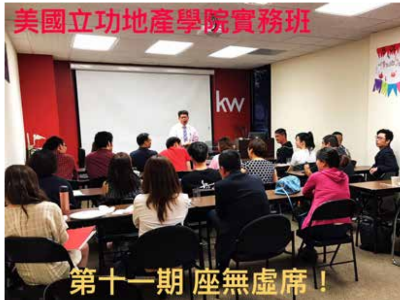
美國立功地產學院實務班