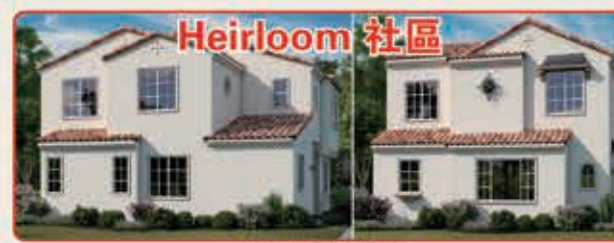
Heirloom 社區 4種戶型選擇 3-4臥室 3-3.5浴室 1386-1644平方呎