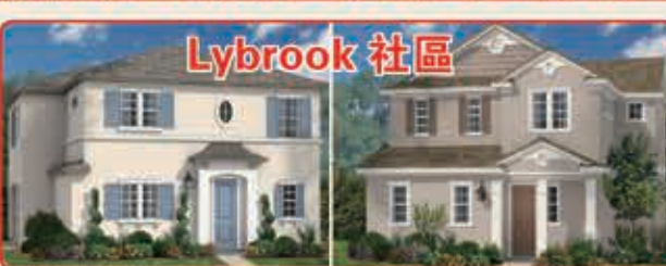
Lybrook 社區 7種戶型選擇 3臥室 2.5浴室 1610-2241平方呎

• 8個小區 多種戶型 風格各異 • 1386-2805平方呎 3-5臥室 2-3浴室 • 距離安大略國際機場僅8英里 • 鄰近71號和91號公路出口 • 華人區滿分小學/中學, 升值潛力大 • 外國人投資首選 奇諾 (Chino) 是加州重點發展區域, 社區規劃完善, 交通便利。但目前該片區房價仍處於較低水平, 平均40萬美金即可購置一處3房舒適住所, 相比起擁有類似區位的奇諾崗 (Chino Hills), 鑽石吧 (Diamond Bar), 核桃市 (Walnut) 等熱門城市, 這裡的房價低了大半, 購買門檻低了不少。隨著洛杉磯市中心的東移, 居住需求不斷增加, 房價上漲也只是時間問題。