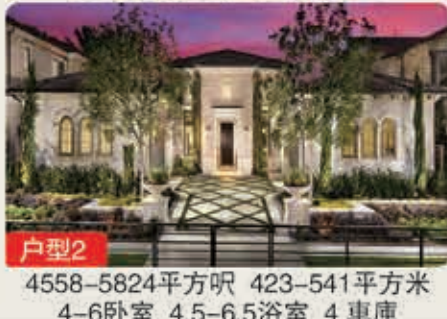
戶型2 4558-5824平方呎 423-541平方呎 4-6臥室 4.5-6.5浴室 4車庫