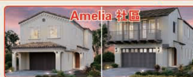
Amelia 社區 3種戶型選擇 4臥室 3浴室 2002-2168平方呎