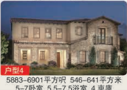
戶型4 5883-6901平方呎 546-641平方呎 5-7臥室 5.5-7.5浴室 4車庫