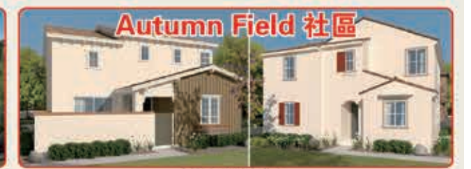
Autumn Field 社區 4種戶型選擇 3-4臥室 3-3.5浴室 1838-2120平方呎