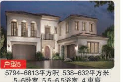
戶型5 5794-6813平方呎 538-632平方呎 5-6臥室 5.5-6.5浴室 4車庫