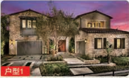
戶型1 5939-7129平方呎 551-662平方呎 5-7臥室 5.5-7.5浴室 4車庫