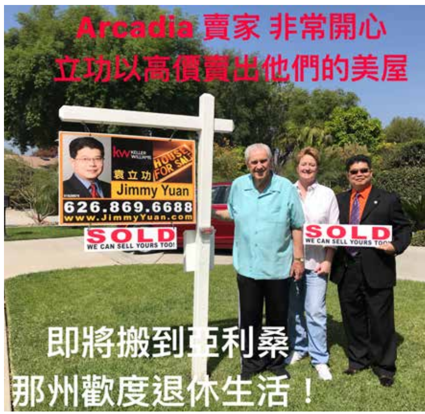
Arcadia 賣家 非常開心 立功以高價賣出他們的美屋

若您正在考慮想高價賣屋或低價買房，歡迎免費諮詢圓您美夢、立馬成功的袁立功，諮詢專線：626.869.6688。