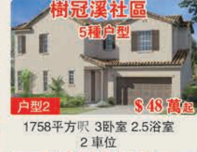
樹冠溪社區 5種戶型 戶型2 $48萬起 1758平方呎 3臥室 2.5浴室 2車位