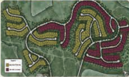
紅色部分為阿爾塔維斯塔小區 黃色部分為貝拉維斯塔小區

阿爾塔維斯塔小區坐落在一個僻靜的山頂上，果園山提供如詩如畫的小徑和鱈梨果園的壯麗景色，享受無與倫比的度假式設施。這個擁有5個獨特的2層家居設計，從5591到7197平方英尺不等，有4-9間臥室和4.5-9.5浴室，還有一個4558平方英尺的單層住宅，有4-6間臥室和4.5-6.5浴室。優秀的學校，便利的購物和靠近橙縣的主要交通樞紐使阿爾塔維斯塔烏普山是一個很好的召喚回家的地方。廣闊的家園面積平均11,441平方英尺毗鄰鱈梨果園與橙縣，太平洋和卡塔利娜的壯麗景色。位於格羅斯夫的大門後面，提供一流的設施，包括度假式休閒中心，美麗的公園和數英里的風景線。學生將就讀於頂級的塔斯廷聯合學區，已獲得加利福尼亞州傑出學校獎等榮譽表彰。包括費爾蒙私立學校在內的優秀私立學校就在附近。擁有寬敞的平面鏡頭，庭院式車道的新居設計，可選擇單層住宅。位置便利，距購物區，餐飲場所僅幾分鐘路程，包括烏普山購物中心，市集廣場和歐文光譜中心。