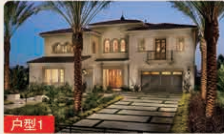
戶型1 5939-7129平方呎 551-662平方呎 5-7臥室 5.5-7.5浴室 4車庫