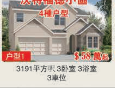
沃特福德小區 4種戶型 戶型1 $58萬起 3191平方呎 3臥室 3浴室 3車位