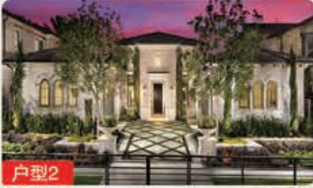
戶型2 4558-5824平方呎 423-541平方呎 4-6臥室 4.5-6.5浴室 4車庫