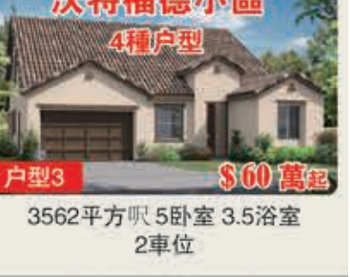
沃特福德小區 4種戶型 戶型3 $60萬起 3562平方呎 5臥室 3.5浴室 2車位