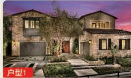
戶型1 5939-7129平方呎 551-662平方呎 5-7臥室 5.5-7.5浴室 4車庫