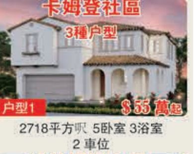
卡姆登社區 3種戶型 戶型1 $55萬起 2718平方呎 5臥室 3浴室 2車位