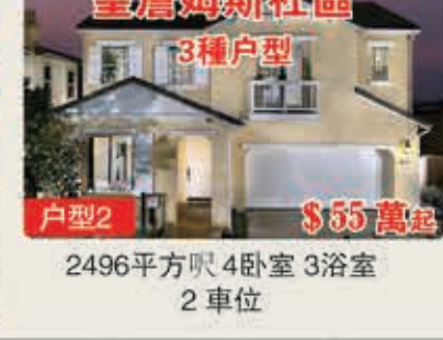
聖詹姆斯社區 3種戶型 戶型2 $55萬起 2496平方呎 4臥室 3浴室 2車位