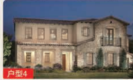
戶型4 5883-6901平方呎 546-641平方呎 5-7臥室 5.5-7.5浴室 4車庫