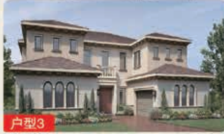
戶型3 4558-5824平方呎 423-541平方呎 5-9臥室 4.5-6.5浴室 4車庫