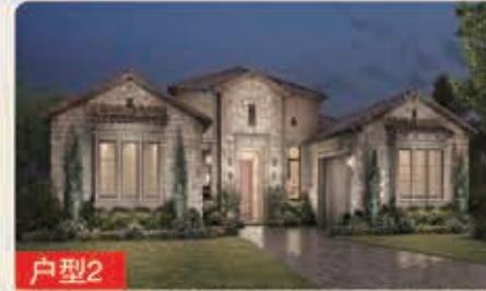
戶型2 4558-5824平方呎 423-541平方呎 4-6臥室 4.5-6.5浴室 4車庫