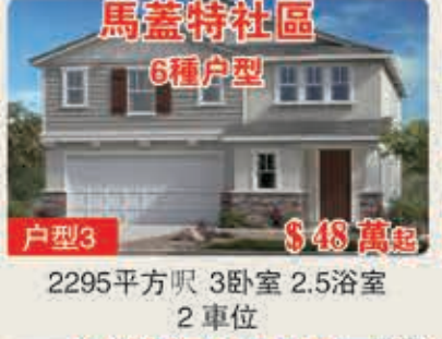
馬蓋特社區 6種戶型 戶型3 $48萬起 2295平方呎 3臥室 2.5浴室 2車位