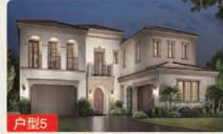
戶型5 5794-6813平方呎 538-632平方呎 5-6臥室 5.5-6.5浴室 4車庫