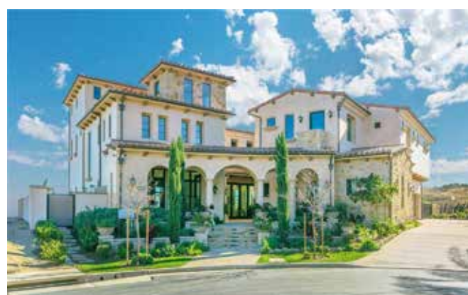
美國立地地產學院

考執照成績表現優異，去年三月份共有八位學員一次即考取加州專業地產執照！每月平均約有 1-5 位學員考取地產執照。美國立地地產學院“執照班現在聖蓋博市、鑽石吧市、羅蘭岡(兩班執照班/一班實務班)、爾灣四大華人聚集城市，共六班同步招生中，所有課程前 1.5 小時歡迎免費試聽。學費僅 $250 包括一本我們教務組精心編輯的“立功中英雙語重點教材”，淺顯易懂。同時加買英文教材及考古題原價 $100，連學費原價 $350，特價僅 $330。所有授課老師專業、用心教學、口碑最佳。六周為一期，半年內可重複上