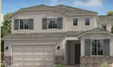
和諧月色區 戶型4 4房3浴 室內2409呎 樓層2 車庫2 $ 479,990