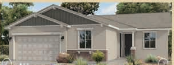
河灣寧靜區 戶型1 4房2浴 室內2284呎 樓層1 車庫2 $ 523,990