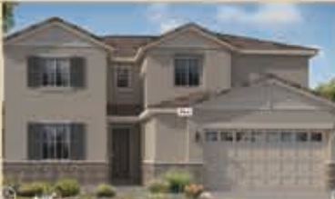
寧靜致遠區 戶型3C 5房3浴 室內3105呎 樓層2 車庫2 $ 532,990