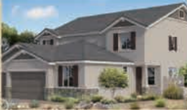
寧靜致遠區 戶型4B 5房4.5浴 室內3672呎 樓層2 車庫3 $ 567,990