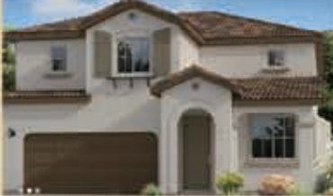
和諧月色區 戶型3A 4房3浴 室內2277呎 樓層2 車庫2 $ 468,990