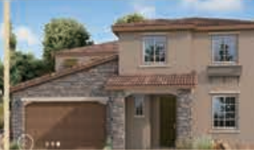
河灣寧靜區 戶型4 5房3浴 室內2409呎 樓層2 車庫3 $ 598,990