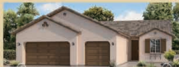
河灣寧靜區 戶型1 4房2浴 室內2277呎 樓層1 車庫3 $ 500,490