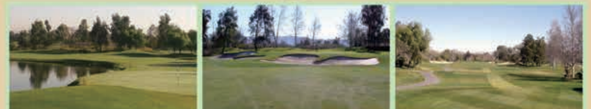
Goose Creek Golf Club 臨近高爾夫球場