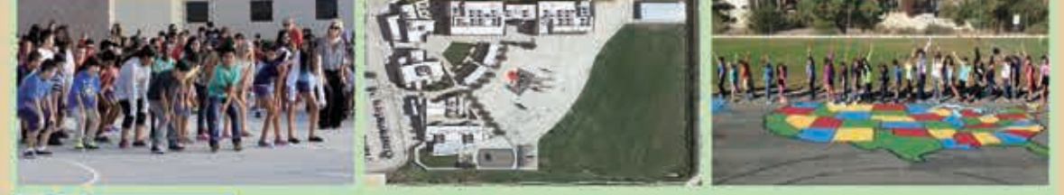
Louis Vandermolle Fundamental Elementary School 臨近學校9分小學