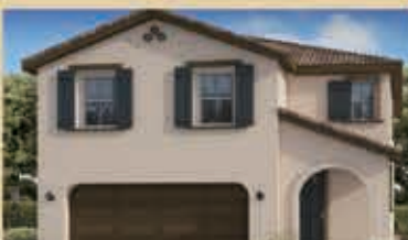
和諧月色區 戶型1A 3房2.5浴 室內1827呎 樓層2 車庫2 $ 451,990

得天獨厚的地理環境, 近原生态森林, 絕佳的天然氧吧。 靠近 15 號高速公路, 與科羅納市僅 10 分鐘, 走路即可到高品质的 9 分小學, 學途前景無限, 商場、餐館、購物, 東邊為高爾夫球場, 為高雅人士提供休閒娛樂設施。