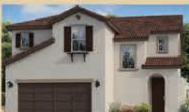
和諧月色區 戶型2 4房3浴 室內2017呎 樓層2 車庫2 $ 464,190