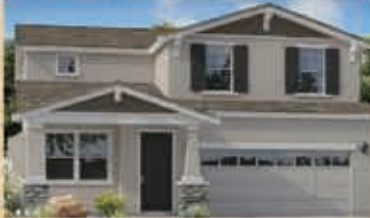
和諧月色區 戶型3C 4房3浴 室內2277呎 樓層2 車庫2 $ 468,990