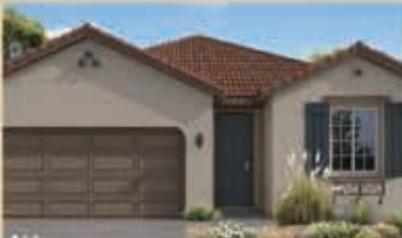
寧靜致遠區 戶型1 3房2浴 室內1946呎 樓層1 車庫2 $ 479,990