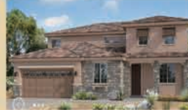
河灣寧靜區 戶型3 5房3浴 室內3404呎 樓層2 車庫2 $ 562,290