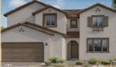
寧靜致遠區 戶型3A 5房3浴 室內3105呎 樓層2 車庫2 $ 532,990