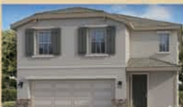
和諧月色區 戶型1B 3房2.5浴 室內1827呎 樓層2 車庫2 $ 451,990