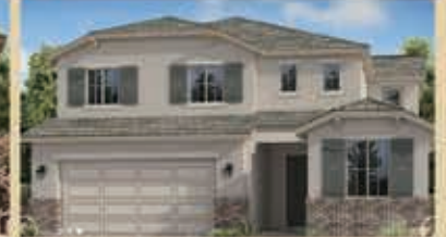
河灣寧靜區 戶型5 6房4浴 室內4122呎 樓層2 車庫2 $ 632,490