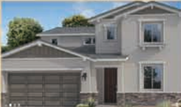
寧靜致遠區 戶型2 4房3浴 室內2809呎 樓層2 車庫2 $ 518,490