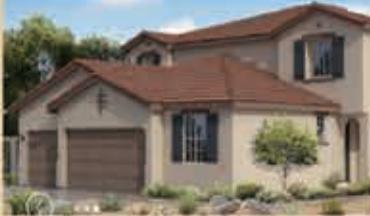
寧靜致遠區 戶型4A 5房4.5浴 室內3672呎 樓層2 車庫3 $ 567,990