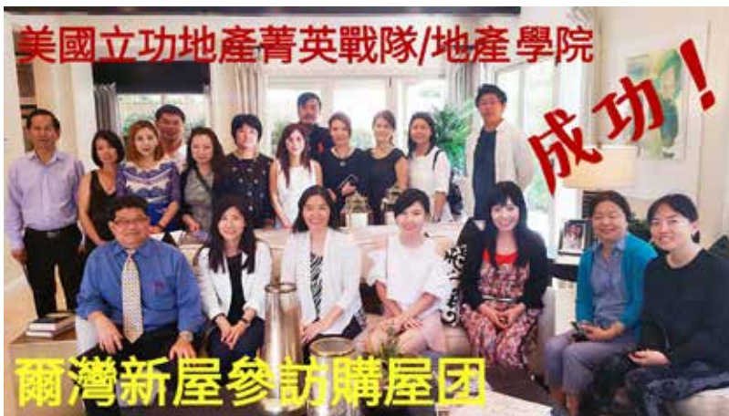
美國立功地產菁英戰隊/地產學院 爾灣新屋參訪購屋團 美國立功地產菁英戰隊/地產學院 Toll Brothers / Lake Forest

賀洛杉磯頗受好評的“美國立功地產學院”考取執照成績表現優異，三月份共有八位學員一次即考取加州專業地產執照！“美國立功地產學院”執照班現在爾灣、亞凱迪亞、羅蘭岡、聖蓋博市四大華人聚集地同步招生中，所有課程前 1.5 小時歡迎免費試聽。學費僅 $250 包括一本我們教