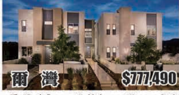
爾灣 $777,490 3房2浴 室內2015呎 地大4000呎 2017年建