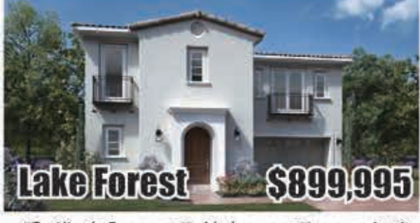
Lake Forest $899,995 4房5浴 室內2545呎 地大3406呎 2017年建