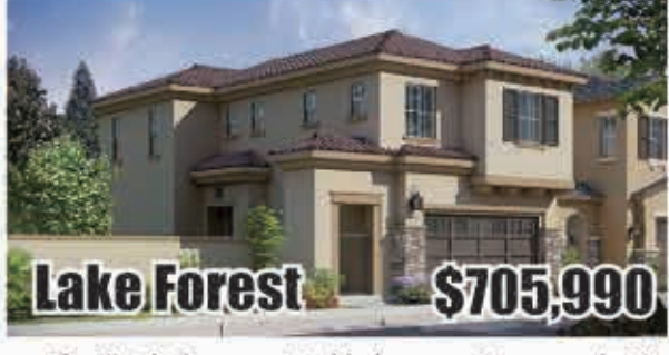
Lake Forest $705,990 3房3浴 室內1901呎 地大2154呎 2017年建