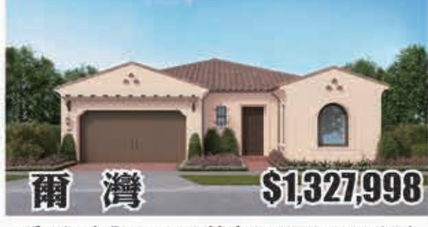
爾灣 $1,327,998 3房3浴 室內2033呎 地大3500呎 2017年建