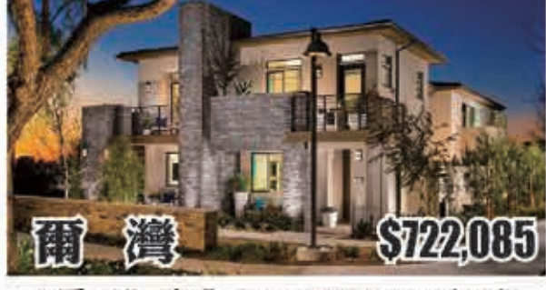
爾灣 $722,085 3房3浴 室內1806呎 2017年建