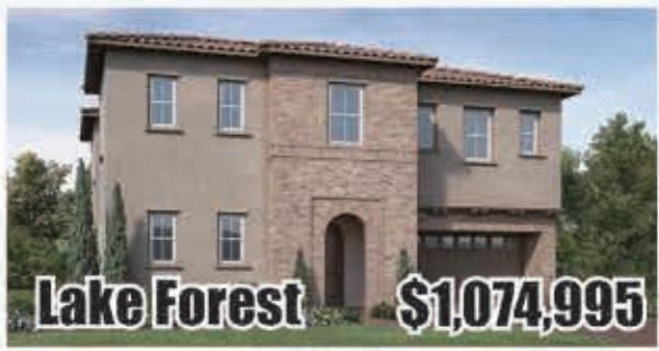
Lake Forest $1,074,995 5房5浴 室內3202呎 地大4360呎 2017年建