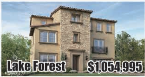
Lake Forest $1,054,995 5房5浴 室內3665呎 地大3782呎 2017年建

“金色牧欄”連鎖自助餐 EB-5 投資移民直投項目 您的美國事業與綠卡一次完成 QQ/微信 626 677 6488 2475051295