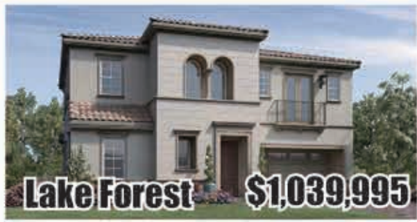
Lake Forest $1,039,995 4房4浴 室內3049呎 地大4360呎 2017年建