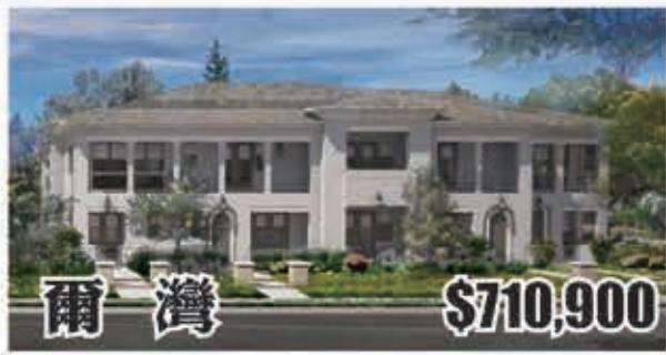
爾灣 $710,900 3房2浴 室內2076呎 2017年建