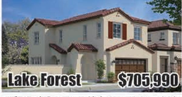
Lake Forest $705,990 3房3浴 室內1817呎 地大2048呎 2017年建