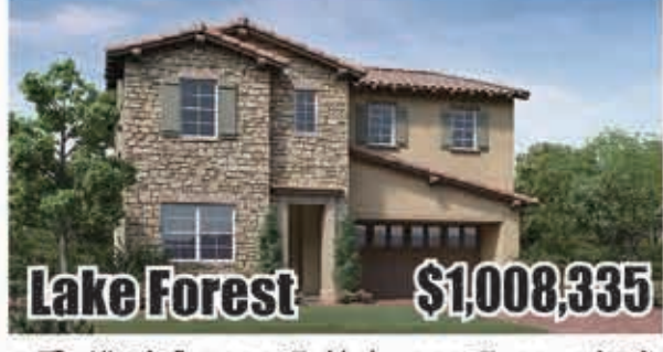
Lake Forest $1,008,335 5房4浴 室內2650呎 地大4262呎 2017年建