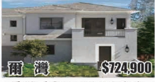
爾灣 $724,900 3房2浴 室內1820呎 2017年建