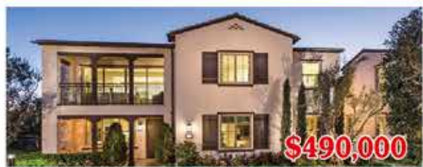
$490,000 東木村-阿瓦隆區1號A、B戶型 2房2浴 室內1161尺