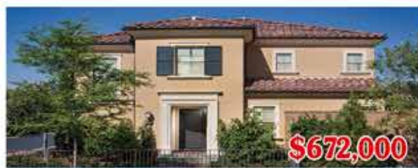
$672,000 東木村-海倫娜區2號戶型 3房2.5浴 室內1632尺