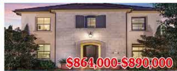
$864,000-$890,000 東木村-馬林區1號戶型 3房2.5浴 室內1948-1971尺