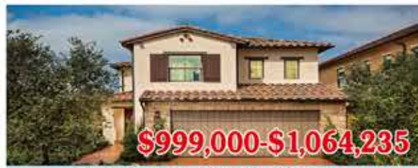
$999,000-$1,064,235 東木村-皮埃蒙特區1號戶型 4房3浴 室內2,165-2,207尺