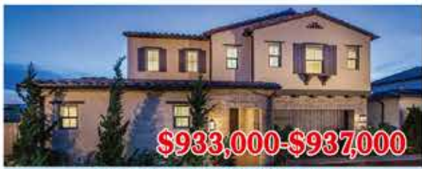
$933,000-$937,000 東木村-馬林區2號戶型 4房3浴 室內2155尺