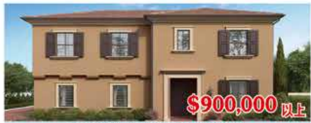
$900,000 以上 東木村-馬林區1Y號戶型 3房3.5浴 室內2244尺