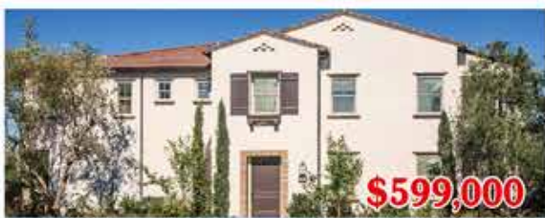
$599,000 東木村-阿瓦隆區3號A、B戶型 2房2浴 室內1544尺