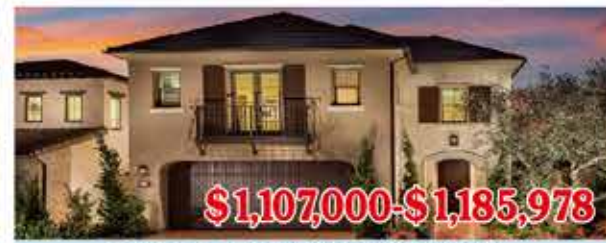
$1,107,000-$1,185,978 東木村-皮埃蒙特區2號戶型 4房4浴 室內2500尺