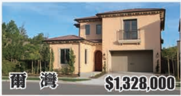
爾灣 $1,328,000 4房3浴 室內2683呎 地大3600呎 2017年建