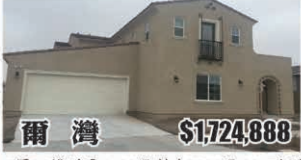
爾灣 $1,724,888 5房5.5浴 室內4100呎 地大7500呎 2017年建