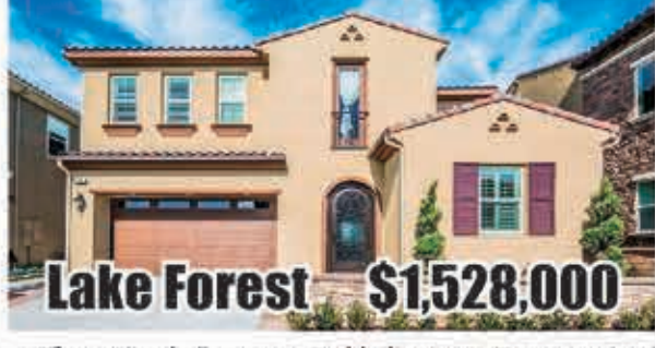
Lake Forest $1,528,000 5房4.5浴 室內3327呎 地大5000呎 2016年建