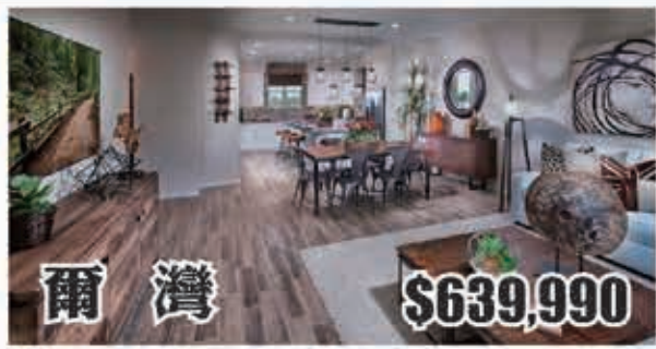
爾灣 $639,990 2房2.5浴 室內1661呎 2016年建