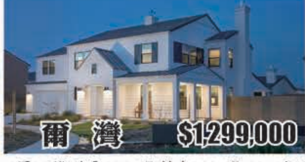
爾灣 $1,299,000 3房3.5浴 室內2800呎 地大7222呎 2016年建