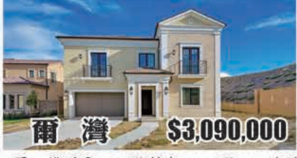
爾灣 $3,090,000 4房4.5浴 室內4608呎 地大13068呎 2016年建