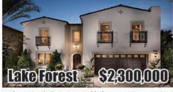
Lake Forest $2,300,000 5房5.5浴 室內3643呎 地大5885呎 2016年建