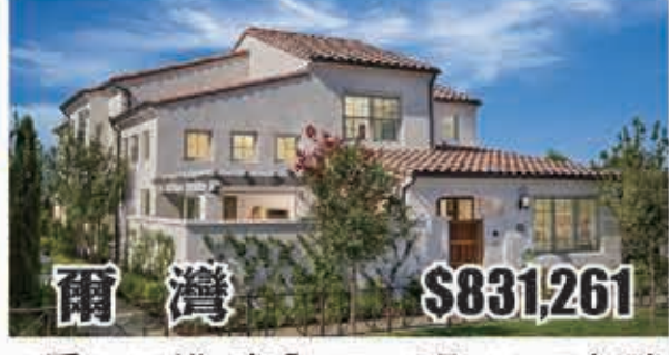
爾灣 $831,261 3房3.25浴 室內1718呎 2017年建