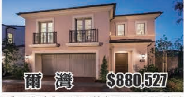
爾灣 $880,527 3房2.5浴 室內1971呎 地大3135呎 2017年建