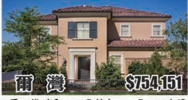
爾灣 $754,151 3房2.5浴 室內1632呎 地大2055呎 2017年建