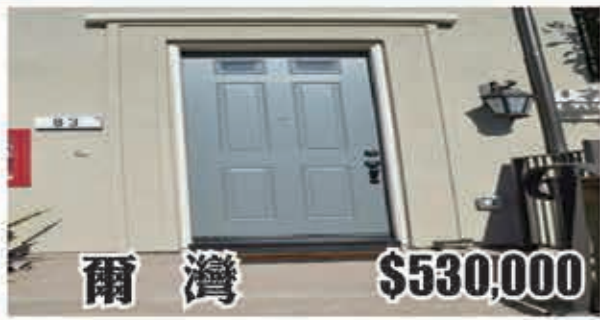
爾灣 $530,000 2房2.5浴 室內1258呎 2016年建