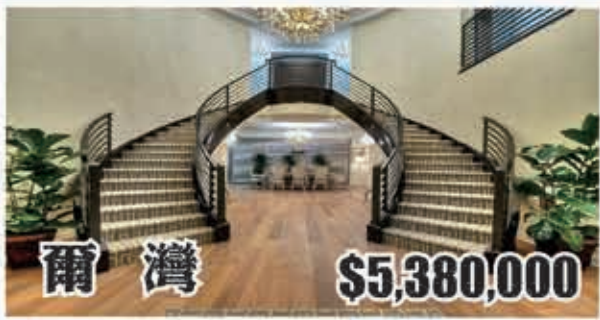
爾灣 $5,380,000 6房6.5浴 室內6200呎 地大12197呎 2016年建

“金色牧欄”連鎖自助餐 EB-5 投資移民直投項目 您的美國事業與綠卡一次完成 QQ/微信 626 677 6488 2475051295