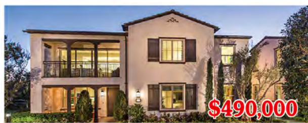
東木村-阿瓦隆區1號A、B戶型 2房2浴 室內1161尺