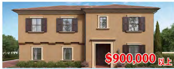
東木村-馬林區1Y號戶型 3房3.5浴 室內2244尺