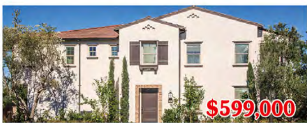
東木村-阿瓦隆區3號A、B戶型 2房2浴 室內1544尺