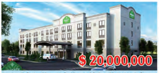
加州聖荷西硅谷溫德姆花園酒店 房間數量: 107個 房間價格: $186,916/間

我們代理世界知名酒店開發商, 已建酒店房間數88000房。酒店加上商業地產總值210億美元。所有酒店都在美國主要城市重要地點。所有酒店開發團隊負責貸款80%。投資人只要投資20%即可。可交房能力: 每年20個4-5星酒店, 歡迎開發, 合作, 或純投資。可做成自己的EB5項目。請聯繫美國地產蘇家敏, 626-677-6488。