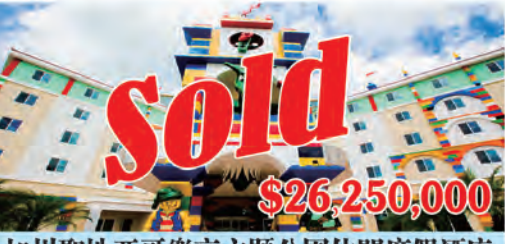
加州聖地亞哥樂高主題公園休閑度假酒店 房間數量: 125個 房間價格: $210,000/間