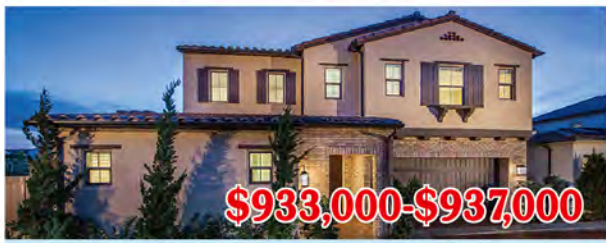
東木村-馬林區2號戶型 4房3浴 室內2155尺