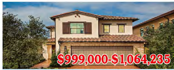
東木村-皮埃蒙特區1號戶型 4房3浴 室內2,165-2,207尺