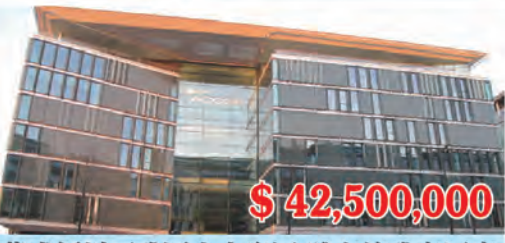
華盛頓州西雅圖水上樂園/體育館雅高酒店 房間數量: 160個 房間價格: $265,625/間