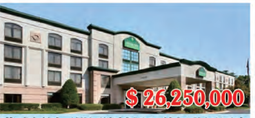
華盛頓州西雅圖國際機場溫德姆花園酒店 房間數量: 128個 房間價格: $205,078/間