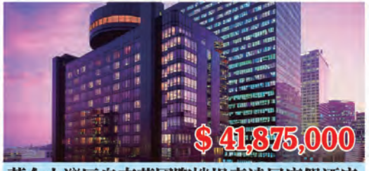
舊金山灣區奧克蘭國際機場喜達屋度假酒店 房間數量: 155個 房間價格: $270,161/間