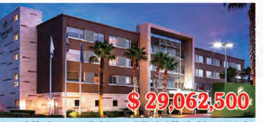
加州舊金山國際機場威斯汀苑宿精品酒店 房間數量: 135個 房間價格: $215,278/間