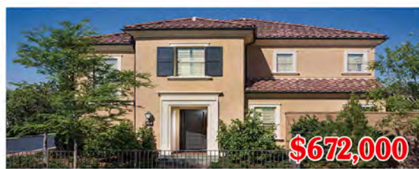
東木村-海倫娜區2號戶型 3房2.5浴 室內1632尺