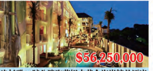
洛杉磯66號公路聖莫妮卡黃金海岸精品酒店 房間數量: 130個 房間價格: $432,692/間