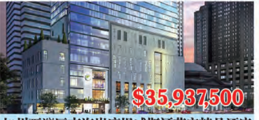
加州爾灣區南海岸廣場威斯汀苑宿精品酒店 房間數量: 125個 房間價格: $287,500/間