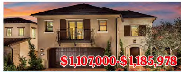
東木村-皮埃蒙特區2號戶型 4房4浴 室內2500尺