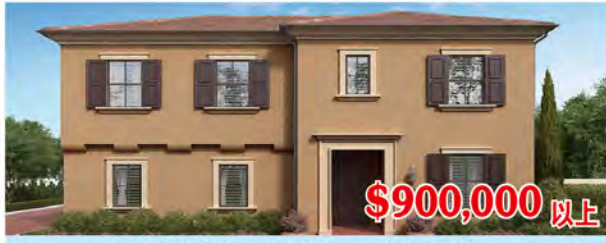
東木村-馬林區1Y號戶型 3房3.5浴 室內2244尺