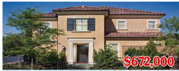
東木村-海倫娜區2號戶型 3房2.5浴 室內1632尺