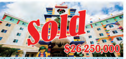
加州聖地亞哥樂高主題公園休閑度假酒店 房間數量: 125個 房間價格: $210,000/間