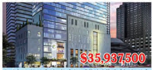
加州爾灣區南海岸廣場威斯汀苑宿精品酒店 房間數量: 125個 房間價格: $287,500/間