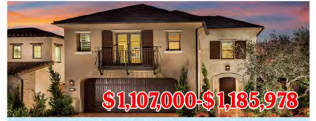
東木村-皮埃蒙特區2號戶型 4房4浴 室內2500尺