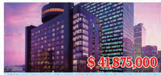
舊金山灣區奧克蘭國際機場喜達屋度假酒店 房間數量: 155個 房間價格: $270,161/間