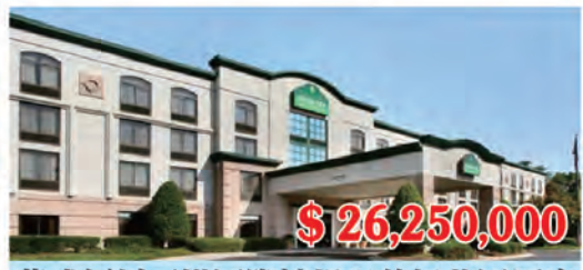
華盛頓州西雅圖國際機場溫德姆花園酒店 房間數量: 128個 房間價格: $205,078/間