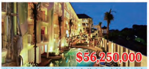
洛杉磯66號公路聖莫妮卡黃金海岸精品酒店 房間數量: 130個 房間價格: $432,692/間