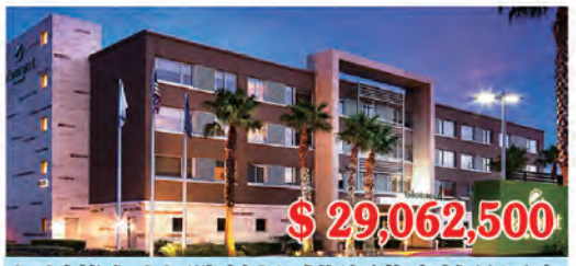
加州舊金山國際機場威斯汀苑宿精品酒店 房間數量: 135個 房間價格: $215,278/間