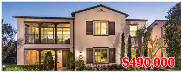
東木村-阿瓦隆區1號A、B戶型 2房2浴 室內1161尺