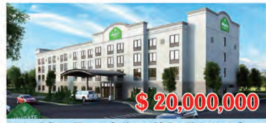
加州聖荷西硅谷溫德姆花園酒店 房間數量: 107個 房間價格: $186,916/間

我們代理世界知名酒店開發商, 已建酒店房間數88000房。酒店加上商業地產總值210億美元。所有酒店都在美國主要城市重要地點。所有酒店開發團隊負責貸款80%。投資人只要投資20%即可。可交房能力: 每年20個4-5星酒店, 歡迎開發, 合作, 或純投資。可做成自己的EB5項目。請聯繫美國地產蘇家敏, 626-677-6488。