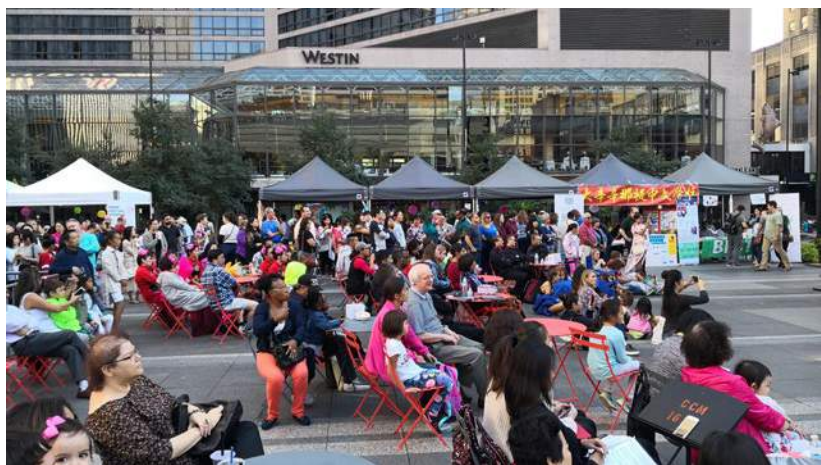
辛辛那提市民觀看中國文化節目

【本報訊】9月29日，辛辛那提首次以中秋為主題在市中心噴泉廣場隆重舉行中國文化活動，當地近6000民眾參與。中心舞台上，由大辛城華人華僑表演的中國民樂、歌舞、武術、合唱等精彩節目閃亮登場。廣場展位上的冰皮月餅、中華小吃供不應求。辛城市民踴躍參與中國書法、剪紙、描臉譜、畫風箏等豐富的文化體驗。辛城所在的漢密爾頓郡郡長波瓊親臨現場助陣。辛辛那提市長克蘭利出席當晚的晚餐會。中國駐紐約總領事趙宇敏來到現場，他感謝辛城乃至整個俄亥俄州人民對中國和中國文化表達的熱情，感謝俄州成為美國第一個與中國有關省份建立友好省州關係的先鋒。他說，中秋對中國人意味著團圓，也意味著明月之下，不分國別、種族，家家均享幸福。希望美國朋友從中國文化中體會和平、和諧、友好的精髓，選擇同中國攜手合作。