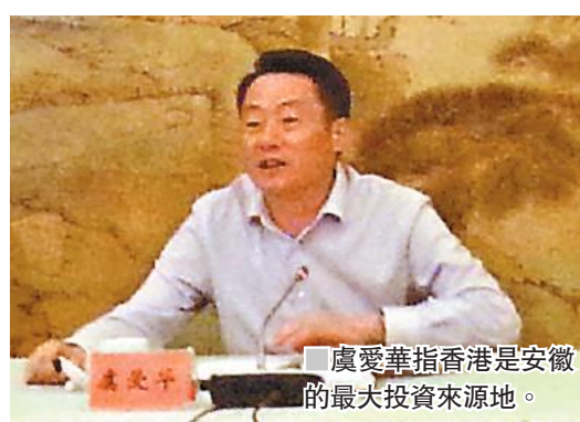
虞愛華指香港是安徽的最大投資來源地。

香港新聞界安徽採訪團於9月11日至9月16日前往安徽考察。9月11日晚上，安徽省常委、宣傳部長虞愛華主持了媒體見面會。虞愛華於會上表示香港是安徽省的最大投資來源地，中華煤氣、信義集團與香港華潤等港企均有在安徽省投資。