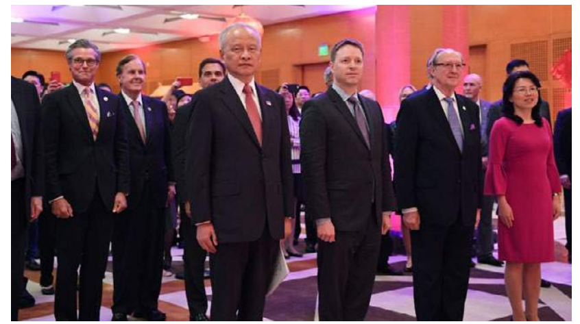
9月27日晚，中國駐美國大使崔天凱在使館舉行招待會，隆重慶祝中華人民共和國成立69周年。

系，崔大使說，人民賦予政府權力，政府要對人民負責，對中國政府來說，最首要和最重要的是要對人民負責。我們始終認為，確保人民能夠擁有更美好的生活是政府的核心任務。人民享有追求美好生活的權力，這種權力不是政府授予的，但政府的責任是確保人們有能力享受這種權力。