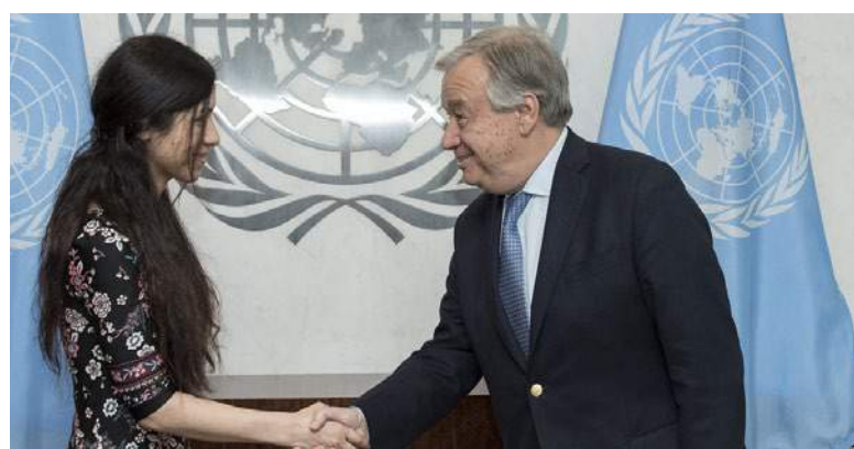
古特雷斯秘書長在2017年3月會見了維護人口販運幸存者尊嚴親善大使納迪亞·穆拉德

古特雷斯說：“十年前，安理會一致譴責將性暴力用作一種戰爭武器。今天，諾貝爾委員會承認納迪亞·穆拉德和丹尼斯·穆韋格醫生作為和平的重要工具所做的努力。通過表彰這兩位人類尊嚴的捍衛者，這一獎項同時也是在承認世界上無數的受害者，她們經常受到侮辱，被排除在人們的視線之外，並遭到遺忘——這