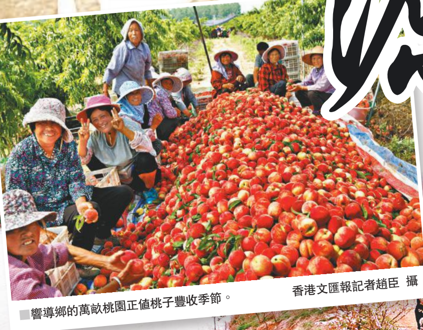
響導鄉的萬畝桃園正值桃子豐收季節。

鄉村創業者、基層官員等的心聲，講述他們在鄉村發展中的探索、感受和期望。今日的鄉土將承載着中國的未來。香港文匯報記者日前走訪安徽省安徽省的代表性鄉村，聆聽農民、編者按：隨着中國幾十年來工業和城市化快速推進，廣大農村遭遇產業落後、村莊「空心化」