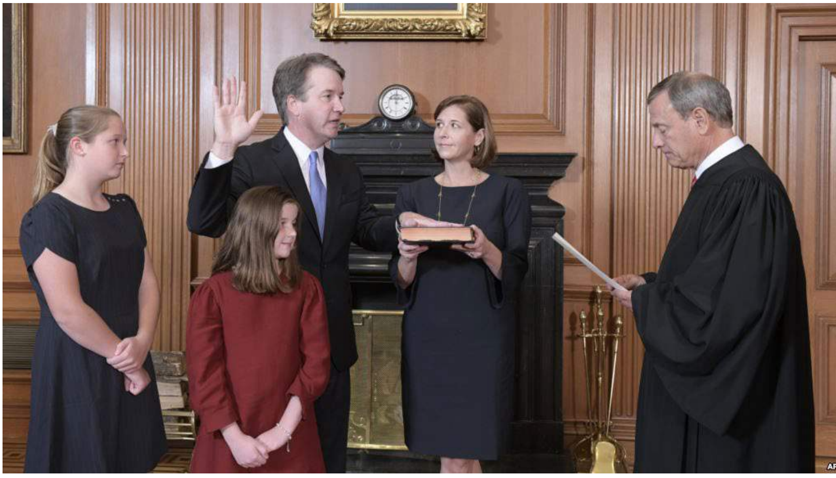
美國最高法院首席大法官約翰·羅伯茨在最高法院帶領卡瓦諾宣誓就任大法官。阿什利·卡瓦諾捧著聖經，他們的女兒在場。

由於最高法院大法官安東尼·甘迺迪退休，美國總統特朗普在2018年7月9日提名卡瓦諾為大法官之候選人。在確認過程中，克萊斯汀·福特聲稱在20世紀80年代初，兩人都是高中生時，卡瓦諾性侵犯了她。卡瓦諾明確並堅決地否認此事。在接下來的幾天裏，另有兩名女性指控卡瓦諾的性行為不端問題。卡瓦諾堅決否認所有指控，稱這些說法是民主黨、克林頓夫婦和左翼團體因在2016年選舉中敗選而進行的“政治報復”。