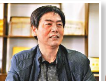
樂敬東 香港文匯報記者趙臣 攝

他還補充道，現在物流配送等服務業在農村就非常前景。因此，在發展鄉村產業過程中，需通過一二三產業融合發展，推出一批新產業、新業態和新模式。他舉例說，在安徽，不少鄉鎮推出垂釣、採摘等鄉村休閒旅遊項目，農業教育等研學遊項目也開始發展起來，這些都是鄉村農業產業的延伸。