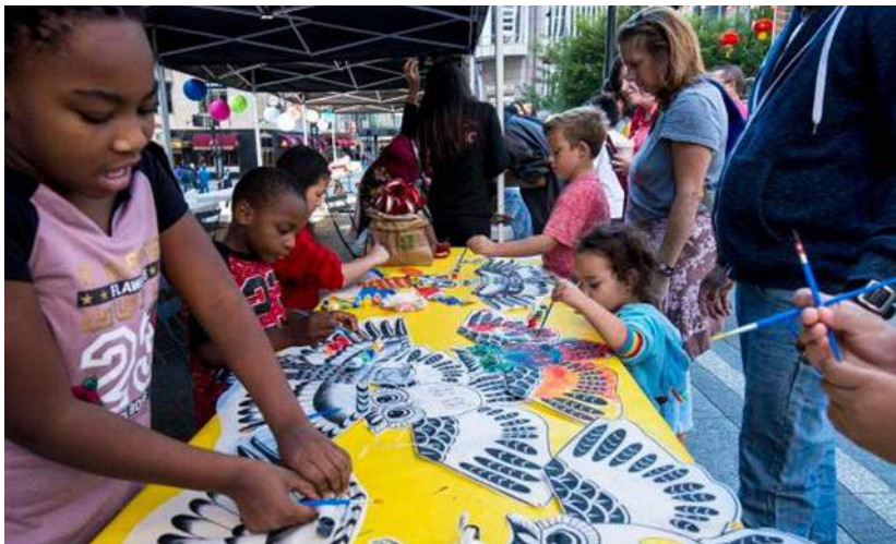
美國小朋友爭相描畫風箏