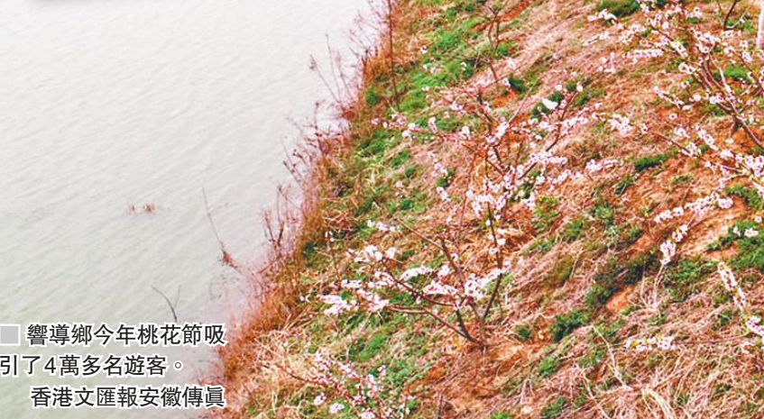
響導鄉今年桃花節吸引了4萬多名遊客。 香港文匯報安徽傳真