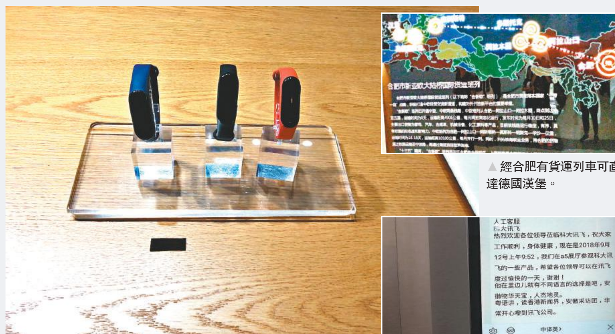
▲經過多年的努力，安徽創科發展非常迅速。圖為華米科技有份研發的小米手環3。

採訪團考察了位於合肥的聯想集團全球最大的PC研發和製造基地——聯寶科技。聯寶科技於2011年成立，由聯想集團和台灣仁寶集團共同成立，其研發中心聚集了逾1,000名高科技人才，形成「合肥+台北」的「雙引擎驅動」模式，藉以加強研發與創新的能力。