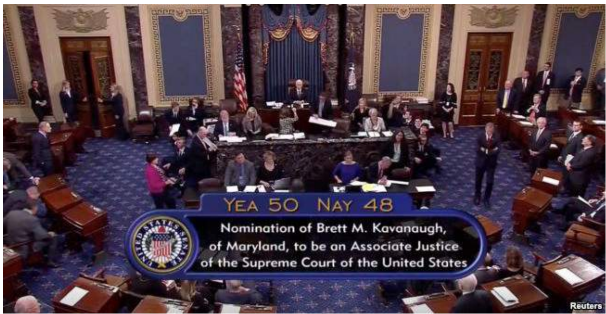
視頻截圖顯示美國國會參議院10月6日以50比48票確認布雷特·卡瓦諾出任美國最高法院大法官。

療了成千上萬名強奸受害者，這已經數次入圍諾貝爾和平獎候選者名單，並榮獲了許多聲望很高的獎項，包括2008年的聯合國人權獎和2014年的薩哈羅夫思想自由獎。秘書長古特雷斯贊揚穆韋格醫生一直是那些在武裝沖突中遭受強奸、剝削和其他可怕的虐待行為的婦女無所畏懼的支持者。供稿：聯合國新聞中心