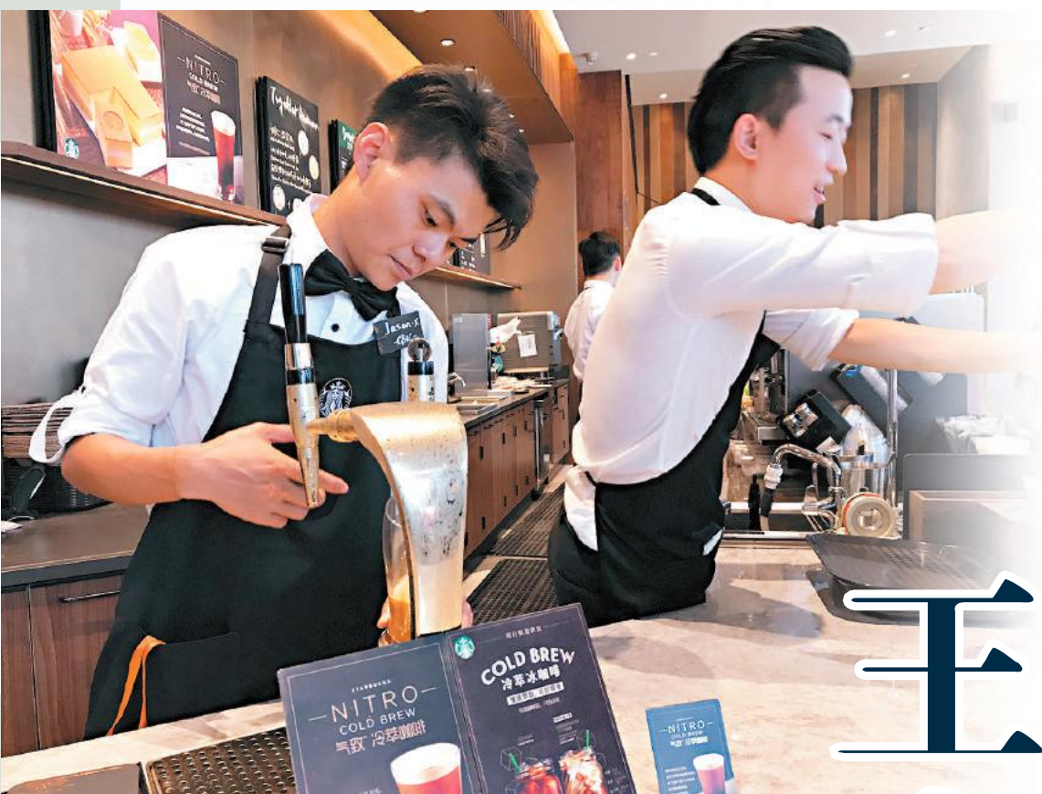
中國湧現一批以互聯網起家的咖啡品牌，其迅猛的發展已達到令星巴克擔心的地步。圖為星巴克實體店店員。