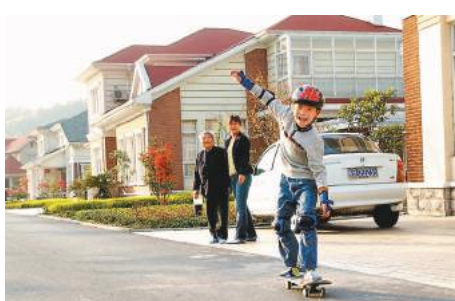
■ 住別墅、開名車，是華西村民的日常生活。

務功能。我們華西的孩子出去上大學後，包括海外留學的，99%都會回來。不僅因為城裡有的村裡都有，更重要的是，村裡有他們施展才華的平台。」