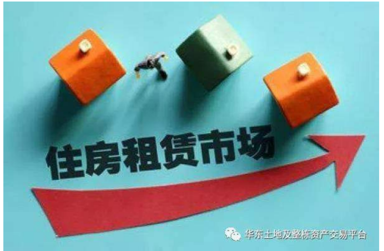
華東土地及整棟資產交易平台

發行規模總計618.8億元。長租公寓租賃市場資產證券化步伐也明顯加快，以租金收入或物業所有權爲底層資產的資產證券化產品已發行數十單，金融創新產品層出不窮。