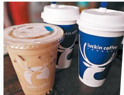
瑞幸咖啡新晉成行業第二位。

目前，在瑞幸實際購買一杯咖啡費用為10.5元至13.5元（人民幣，下同）之間，輕食費用在6.5元至12.5元之間，這些價格基本上僅為星巴克售價的30%左右。另據高