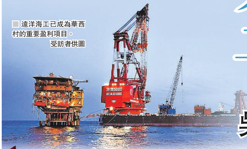
■ 遠洋海工已成為華西村的重要盈利項目。