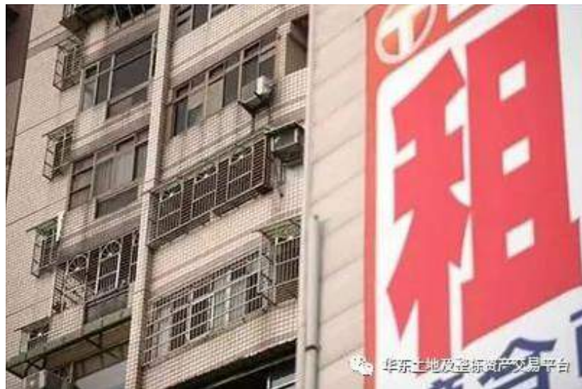
華東土地及整棟資產交易平台