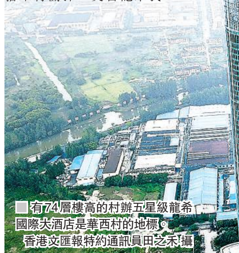
■ 有74層樓高的村辦五星級龍希國際大酒店是華西村的地標。

吳蘊芳指着掛在牆上的環保「綠色示範企業」的牌子自豪地表示，華西村的企業在當地已經成為環保標杆。