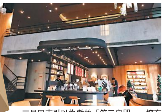
星巴克引以為傲的「第三空間」，擁有舒適寬敞的門店。