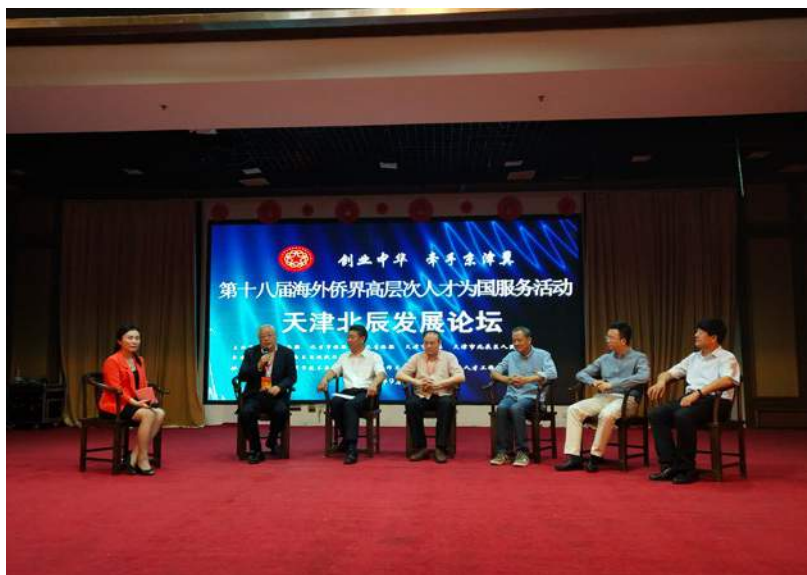
天津北辰發展論壇 天津市僑聯常務副主席陳鐘林主持(左)