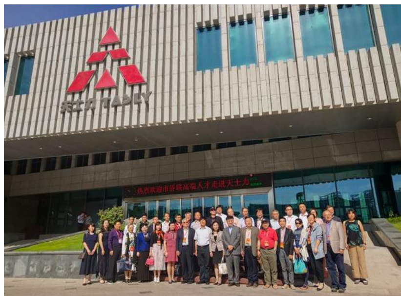
參觀天士力醫藥集團股份有限公司

感,去年是了解,今年大家可以更為貼近的講話。對於現在的書記和領導,夏團長認為都具有科學觀的思維,這個非常重要,特別是對海外工作,僑界的朋友希望與更為民主、更為務實和更為睿智的領導進行交流和做事,這樣可以更好地推進雙向的互動,而不是簡單的請你過來說說好話,這樣對推動北辰的經濟和發展大有益處。感謝天津市僑聯還將安排為國服務團成員參觀天士力集團等活動,這將引發更多的交流,相信北辰地區在天津市發展中所扮演的角色及在天津的發展和京津冀協同發展的功能等會有更多的對接。