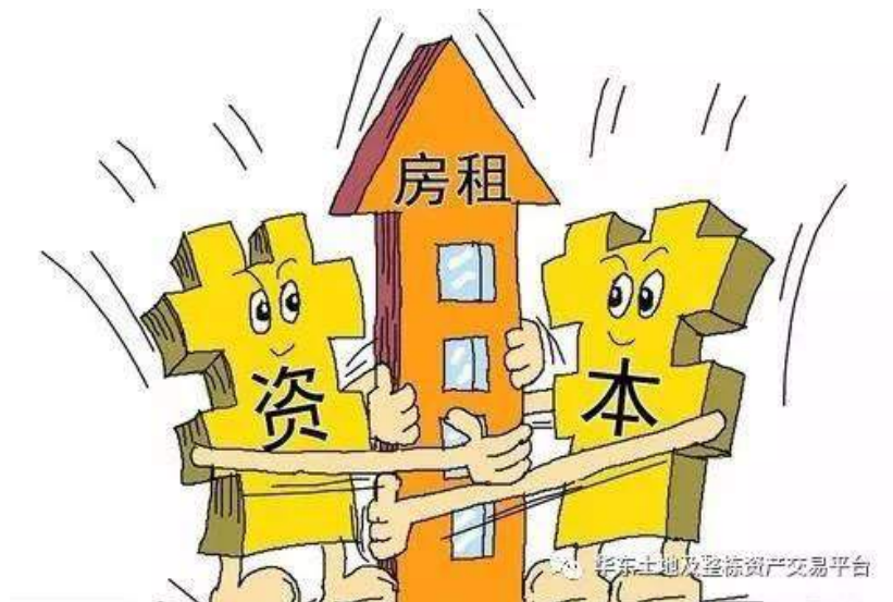
華東土地及整棟資產交易平台