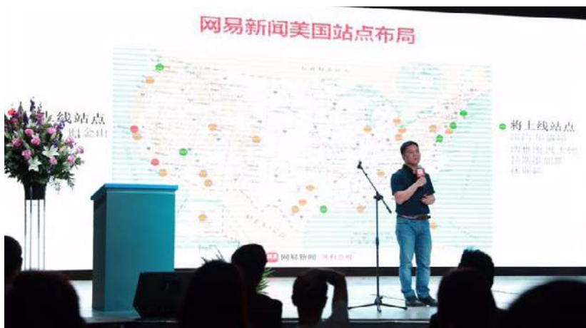
網易新聞美國站點布局