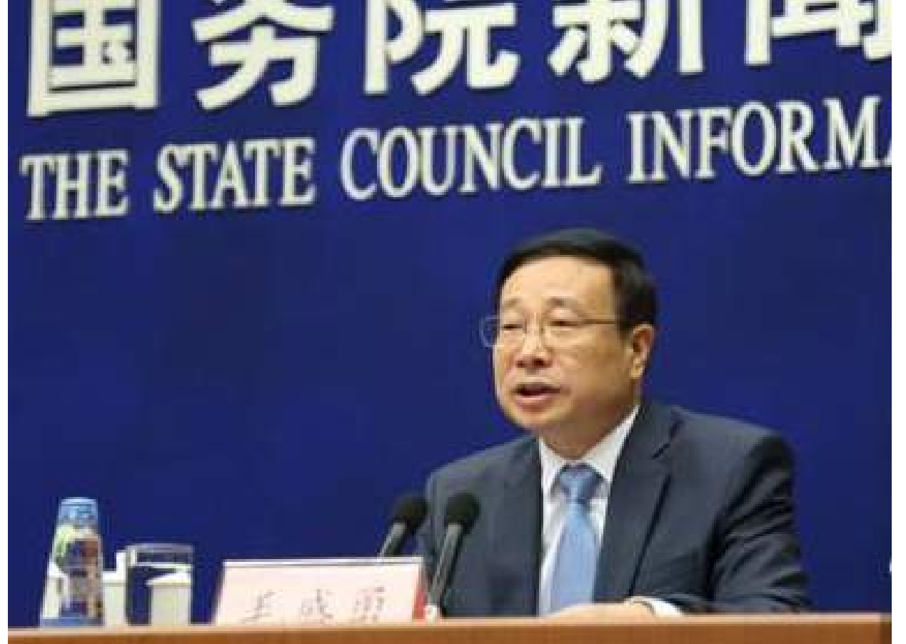
7月16日，國新辦舉行2018年上半年國民經濟運行情況發布會。國家統計局新聞發言人毛盛勇回答記者提問。