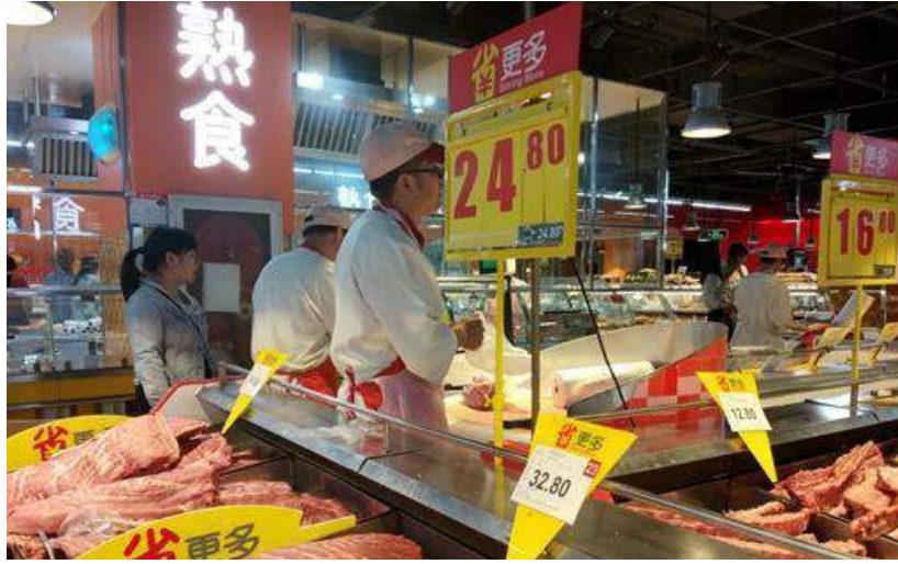
超市裏正在售賣的豬肉。中新網記者 李金磊 攝