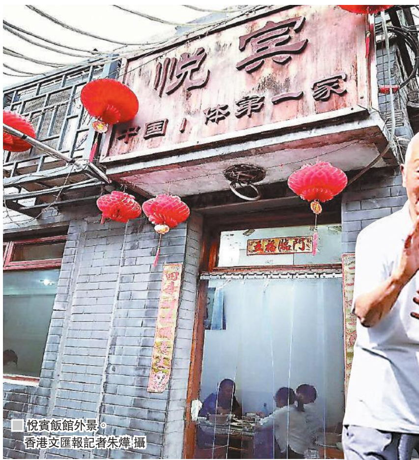
悅賓飯館外景。香港文匯報記者朱燦攝