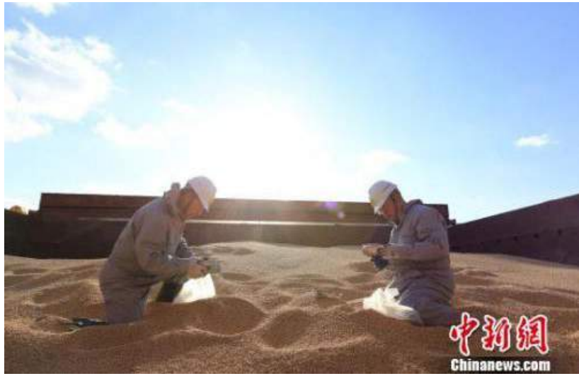
資料圖：遼寧大窯灣檢驗檢疫局工作人員對進口大豆進行查驗。

【中新社記者李金磊北京報道】在中美貿易摩擦的大背景下，中國今年物價是否大幅走高，是老百姓尤為關心的問題。