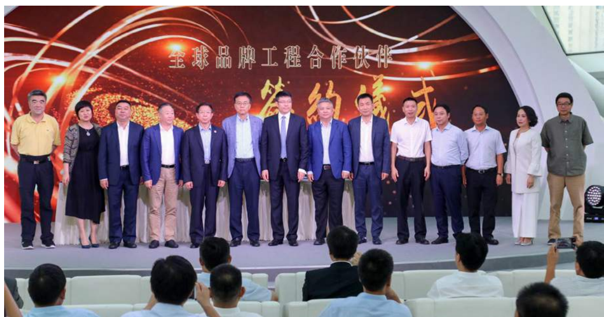
全球品牌工程之中國白酒文化高峰論壇在京舉辦

植根香港，服務全球華人，鳳凰衛視全球品牌工程是由鳳凰衛視發起，聯合商務部、發改委、外交部等政府機構，以及聯合國開發計劃署、聯合國教科文組織等國際機構，與全球權威媒體、專業品牌機構緊密結合，旨在實現中國企業品牌全球化的戰略聯盟，真正助力企業整合全球資源，拓展全球市場，成就世界品牌。