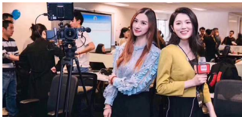
網易新聞美國站點布局

【本報綜合報導】美國西部時間2018年8月9日下午，網易新聞美國運營中心啟動儀式在洛杉磯正式舉行。中華人民共和國駐洛杉磯總領事館新聞參贊高飛代表總領事出席並致辭，南加州地區有關政要、中資企業高管、華人華僑社團領袖和美國商界人士百餘人參加並見證。