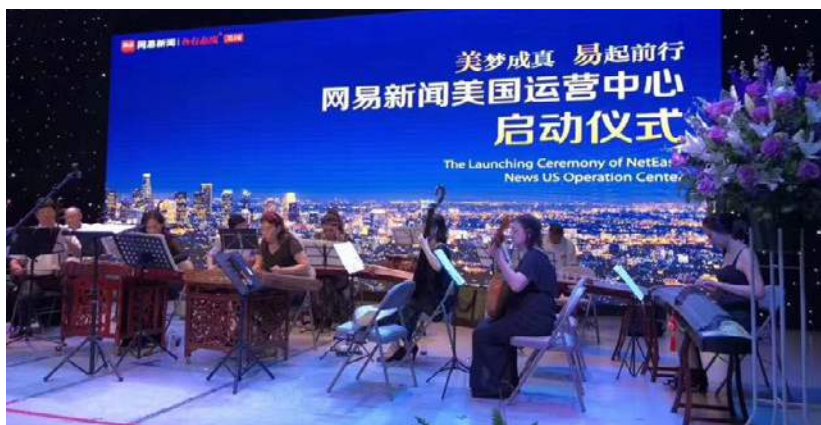
南加州中國國樂團進行民樂演出