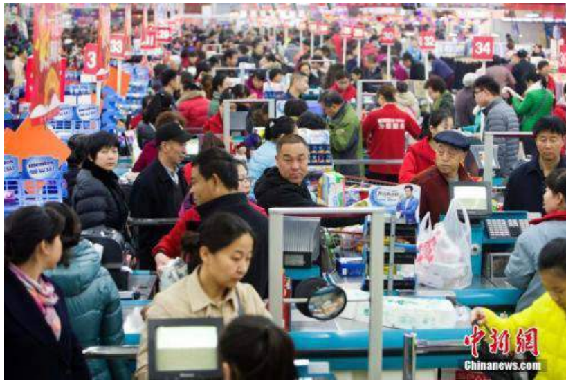
居民在超市裏購物。