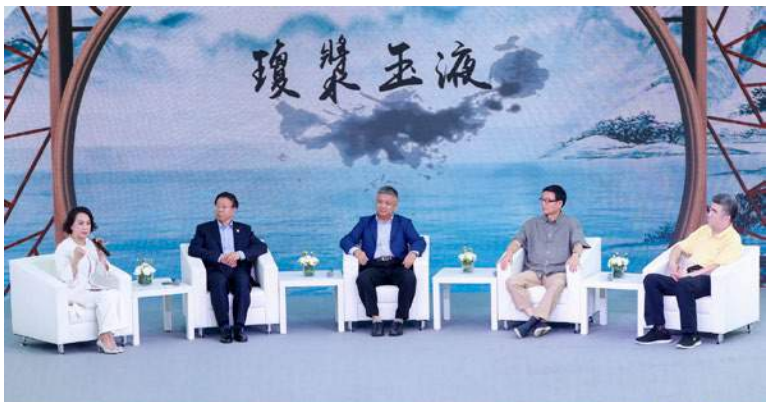
共同探討了中國白酒行業的發展現狀與品牌全球化之路

論壇對話，共同探討了中國白酒行業的發展現狀與品牌全球化之路。與會嘉賓一致認為，白酒企業應該借助鳳凰衛視的國際化平台，向世界講好中國白酒的文化故事，傳播好中國白酒企業的創新精神，提升中國白酒的品牌價值，合力打造中西方文化交流的“中國名片”。