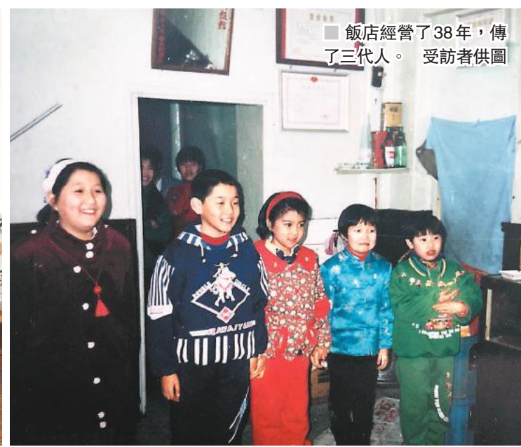
飯店經營了38年，傳了三代人。