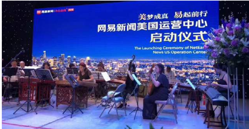
南加州中國國樂團進行民樂演出