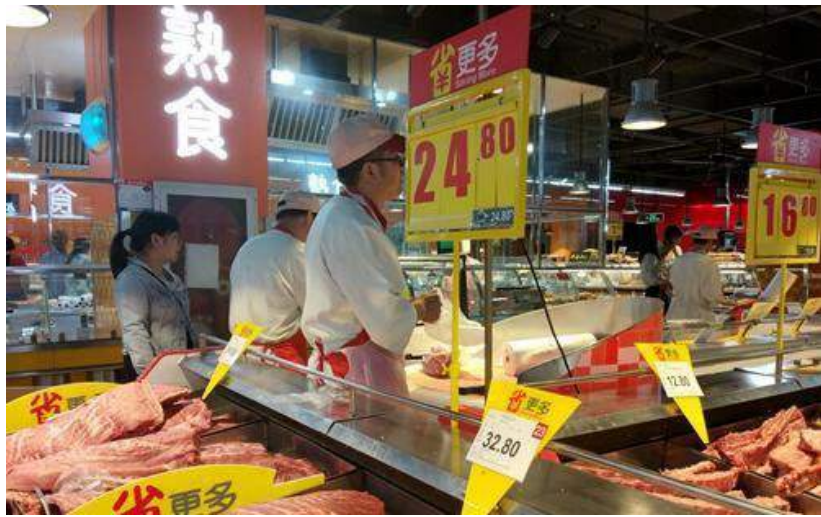
超市裏正在售賣的豬肉。