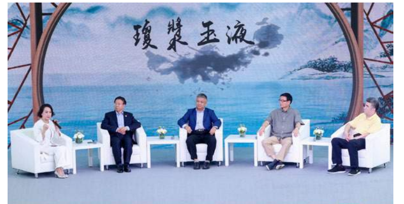
共同探討了中國白酒行業的發展現狀與品牌全球化之路

論壇對話，共同探討了中國白酒行業的發展現狀與品牌全球化之路。與會嘉賓一致認為，中國白酒企業應該借助鳳凰衛視的國際化平台，向世界講好中國白酒的文化故事，傳播好中國白酒企業的創新精神，提升中國白酒的品牌價值，合力打造中西方文化交流的“中國名片”。