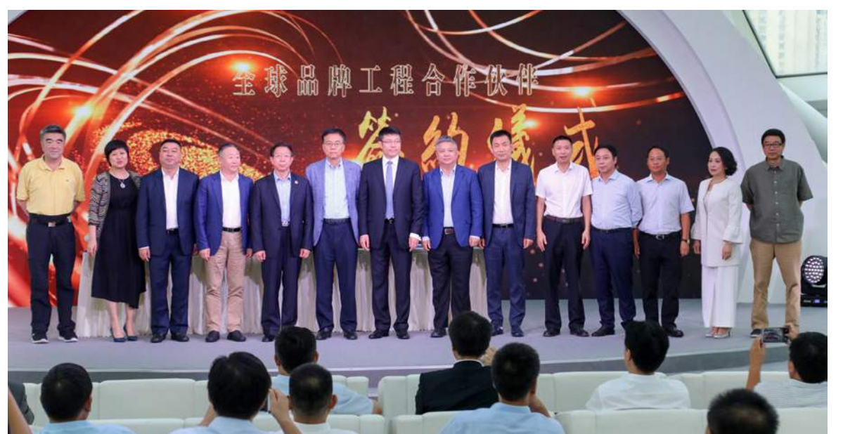
全球品牌工程之中國白酒文化高峰論壇在京舉辦