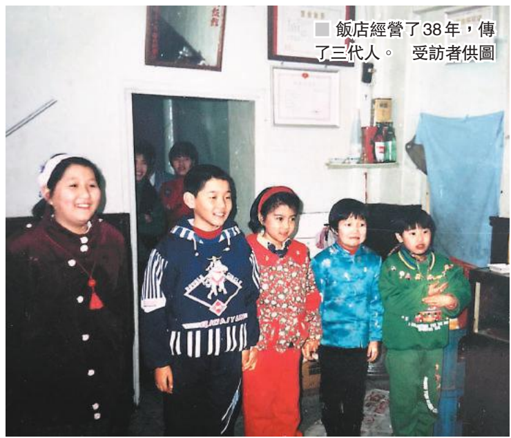
飯店經營了38年，傳了三代人。