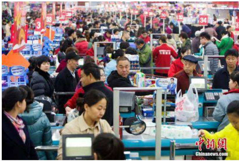
居民在超市裏購物。