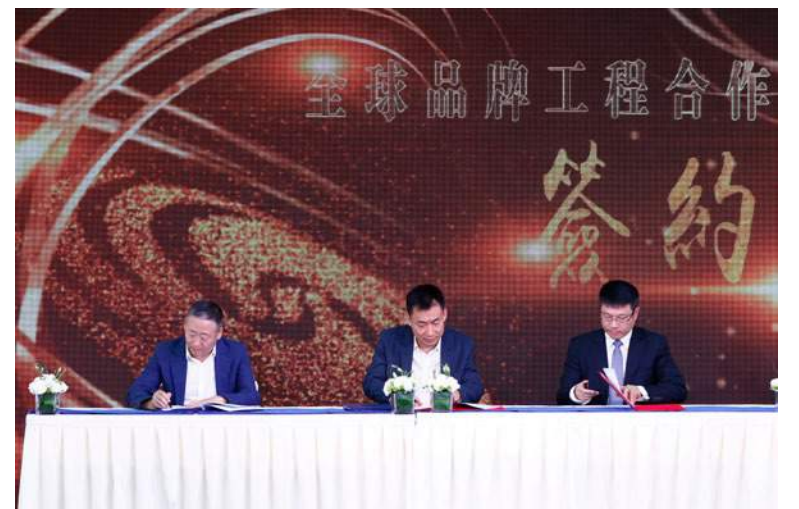
鳳凰衛視與益普索公司、中國酒業協會共同簽署戰略合作框架協議

在論壇環節，北京工商大學校長、中國工程院院院士孫寶國、《中國青年報》原總編輯陳小川、鳳凰衛視主持人、著名文化學者王魯湘、江南大學副校長徐巖參與