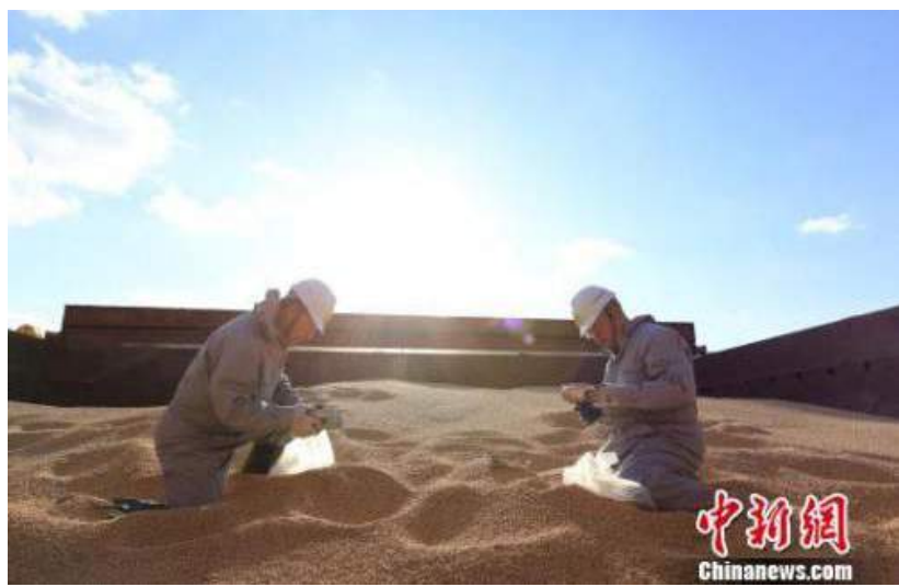
資料圖：遼寧大窯灣檢驗檢疫局工作人員對進口大豆進行查驗。

【中新社記者李金磊北京報道】在中美貿易摩擦的大背景下，中國今年物價是否大幅走高，是老百姓尤為關心的問題。