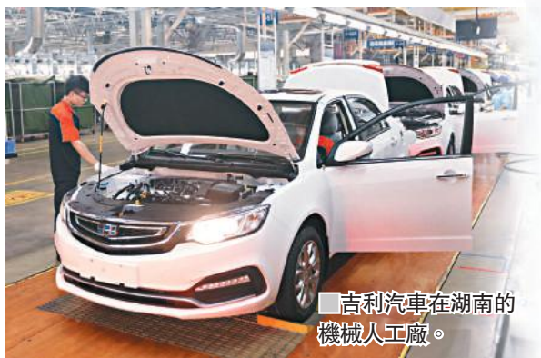
吉利汽車在湖南的機械人工廠。

企業轉型需時，成長更需時，同時需不少扶持。為了培育製造業發展新動能，長沙每年投入600萬元孵化資金，以「2025智造工場」為載體，孵化高成長企業。這些高成長企業也引來不少投資者注目，在第二屆中國(長沙)智能製造峰會已錄得24項重大簽約，計劃總投資額達410億元。