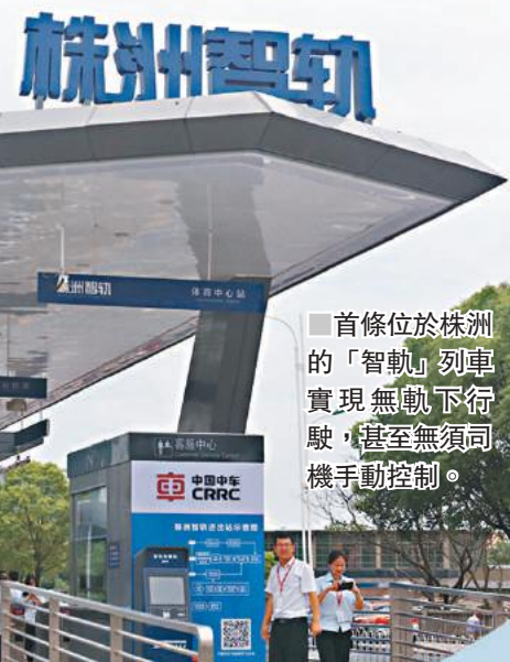
首條位於株州的「智軌」列車實現無軌下行駛，甚至無須司機手動控制。