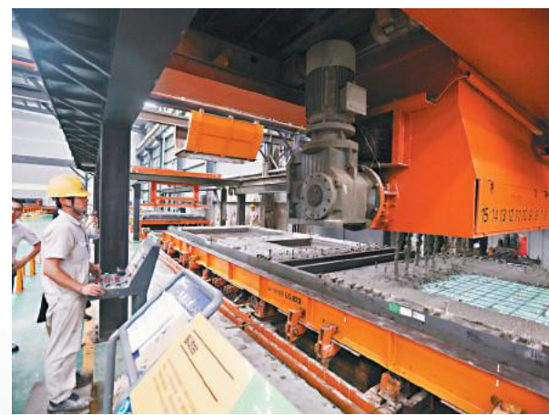
遠大住工的工人在製作混凝土構件。