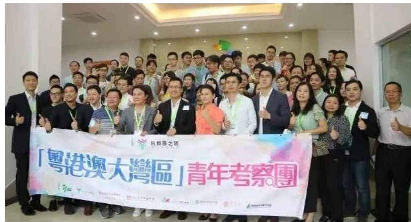
資料圖為：香港“共和國之旅青年築夢基金”考察團訪問江門