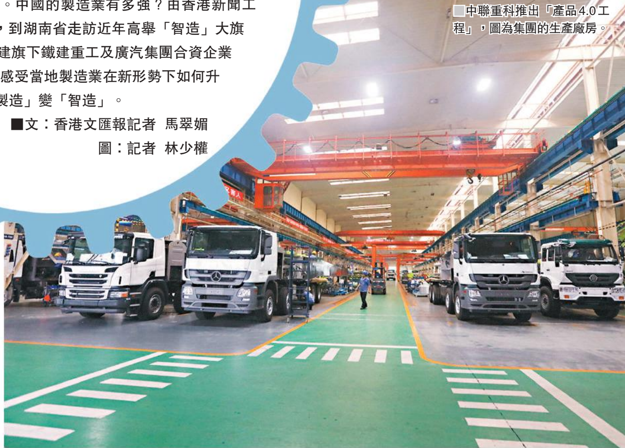
中聯重科推出「產品4.0工程」，圖為集團的生產廠房。