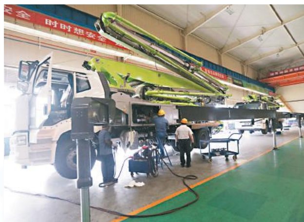
中聯重科麓谷工業園內，工作人員正在裝配重型車。