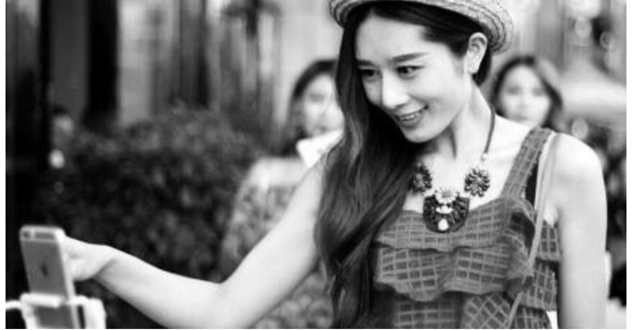
C 主播網紅到底能走多遠

對於一些年輕人、在校高中生、大學生當主播網紅，持反對意見的，主要是其父母，在受訪的 30 位 60 後、70 後中，有 24 人表示無法接受，認為這是不務正業，荒廢學業，占受訪對象的 80%；有 4 人表示理解，尊重孩子的選擇，約占 13%；2 人棄權，因為孩子只是觀看，並沒有影響學業擇業，約占 7%。