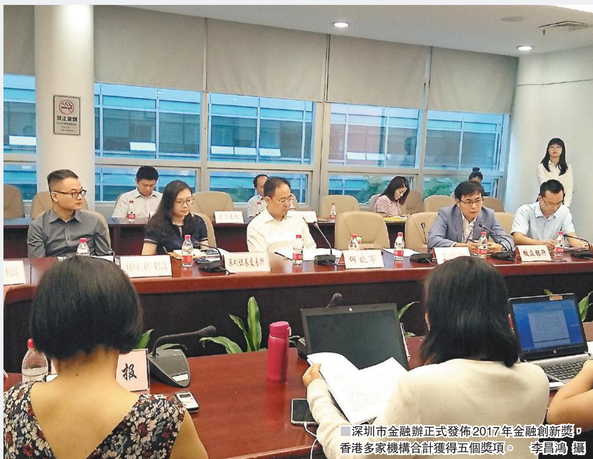
深圳市金融辦正式發佈2017年金融創新獎，香港多家機構合計獲得五個獎項。