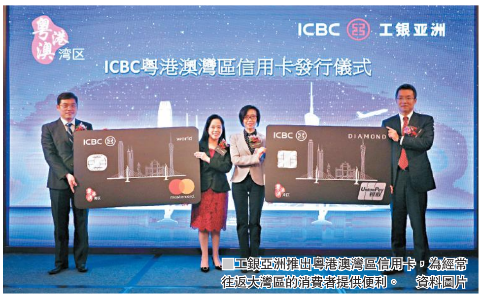
工銀亞洲推出粵港澳大灣區信用卡，為經常往返大灣區的消費者提供便利。 資料圖片

至於現時港人前往內地或澳門，往往需要轉換電話SIM卡，不少電訊商亦留意到有關需要，推出一卡兩號及數據優惠吸客，其中中國移動香港亦推出「飛常大灣區」服務計劃，提供內地、港、澳共享數據，而且提供無限限速數據用量，另備有大灣區儲值卡；3香港亦推出「Fun享·中港澳」，可以任用Whatsapp及微信等。