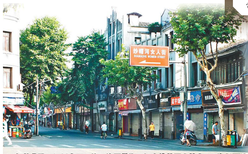
解放北路是溫州最早的一條商業街，如今依舊商店林立。