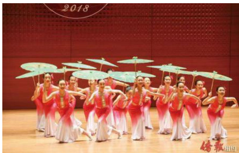
上海青少年活動中心手拉手藝術團表演《竹林漫漫》

【僑報記者管黎明紐約報導】由中國文聯、中國舞蹈家協會主辦的“春曉——‘小荷風采’二十周年精品劇目展演”活動繼不久前在北京天橋國際藝術中心大劇場成功舉辦後，部分展演劇目於25日來到紐約，在林肯中心杜麗廳(Alice Tully Hall)精彩上演。來自中國南北各地的小朋友們為紐約的觀眾帶來了一場充滿童趣卻又極具專業水準的藝術演出。