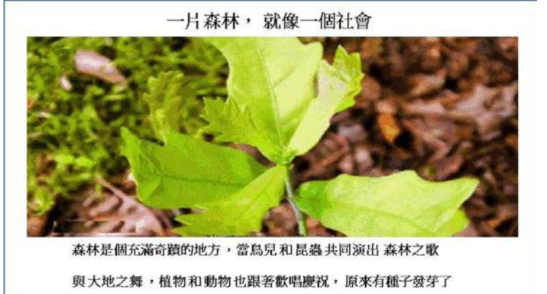
森林是個充滿奇蹟的地方，當鳥兒和昆蟲共同演出森林之歌，與大地共舞，植物和動物也跟著歡唱慶祝，原來有種子發芽了