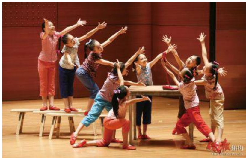
廣州兒童活動中心舞蹈《遠處的爸爸媽媽》