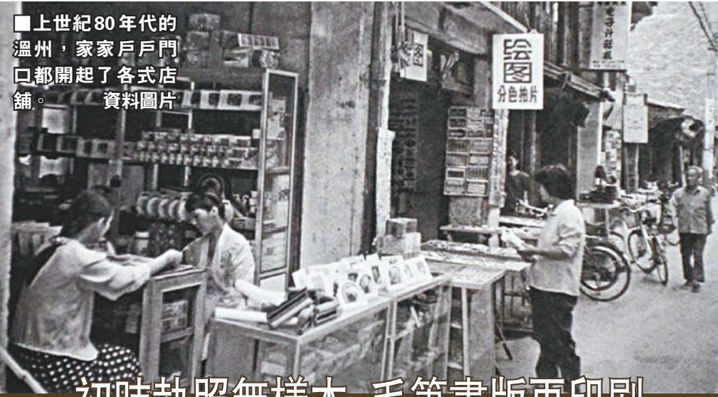
初時執照無樣本 毛筆畫版再印刷

她很感慨自己與鈕扣的緣分，她說：「也不知道為什麼，一直以來我就是喜歡做鈕扣生意，早些年身邊也有親戚朋友出去炒樓或者做別的買賣去了，可我就是喜歡守着我的鈕扣和這麼多年積累下來的客戶，雖然一包鈕扣可能只是賺了幾塊錢，但我覺得實在是挺心安的。」