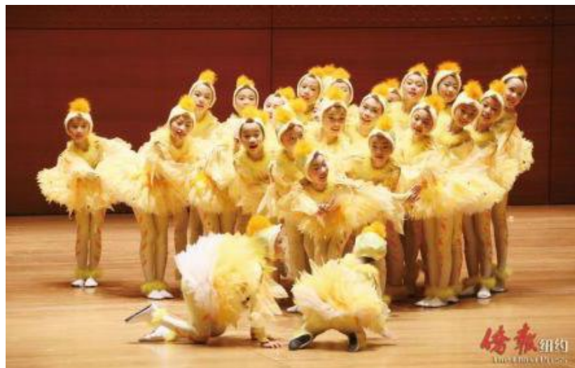
蘇州市吳韻少年藝術團《快樂的雞娃娃》