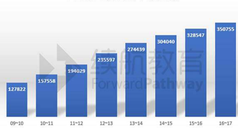
中国学生美国留学总人数