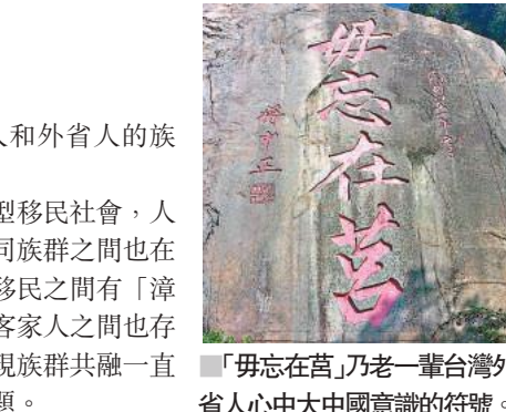
「毋忘在莒」乃老一輩台灣外省人心中大中國意識的符號。

士。自此，在台灣形成了本省人和外省人的族群概念。一直以來，台灣作為一個海島型移民社會，人口大體上呈現出流動性態勢，不同族群之間也在不斷磨合相處之道。早期的閩南移民之間有「漳泉械鬥」的族群衝突；閩南人和客家人之間也存在「閩客對立」。因而，如何實現族群共融一直是台灣社會發展中的一個重要課題。