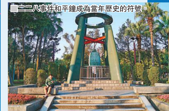
二二八事件和平鐘成為當年歷史的符號。

即便是作者事後強調自身的「台灣主體性」，但《不曾消失的台灣省》引起爭議這一現象本身便說明：部分持有強烈「本土」立場的本省人士認為支持國民黨的外省族群乃是過去的壓迫者；既然是壓迫者，有何資格發聲叫屈呢？