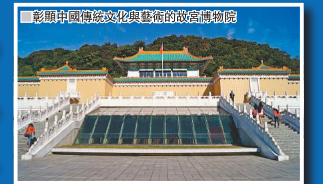
彰顯中國傳統文化與藝術的故宮博物院

長人事案的議題發酵之後，不少親綠的台灣學者和組織紛紛表示支持台灣教育部門阻止管中閔上任，理由也非常直接：要剷除大學校園中的保守派和舊勢力。因為省籍和意識形態原因，管中閔顯然成為了台灣版的德雷福斯 (Alfred