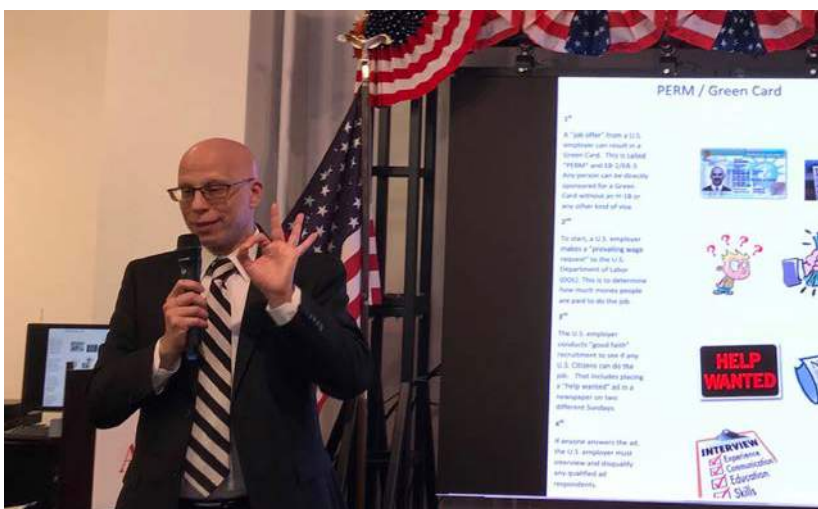
古奇律師為參會來賓進行主題沙龍講座