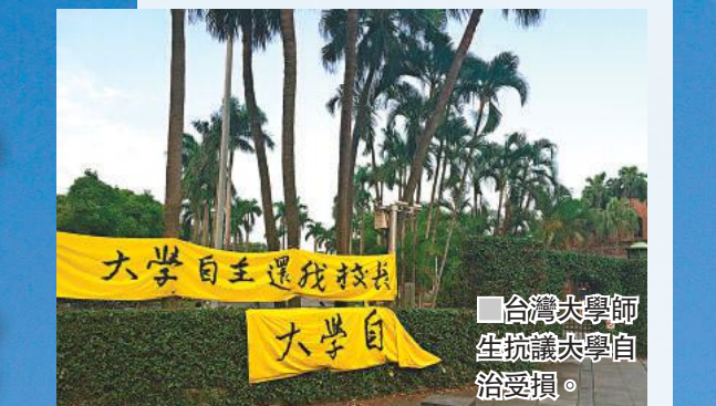
台灣大學師生抗議校務自治受損。

長人事案的議題發酵之後，不少親綠的台灣學者和組織紛紛表示支持台灣教育部門阻止管中閔上任，理由也非常直接：要剷除大學校園中的保守派和舊勢力。因為省籍和意識形態原因，管中閔顯然成為了台灣版的德雷福斯 (Alfred