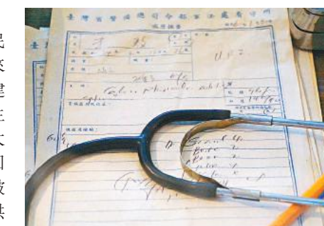
李敖被關入景美看守所時的體檢記錄。

就文化領域而言，由於蜚聲海內外的外省背景作家、藝術家數量眾多，這群人首先成為了被打倒和羞辱的對象。余光中是公認的漢語文學巨匠，但是其病逝至今都未獲得台灣官方的「褒揚令」。而刪減台灣中學課本中的文言文數量，在本質上成為了部分不知名的台灣本土作家「分贓」的模式：他們可以透過執政者讓自己的作品被選入教材。同時，也恰恰是這些所謂的台灣「本土」文人，他們寫不出優秀的作品、沒有普世的人文關懷、也打不出響亮的名氣，但卻肆意今天的台灣嘲弄外省作家的成就，背離文化人的人格價值。不久前，台灣將「戒嚴」時代的景美看守所正式變為人權博物館，以彰顯社