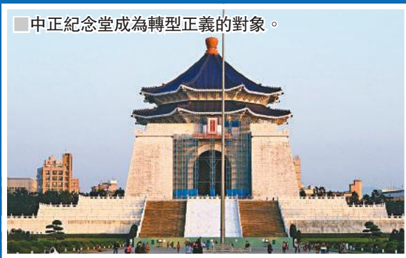
中正紀念堂成為轉型正義的對象。

即便是作者事後強調自身的「台灣主體性」，但《不曾消失的台灣省》引起爭議這一現象本身便說明：部分持有強烈「本土」立場的本省人士認為支持國民黨的外省族群乃是過去的壓迫者；既然是壓迫者，有何資格發聲叫屈呢？