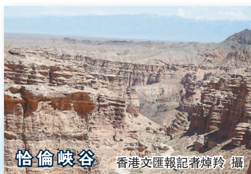
恰倫峽谷