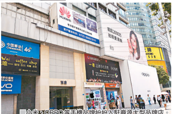
小米、OPPO等手機品牌紛紛入駐龐源大型品牌店。