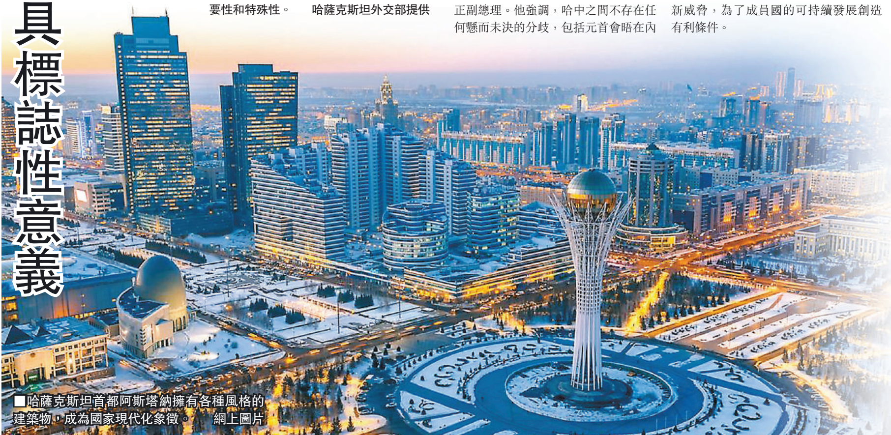
哈薩克斯坦首都阿斯塔納擁有各種風格的建築物，成為國家現代化象徵。網上圖片

阿富汗是上合組織以外最大的恐怖主義威脅來源。而各成員國協調一致，保證阿富汗的安全穩定至關重要。目前，上合組織「阿富汗問題聯絡小組」的作用不可或缺，它為實現阿富汗民族和解和安寧做出了自己的貢獻。