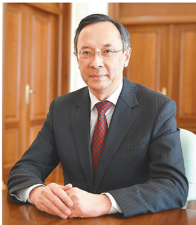
阿布拉赫曼諾夫表示，哈中關係具重要性和特殊性。

阿布拉赫曼諾夫外長首先說，納扎爾巴耶夫總統即將對中國展開國事訪問，充分說明哈中關係的重要性和特殊性，訪問必將給哈中全面戰略夥伴關係持續發展注入新的活力。