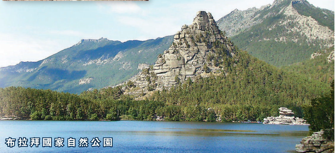
布拉拜國家自然公園