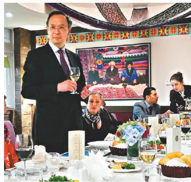
阿布拉赫曼諾夫與國際媒體交流。

阿布拉赫曼諾夫強調，青島峰會是一次具有標誌性意義的大事，上合成員國元首首次以「八國模式」聚集一堂，上合組織已成為國際社會公認的並享有盛譽的多邊國際組織，有效維護了歐亞地區的安全和穩定，攜手應對了各種挑戰和威脅，增強了各成員國間的經貿和人文合作水平，各國睦鄰友好和相互協作的潛力得以挖掘。峰會期間，元首們將討論國際社會所面臨的最緊迫日程，簽署規劃上合組織未來發展方向的《青島宣言》。他表示，哈國致力於加強上合組織在現代國際關係體系中的作用，主張嚴格遵守該組織通過的基礎性文件，恪守「互信、互利、平等、協商、尊重多樣文明、謀求共同發展」的「上海精神」。哈方願與各國一道，為保障本地區的安全穩定，應對各種新挑戰、新威脅，為了成員國的持續發展創造有利條件。