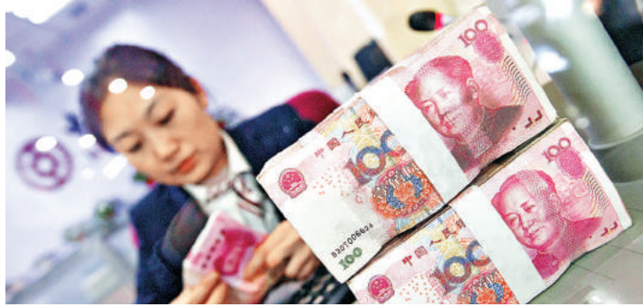
隨着人民幣逐漸回穩，國際對內地債市的憂慮已大大降低。

券違約兌付情況發生。Wind數據統計顯示，2017年是去槓桿為主旋律的一年，市場上因此出現49隻債券違約。