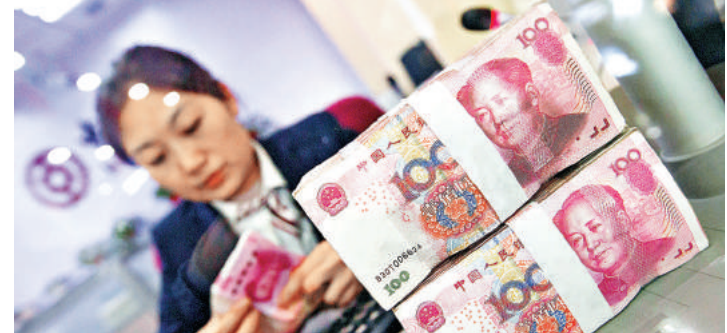
隨着人民幣逐漸回穩，國際對內地債市的憂慮已大大降低。

他稱中國債市對外開放已步入「快車道」，一旦納入國際核心債券指數，還可刺激追隨債券指數的基金配置需求大量湧入。