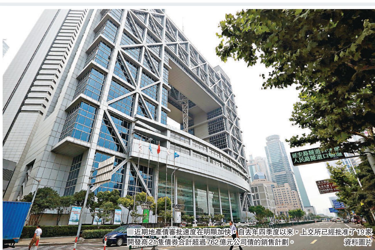
近期地產債審批速度在明顯加快，自去年四季度以來，上交所已經批准了19家開發商21隻債券合計超過762億元公司債的銷售計劃。

程實持相同觀點，他指出本輪債市調整自2016年3季度開始已維持了超過一年時間，市場對宏觀因素和強監管的預期部分已反映，因此，這些因素對債市的邊際影響在2018年或會有所減弱。總體上國債收益率再往上升的空間有限，預計10年期國債收益率或在3.6%至4.1%的區間波動。