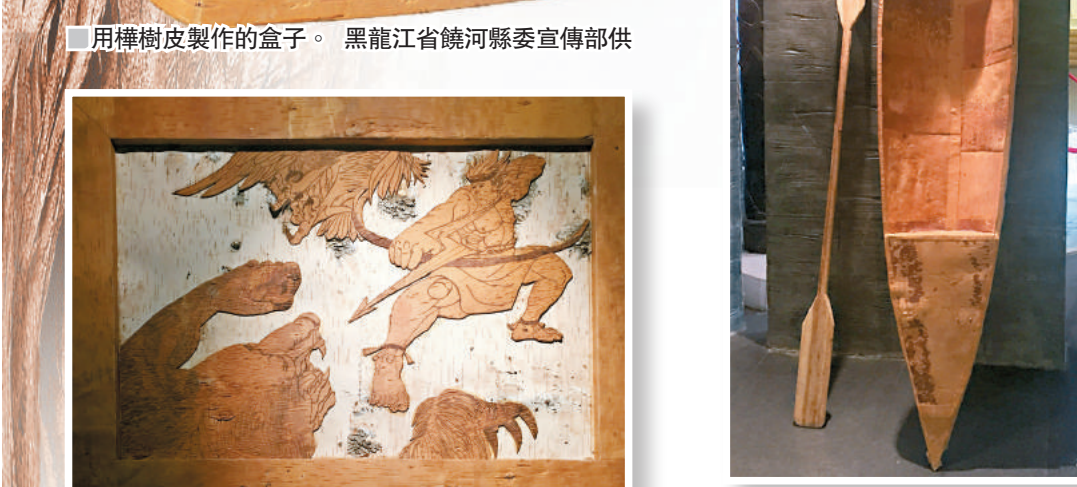
付占祥製作樺樹皮製品。黑龍江省饒河縣委宣傳部供 用樺樹皮製作的盒子。黑龍江省饒河縣委宣傳部供 樺樹皮畫 香港文匯報記者于海江 攝 樺樹皮船。香港文匯報記者于海江 攝