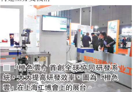
「橙色雲」首創全球協同研發系統，大大提高研發效率，圖為「橙色雲」在上海工博會上的展台。