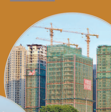
■ 房地產政策收緊政策風險很小。