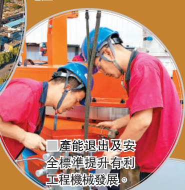
■ 產能退出及安全標準提升有利工程機械發展。