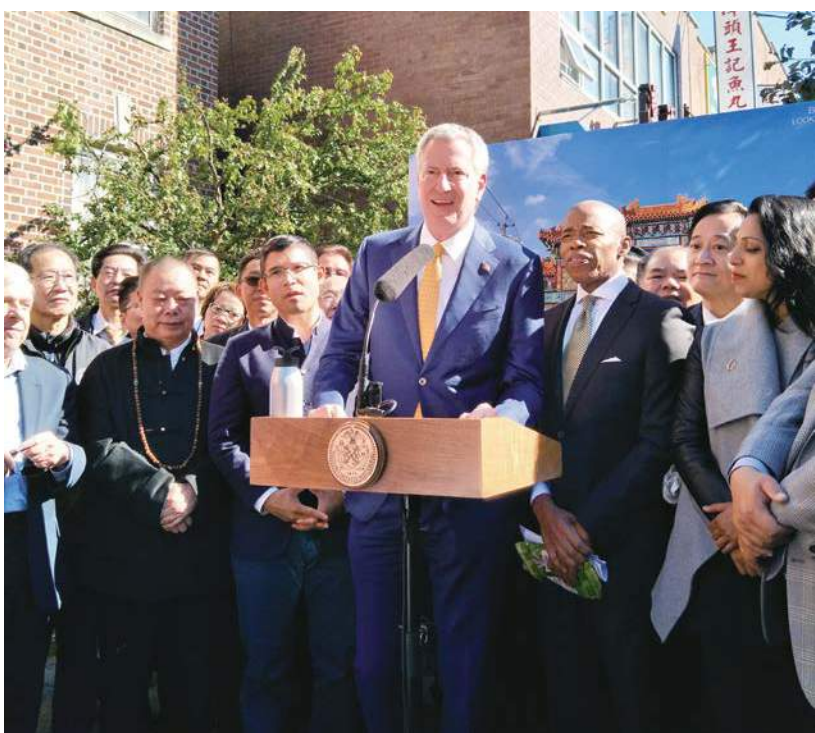
紐約市市長白思豪演講

【本報記者華晨、陳俊斌紐約報導】美東時間10月27日下午1時許，美國紐約市長白思豪和布魯克林區區長亞當斯在布魯克林區與第八大道交叉的60街區宣布，紐約第一座中華牌樓將興建在布魯克林日落公園，亦稱布魯克林華埠的八大道上。