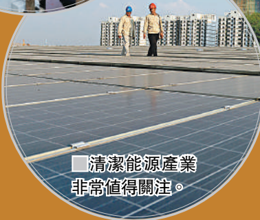
■ 清潔能源產業非常值得關注。

摩根大通： 報告沒有提及新的房地產收緊政策，亦無任何跡象表明政府對現行政策不滿。政府對現行政策所帶來的結果感到滿意，反映其進一步收緊政策的風險很小，因此依然看好房地產行業。