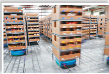
菜鳥網絡在廣東省惠陽區的智慧倉庫內,有上百台「機器人揀貨員」,單日發貨量可超過100萬件。

香港文匯報訊(記者 蔡競文)菜鳥網絡推出超級機器人旗艦倉以迎接2017年天貓「雙十一」,公司稱倉內逾100台機器人單日發貨量可超過100萬件,將為華南地區和香港的消費者提供優質物流服務,同時宣佈正在上海、天津、浙江、廣東及湖北等地上線機器人倉庫。