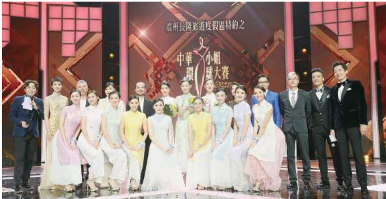
大合照（評委、12強、司儀）

作為最矚目的全球華人選美盛事，大賽宗旨為拉近全球華人距離，建立華人新生代美麗標準，推崇“美麗與智慧同行，內在與外在