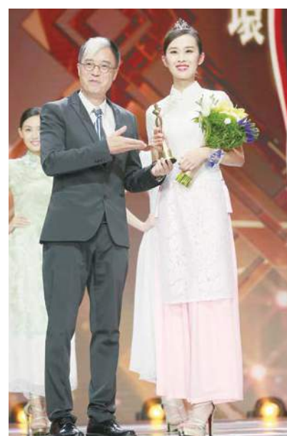
香港著名文化學者李純恩為季軍頒獎

兼修”，倡導“美麗與活力、勇敢與智慧、個性與愛心”的華人新女性形象的樹立，透過鳳凰衛視高端的推廣平台，吸引全世界人群的眼球。一直以來，中華小姐以突出的