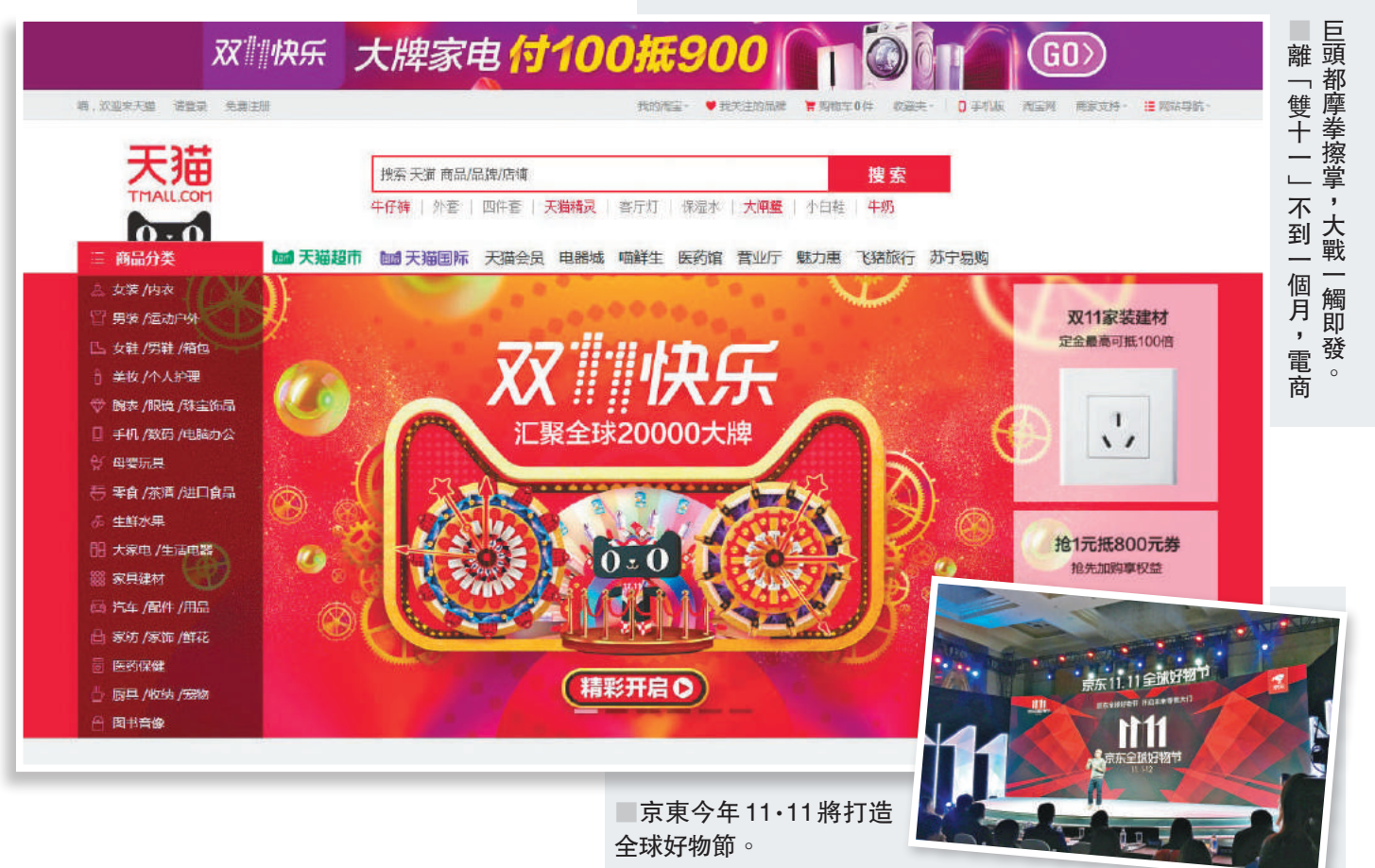
京東今年11·11將打造全球好物節。