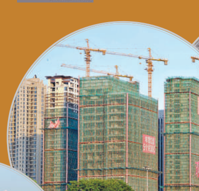
■ 房地產政策收緊政策風險很小。