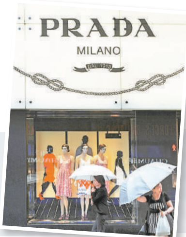
不少國際大牌如Prada等都在中國適當降價。

香港文匯報訊(記者 孔雯瓊 上海報道)目前,從中國電商備戰奢侈品的價格來看,的確很多價格已經和境外專櫃售價不相上下,以天貓「魅力惠」上一款黑色鹿皮酒神包報價來看,售價1.6萬元(人民幣,下同),已經非常接近國外專櫃同款式折合約1.5萬元的價格。