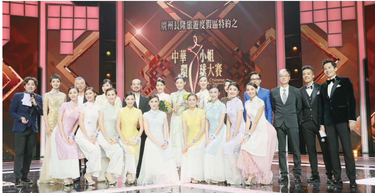
大合照 (評委、12 強、司儀)

作為最矚目的全球華人選美盛事，大賽宗旨為拉近全球華人距離，建立華人新生代美觀標準，推崇“美麗與智慧同行，內在與外在