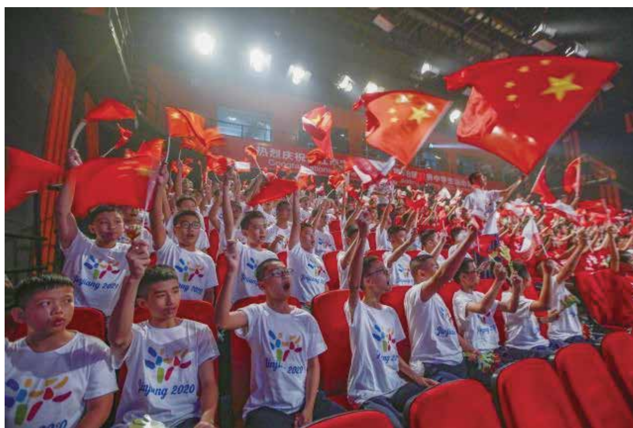
晉江全城爲之雀躍歡呼