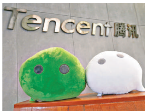
分析師認為科技股看高一線。

有研究指出，中國農業的生產率、成本高企，加上農村人口老齡化問題，都影響到內地農業的現代化發展。