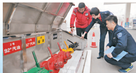
河北省邢台市環保局執法人員在橋西區一家加油站檢查油氣回收設施。資料圖片