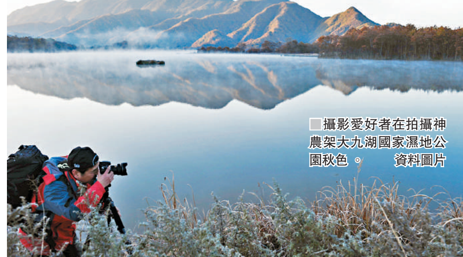
攝影愛好者在拍攝神農架大九湖國家濕地公園秋色。資料圖片