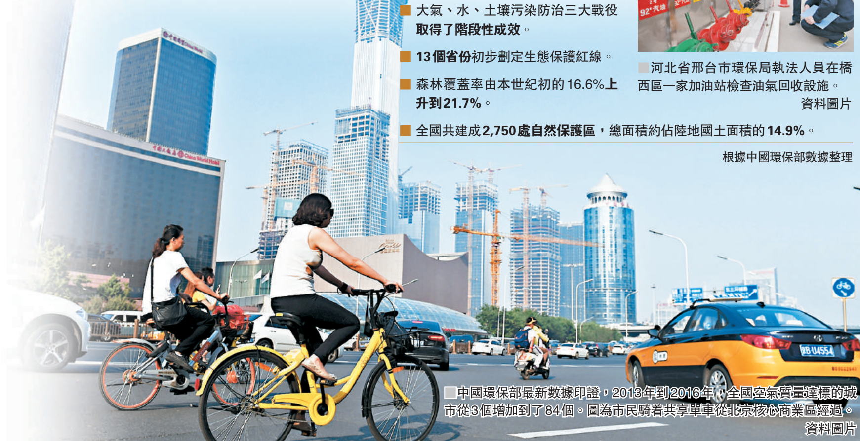
中國環保部最新數據印證，2013年到2016年，全國空氣質量達標的城市從3個增加到了84個。圖為市民騎着共享單車從北京核心商業區經過。資料圖片