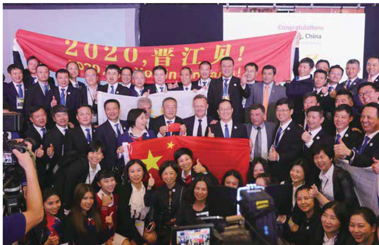
勝利屬於中國福建晉江