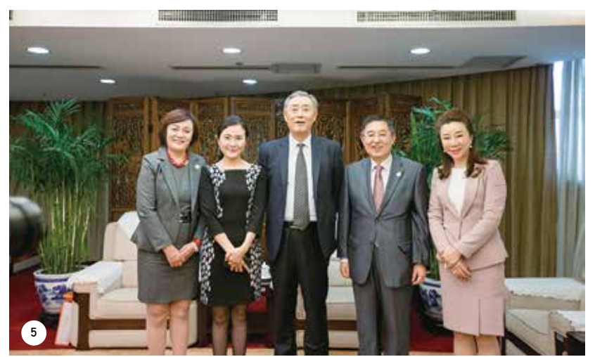
圖片說明： 1——鳳凰衛視採訪中國僑聯黨組書記、主席萬立駿 2——中國僑聯副主席喬衛、鳳凰衛視執行董事、常務副行政總裁、鳳凰新媒體董事長崔強等出席新聞發布會 3——中國僑聯副主席喬衛、鳳凰衛視中文臺副臺長劉點點，代表中國僑聯、鳳凰衛視簽約 4——中國僑聯黨組書記、主席萬立駿會見鳳凰衛視執行董事、常務副行政總裁、鳳凰新媒體董事長崔強先生和鳳凰衛視中文臺副臺長劉點點 5——中國僑聯、鳳凰衛視、山水文園集團、中國華僑公益基金會、僑聯之友領導合影