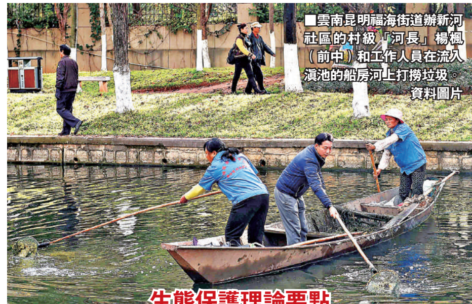
生態保護理論要點