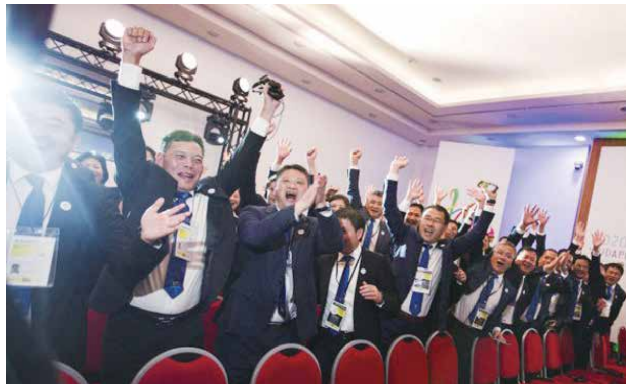
中國福建晉江代表團慶祝獲得舉辦權