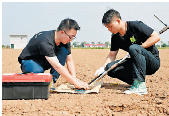
在陝西楊凌農業示範區，技術人員在進行土壤採樣，為政府和企業提供環境監測、土壤檢測與診斷等技術服務。

「但是中國整體環境形勢依然嚴峻，距離人民所要的優美環境還有距離。」這位專家指出，未來五年，三大環保戰役還需要進一步深化和加強，大氣污染治理初見成效，後邊將是難點諸多的攻堅戰，不能放緩。水和土壤污染中的有毒有害物質管控制體系建立要納入到議事日程；環境管理體制改革也要推進，未來幾年應該建立環保部門垂直管理機制，讓環境監管監測徹底擺脫地方干預；區域流域的協同治理需要進一步推進；環保部力推的環境保護稅，統一的企業環境信息平台建設、綠色經濟政策，綠色生產生活方式的推動都要大力實施。