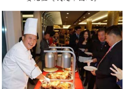
總領館為來賓準備的地道中國美食