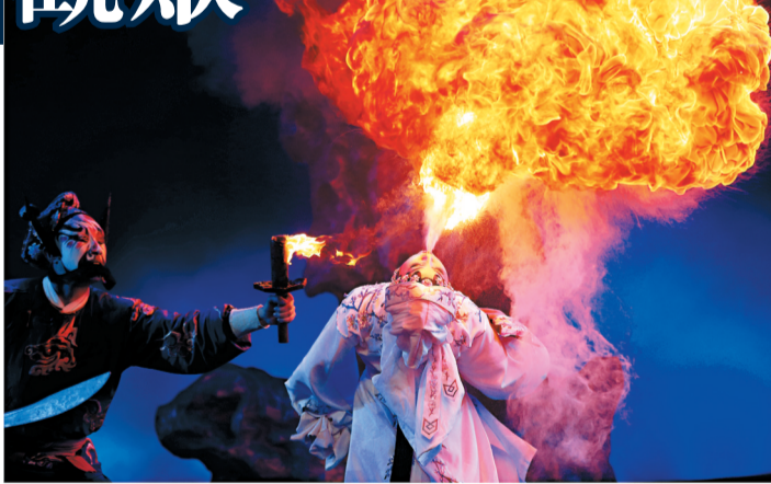
秦腔特技表演——吐火。

棗木棍子擊節伴奏，故又叫梆子腔，俗稱枕子，形成於秦，精進於漢，昌明於唐，完整於元，成熟於明，廣播於清，歷兩千多年歷史，堪稱中國戲曲的鼻祖。秦腔在古時陝、甘、寧一帶民間歌舞的基礎上逐漸發展形成，現流行於陝西、甘肅、青海、寧夏、青海、新疆等西北地區。唱腔上，外界一般認為秦腔一味靠「吼」，所謂「唱戲吼起來」被譽為關中十大怪之一。其實秦腔唱腔既慷慨激昂，亦纏綿悱惻。苦音抒發悲憤、淒涼情感，歡音表現歡快、喜悅情緒。表演上，秦腔誇張中不失樸實、豪邁中透出細膩，深刻而動人。