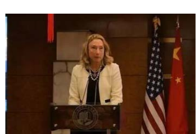
招待會上，紐約州參議員漢密爾頓、紐約州州長代表孫雯、布魯克林區長代表鄭蓉分別代表紐約州

起來到富起來再到強起來的飛躍，尤其是過去5年來，中國改革開放和現代化建設取得了新的偉大成就。下個月，中國共產黨第十九次全國代表大會將在北京召開。這是在全面建成小康社會決勝階段、中國特色社會主義發展關鍵時期召開的一次十分重要的大會。我們堅信本次大會一定會取得圓滿成功。 章啟月說，近年來，中國特色大國外交不斷推進，中美關係總體保持積極發展勢頭，兩國務實合作不斷拓展。