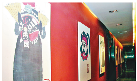
陳列於甘肅秦腔藝術博物館的「西秦腔」代表非遺——歌氏臉譜。

她說，從事傳統藝術的藝人成長周期漫長，理論、實踐、舞台磨礪缺一不可，口傳身教從何處承、往哪裡傳，這就需要老中青傳幫帶，一旦青黃不接，就會出現因為沒有敬畏而產生的浮躁，這對傳承而言是致命的。