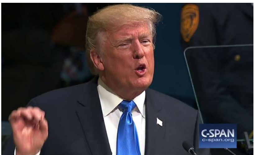
川普總統在聯合國大會一般性辯論上發表演講。

《華盛頓郵報》引述智庫美國傳統基金會 (Heritage Foundation) 的高級研究員布魯斯·克林納 (Bruce Klingner) 表示，以往的行政令只懲罰那些犯罪的個人，新的行政令則授權追究與朝鮮做生意的任何人，“這有潛在的重要意義”。 復旦大學國際問題研究院副院長沈丁立表示，他認為制裁並不能改變朝鮮擁核的決心。