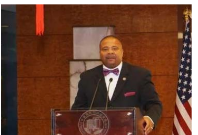
招待會上，紐約州參議員漢密爾頓、紐約州州長代表孫雯、布魯克林區長代表鄭蓉分別代表紐約州

作，表示總領館始終積極踐行“以人為本、外交為民”的理念，將繼續為美東僑胞提供優質服務。同時希望廣大僑胞關心中國發展，致力於中國和平統一大業，為推動中美關係發展繼續作出積極貢獻。 美國國務院駐紐約領事事務辦公室主任諾貝爾、紐約州參議員漢密爾頓代表來賓發言，向中國國慶和中國人民表示熱烈祝賀，積極評價中美關係取得的長足進展，中美互利合作符合兩國及兩國人民的利益，充分肯定華僑華人為中美交流與合作、社區繁榮發展所作的貢獻，期待兩國關係繼續健康穩定發展。