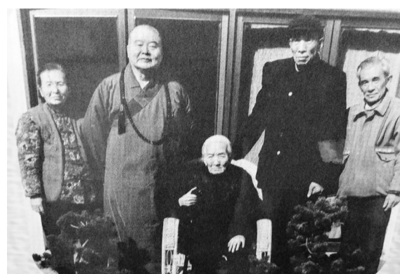
■星雲法師與母親、大哥、大姐及三弟分離三十多年後在日本首度團聚。

1989年4月20日，星雲首次回到闊別40年的家鄉，那一天全城轟動，江都縣原台辦主任趙寶余至今還歷歷在目，「傾城出動，萬人空巷！」那年3月27日，星雲率領「國際佛教促進會弘法探親團」一行75人，轉機香港，飛抵北京國際機場，開啟了陝西西安、四川成都、甘肅敦煌、重慶、湖北武漢、江蘇南京、揚州及鎮江、上海、浙江杭州一路的弘法與探親行程。