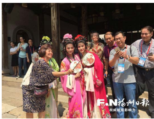
嘉賓們在三坊七巷爭先與閩劇演員合影

年輕人，還創造了那麼多的世界第一。”他說，要把自己的所見所聞寫出來，讓更多海外華僑瞭解國內先進科技的發展現狀。 新聞素材源自：福州晚報、福州日報、福州新聞網