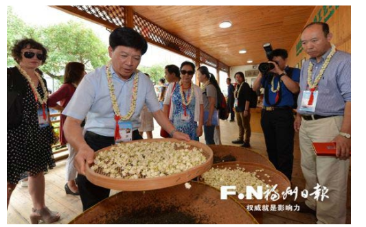
嘉賓體驗茉莉花製作工藝