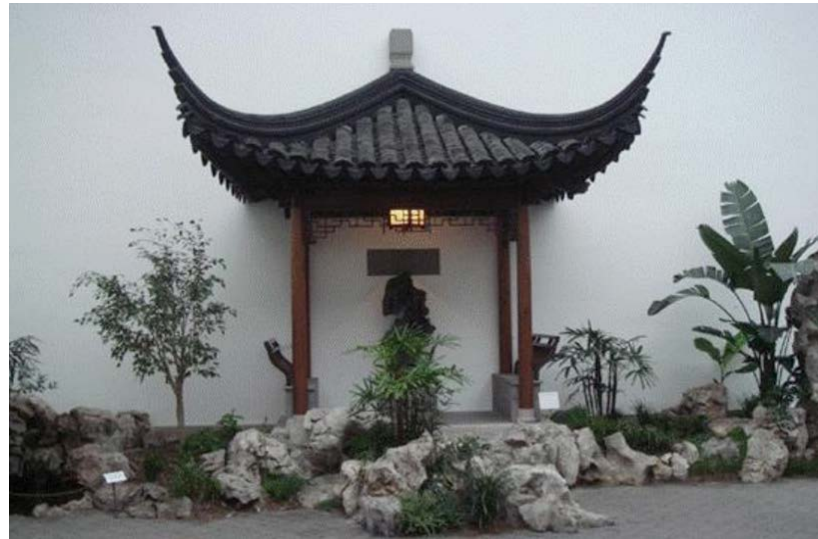
美國的明軒冷泉亭

充滿人文情懷的古典園林，彰顯著和諧之美、自然之美和層次之美，她讓遊客們在曲徑通幽處領略到了