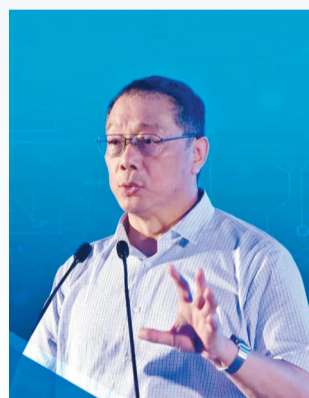
李鐵指房企以特色小鎮為名，塑造新的房地產空間。