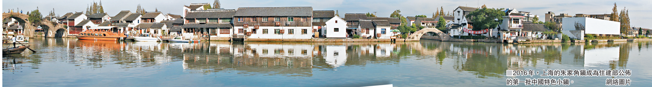
2016年，上海的朱家角鎮成為住建部公佈的第一批中國特色小鎮。網絡圖片

政策紅利疊加資本風口，使得特色小鎮近期在中國開展得如火如荼。據不完全統計，目前有幾十家房地產搶灘特色小鎮，數百個項目集體開工，機構預計其投資市場將達5萬億元（人民幣，下同）規模。專家指，吸引開發商入局小鎮的因素包括政府補貼、低價甚至零成本拿地等。部分特色小鎮已經出現產業未成形、房價已經漲起來的苗頭，引發越來越多聲音呼籲建設小鎮需防止開發商變相圈地蓋樓賣房。