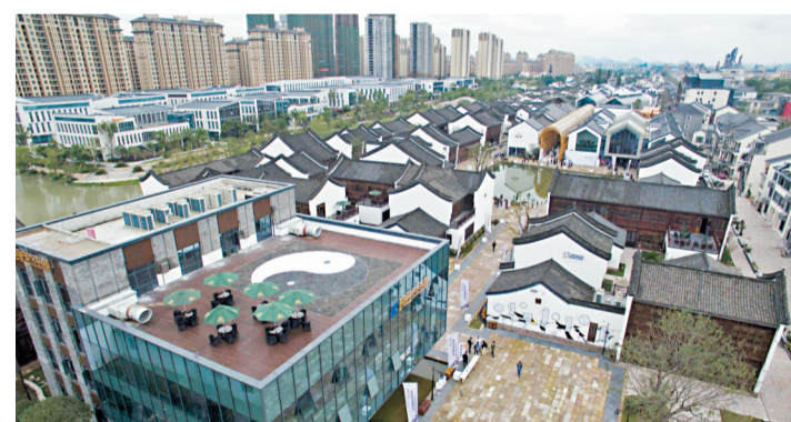
不少特色小鎮人口尚未流入，房價卻「一馬當先」急升。

記者日前查詢上海朱家角特色小鎮房產，發現現在中介處掛牌的都是2,000萬元一套的別墅居多。這也使得許多無力買房一族更是哀歎連連，稱原本只是買不起城市的房，現在連環城小鎮的郊區房也買不起了。