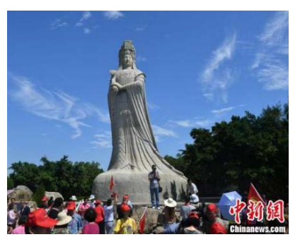
嘉賓參訪“媽祖故里”莆田市湄洲島的“媽祖下南洋·重走海絲路”活動在馬來西亞、新加坡成功舉行，活動有效地擴大了媽祖文化的國際影響。

祖，作為海上絲綢之路的庇護神，在海內外媒體的積極傳播下，其“立德、行善、大愛”的精神已深入人心。媽祖文化已成為在外華人華僑的精神家園和“海絲”的文化標誌。目前，全球有上萬座媽祖宮廟，分佈在41個國家和地區，媽祖信眾達3億多。2009年“媽祖信俗”被聯合國教科文組織列入人類非物質文化遺產名錄，成為中國首個信俗類世界遺產。多年來，莆田市委市政府積極發揮媽祖文化優勢，圍繞建設世界媽祖文化中心，成功舉辦了世界媽祖文化論壇、湄洲媽祖文化旅游節等活動，今年7月上旬為期一