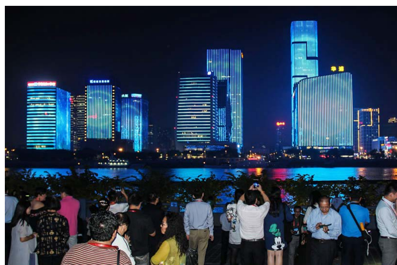
燈光照亮閩江，美景令世界華文媒體人流連忘返