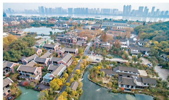
杭州玉皇山南小鎮自發展成為基金小鎮後，大量基金公司迅速聚攏。

儘管特色小鎮的初衷是要讓地方政府探索土地財政轉型出路，但眼下依然有不少小鎮的建設模式是前期地方政府投入大量財政，甚至用政府購買服務來變相舉債，走的又是原有土地財政老路。