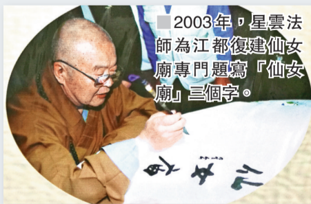
■2003年，星雲法師為江都復建仙女廟專門題寫「仙女廟」三個字。

江都縣城舊名仙女廟鎮，緣由與東陵聖母寺帶髮修行的杜康二位女道士有關。仙女廟的廟宇歷代有修繕，以清代咸豐年間重建的廟宇最為宏偉。清吳嘉紀的《夜發》中「水喧仙女廟，月上謝公灣。」以及其《仙女廟》中「夢中鄉里覺來遠，仙女廟前花纂纂。」都有對