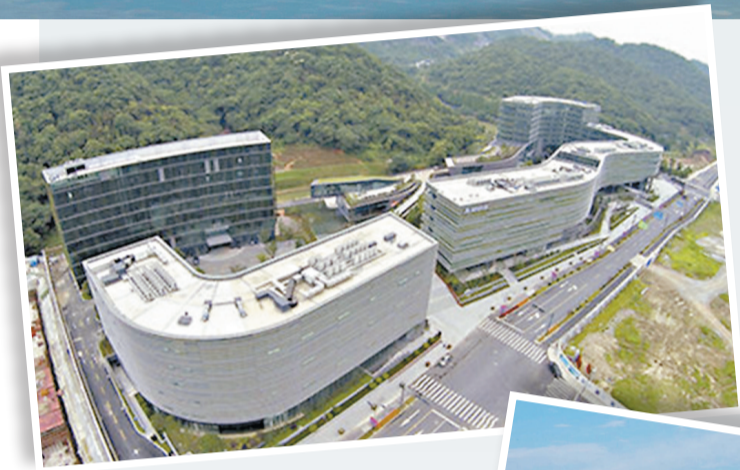
杭州雲棲小鎮在2014年首次被提及，是最早的特色小鎮之一。

對於小鎮項目中出現的地產化傾向，不少開發商認為，因為小鎮屬於「重中之重」的資產項目，目前能看得到的收益也只有房地產是小鎮的重要創收手段，一旦拋棄掉重資產，還真不知輕資產化路線要如何走好。