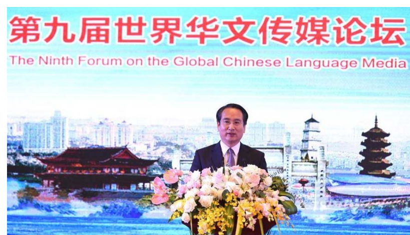
國務院僑務辦公室副主任譚天星在福州宣佈第九屆世界華文傳媒論壇閉幕