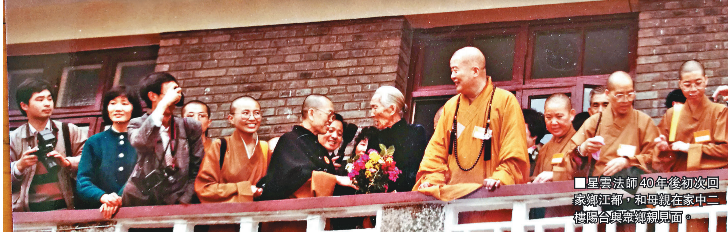
■星雲法師40年後初次回家鄉江都，和母親在家中二樓陽台與眾鄉親見面。

據江都台辦介紹，1976年，思鄉心切的星雲託香港江都籍理髮師兩次來江都尋找母親及同胞兄弟姊妹，了解大陸情況。在1977年與家中親人建立通信聯繫，並通過美國洛杉磯西來寺住持慈莊和尚中轉，捐錢資助家人。