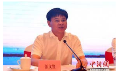
晉江市長張文賢介紹晉江經濟社會發展情況

大型體育賽事，帶動傳統鞋服製造業提質升級，加快發展體育全產業，引領體育城市建設，並開展城市管理國際化對標行動，以國際化的眼光、國際化的理念推進城市發展，努力打造一張世界喜歡的城市面孔。 “世界華文傳媒論壇是海外華僑華人瞭解祖國家鄉的重要視窗，也是世界認識中國的重要管道。”張文賢希望，“海外華媒朋友們能常來晉江走走，親身體驗獨具魅力的閩南傳統文化，欣賞美麗的海景風光，感受晉江強勁的發展脈搏，也真誠希望通過華文媒體朋友們的筆墨和鏡頭，更多更好地報導晉江、宣傳晉江、展示晉江，向世界發出‘晉江最強音’。”