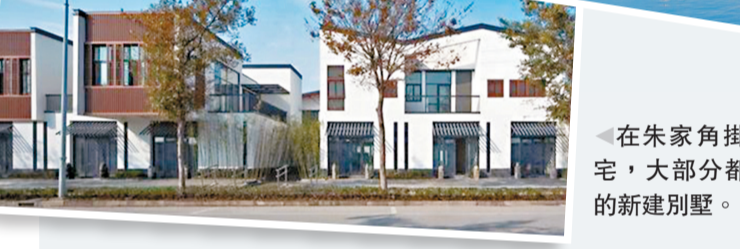
在朱家角掛牌出售的住宅，大部分都是所費不菲的新建別墅。