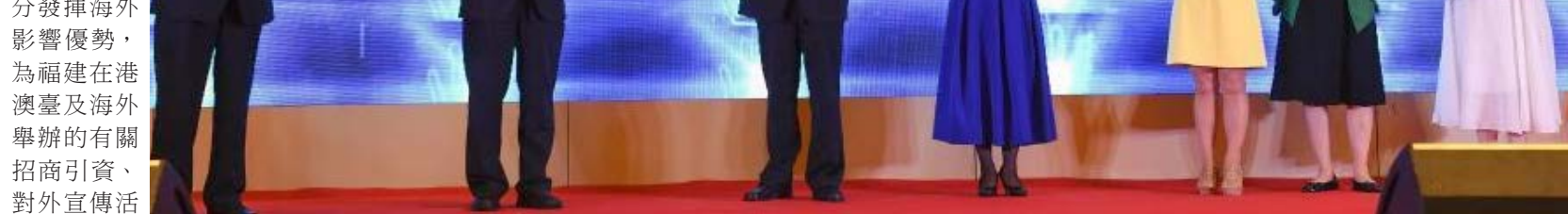
世界華文媒體合作聯盟官方網站改版上線暨全球華語視頻資訊共用中心啟動