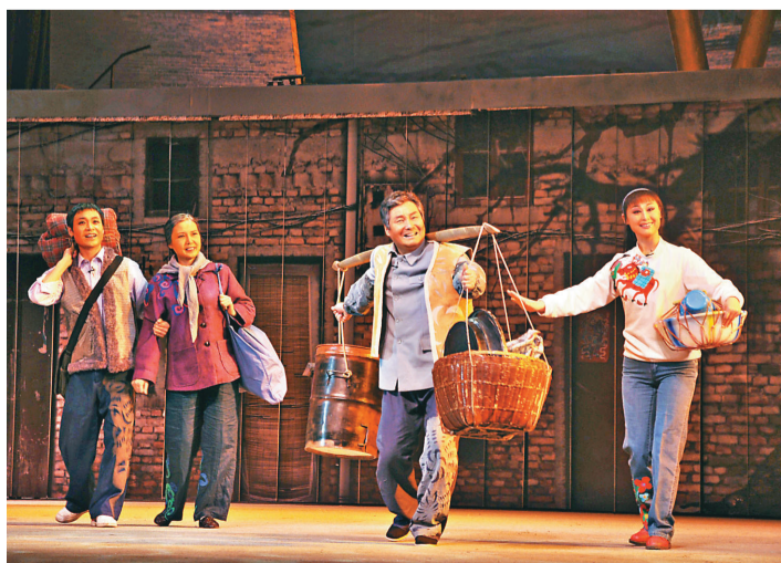
秦腔現代劇《西京故事》劇照，羅天福一家四口進城圓夢。