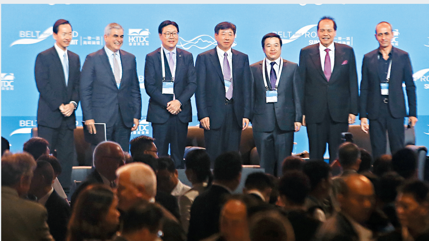
左起：亞洲金融集團總裁陳智思、阿亞拉公司董事長兼行政總裁海梅·索韋爾·德·阿亞拉、港鐵主席馬時亨、中鐵建董事長孟鳳朝、中交建副總裁文崗、CT集團主席凱魯·丹絨、Aedas創辦人及主席紀達夫。

香港文匯報訊 (記者莊程敏) 國家的「一帶一路」戰略，為港企和內地企業都帶來無限商機。港鐵主席馬時亨近日出席「一帶一路」高峰論壇時表示，公司有興趣在「一帶一路」倡議之下，與內地大型國企展開合作，尤其是有興趣與中鐵建合作。中鐵建董事長孟鳳朝亦表示，「一帶一路」中鐵建不能缺席，香港鐵路公司也不能缺席，願意與港鐵合作，「強強聯合，優勢互補，互利雙贏」。