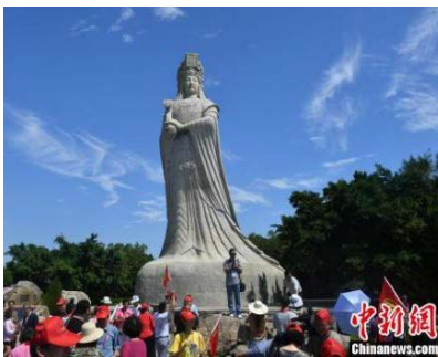
嘉賓參訪“媽祖故里”莆田市湄洲島的“媽祖下南洋·重走海絲路”活動在馬來西亞、新加坡成功舉行，活動有效地擴大了媽祖文化的國際影響。

祖，作為海上絲綢之路的庇護神，在海內外媒體的積極傳播下，其“立德、行善、大愛”的精神已深入人心。媽祖文化已成為在外華人華僑的精神家園和“海絲”的文化標誌。目前，全球有上萬座媽祖宮廟，分佈在41個國家和地區，媽祖信眾達3億多。2009年“媽祖信俗”被聯合國教科文組織列入人類非物質文化遺產名錄，成為中國首個信俗類世界遺產。多年來，莆田市委市政府積極發揮媽祖文化優勢，圍繞建設世界媽祖文化中心，成功舉辦了世界媽祖文化論壇、湄洲媽祖文化旅游節等活動，今年7月上旬為期一