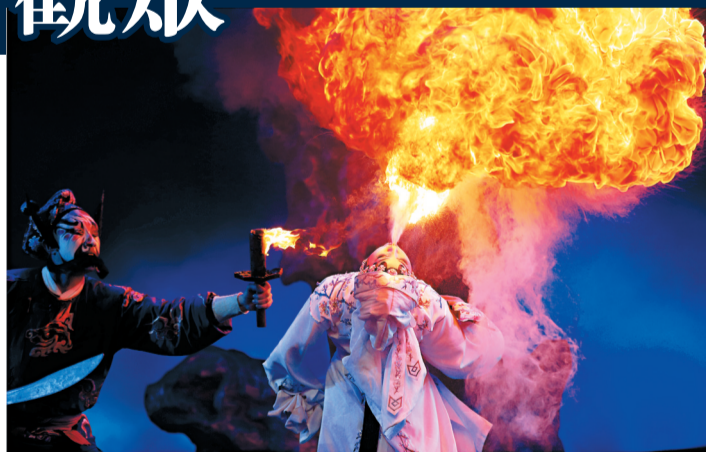
秦腔特技表演——吐火。

於陝西、甘肅、青海、寧夏、青海、新疆等西北地區。唱腔上，外界一般認為秦腔一味靠「吼」，所謂「唱戲吼起來」被譽為關中十大怪之一。其實秦腔唱腔既慷慨激昂，亦纏綿悱惻。苦音抒發悲憤、淒涼情感，歡音表現歡快、喜悅情緒。表演上，秦腔誇張中不失樸實、豪邁中透出細膩，深刻而動人。