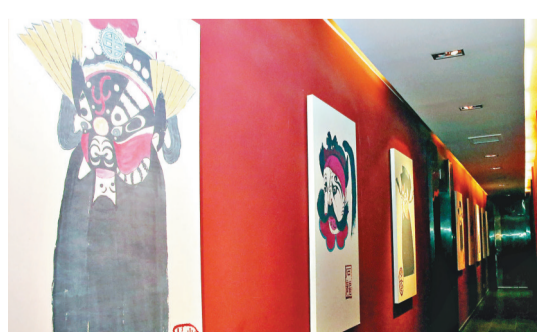
陳列於甘肅秦腔藝術博物館的「西秦腔」代表非遺——歌氏臉譜。

她說，從事傳統藝術的藝人成長周期漫長，理論、實踐、舞台磨礪缺一不可，口傳身教從何處承、往哪裡傳，這就需要老中青傳幫帶，一旦青黃不接，就會出現因為沒有敬畏而產生的浮躁，這對傳承而言是致命的。