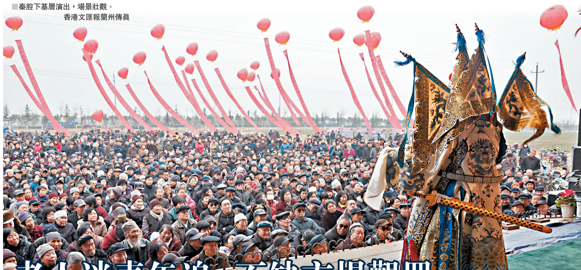
秦腔下基層演出，場景壯觀。

古老的秦腔在西北農村有着廣闊的受眾市場，尤其是陝西甘肅大地，人們對秦腔的摯愛更是深入骨髓。而在多元文化匯集的大都市，如何讓秦腔受到更多人的喜愛，是李梅和眾多秦腔演員正在努力的事業。近年來，秦腔這門古老的劇種開始不斷變身創新。2012年，秦腔現代戲《西京故事》第一次登上國家大劇院的舞台，並連續六年在內地多個省份和高校演出。劇目講述了懷揣「西京夢」的羅天福一家四口，來到租住著數十位農民工的大雜院中，如何面對困難生活的故事，既貼近當下生活，又向世人展現了古老秦腔的獨特魅力，觸動著每一位觀眾的心弦。讓秦腔更好地傳承，市場是最好的試金石。李梅告訴記者，一方面是古戲今唱，創新演出；另一方面，他們也積極開拓演出市場，在國內和海外奠定了堅實的受眾基礎。「藝術無國界，美是所有人都能體會的。」李梅說，他們曾多次到港澳台、歐美等地演出，在外國人的眼裡，秦腔這一中國傳統文化實際上蘊藏著更加豐富的內涵，除了唱腔，甚至連服裝也是一門藝術。荷蘭國立大劇院就曾提出購買秦腔演出服裝以做紀念，因為他們覺得既然秦腔的聲音留不下，那精美的服裝也是藝術的體現。