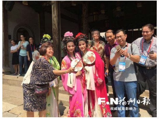
嘉賓們在三坊七巷爭先與閩劇演員合影

年輕人，還創造了那麼多的世界第一。”他說，要把自己的所見所聞寫出來，讓更多海外華僑瞭解國內先進科技的發展現狀。 新聞素材源自：福州晚報、福州日報、福州新聞網