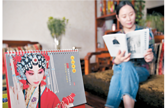
蘇鳳麗的青年戲迷製作的枱曆表達對她藝術的喜愛之情。

作為一門大眾的藝術，秦腔的受眾根植於廣大農村，因此，每年蘇鳳麗都會赴基層演出。而每次到基層農村演出，純樸的老鄉們總是騰出自家最好的房間、換上最新的被褥，天不亮就熬好罐罐茶、烙好油餅（甘肅農村傳統早餐）款待他們心中的「大明星」，還有一些古稀老人摘下自家最新鮮的水果，揣著自己平時都捨不得喝的飲料守在後台……這讓蘇鳳麗不止一次感動得淚流滿面。