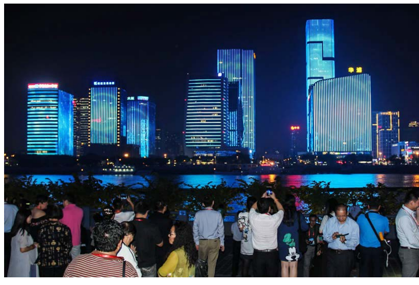
燈光照亮閩江，美景令世界華文媒體人流連忘返