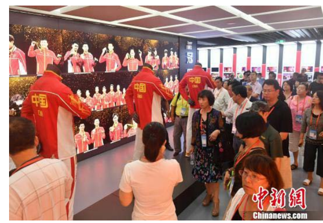
海外華文媒體代表參觀安踏公司

晉江旅居海外的華僑華人達到300多萬，足跡遍佈世界各地，活躍在經濟、科技、教育、文化等各個領域。 歷經改革開放30多年發展積澱，晉江已擁有2個超千億、7個超百億產業集群，46家上市企業，3.3萬多家民營企業，縣域經濟基本競爭力位居全國第5位，綜合經濟實力位居福建縣域首位。 張文賢介紹說，當前，晉江正加快融入“一帶一路”願景，全力打造國際化创新型品質城市。“我們以積體電路、石墨烯、光伏電子為主攻方向，大力發展高新技術產業，一批高端產業加快集聚，正有力推動產業升級轉型和發展動能轉換。” 當前，晉江還積極舉辦2020年第十八屆世界中華學生運動會，籌辦第一屆國際大學生足球世界盃，將通過舉辦一系列