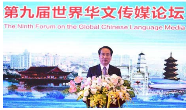
國務院僑務辦公室副主任譚天星在福州宣佈第九屆世界華文傳媒論壇閉幕