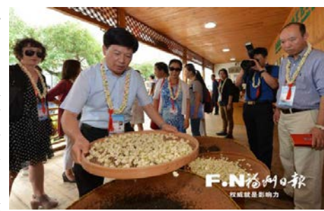
嘉賓體驗茉莉花茶製作工藝