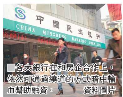
各大銀行在和房企合作上，依然可通過繞道的方式暗中輸血幫助融資。

行，類似借道資管計劃和委託貸款等方式，或者配置債券、非標資產、權益類資產的理財資金，也可以通過如此繞道方式投資房地產。不過，銀行繞道輸血的方式或也將被收口。中國銀監會下半年重點整治業務包括銀行表外業務，銀監會主席郭樹清同時表達了要堅決抑制部分地區的房地產泡沫的決心。業內對此解讀，認為銀行表外、通道的產品將面臨大限，很可能會堵死夾縫中融資的地產公司的最後幾條道。