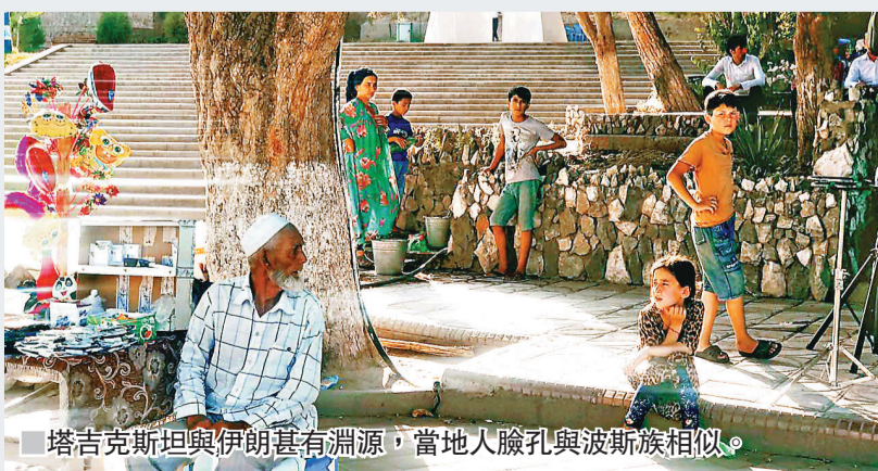
塔吉克斯坦與伊朗具有淵源，當地人臉孔與波斯族相似。

塔吉克人熱情好客，走在街上到兩個當地人上前熱情搭訕握手，他們會主動與你打招呼，有時會用中文「你好」問候。總之，這是一個年輕的、有發展前景的山國。