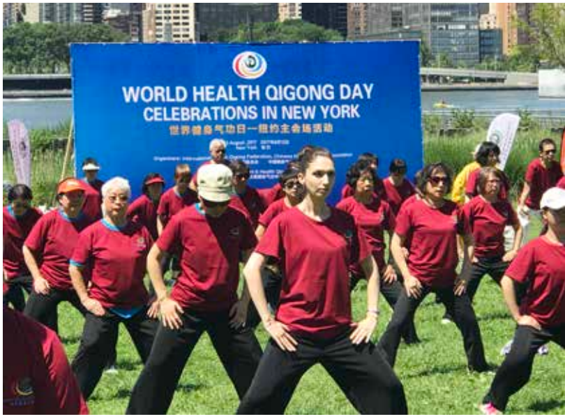
紐約的氣功愛好者在紐約龍門廣場州立公園(Gantry Plaza State Park)舉辦的世界健身氣功日活動上練習健身氣功。

【本報訊】8月10日至18日，中國健身氣功協會代表團一行在紐約拉開了健身氣功美國行活動的帷幕。紐約站的活動安排了健身氣功與科學健身學術論壇、「世界健身氣功日」主會場展演、健身氣功師資人才培訓等多項活動，形式多樣，內容豐富，術道並重，寓教於練。活動承辦方美國《僑報》、美國太極健身氣功中心為本次活動的開展做了精心準備，為中國傳統文化和健身氣功愛好者搭建起了高水準交流平臺。