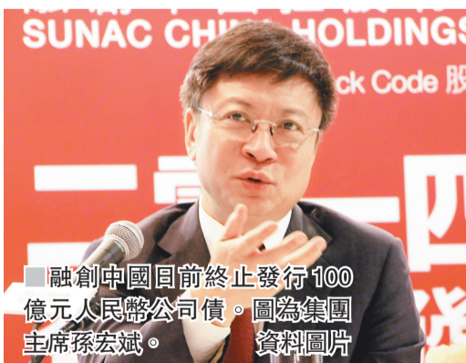
融創中國日前終止發行100億元人民幣公司債。圖為集團主席孫宏斌。

前的監管口徑，周轉快、負債率低的企業發債需求更容易獲批。而目前大部分的房企可謂都是「負債累累」，加大了投資者的風險，也推高了市場風險。