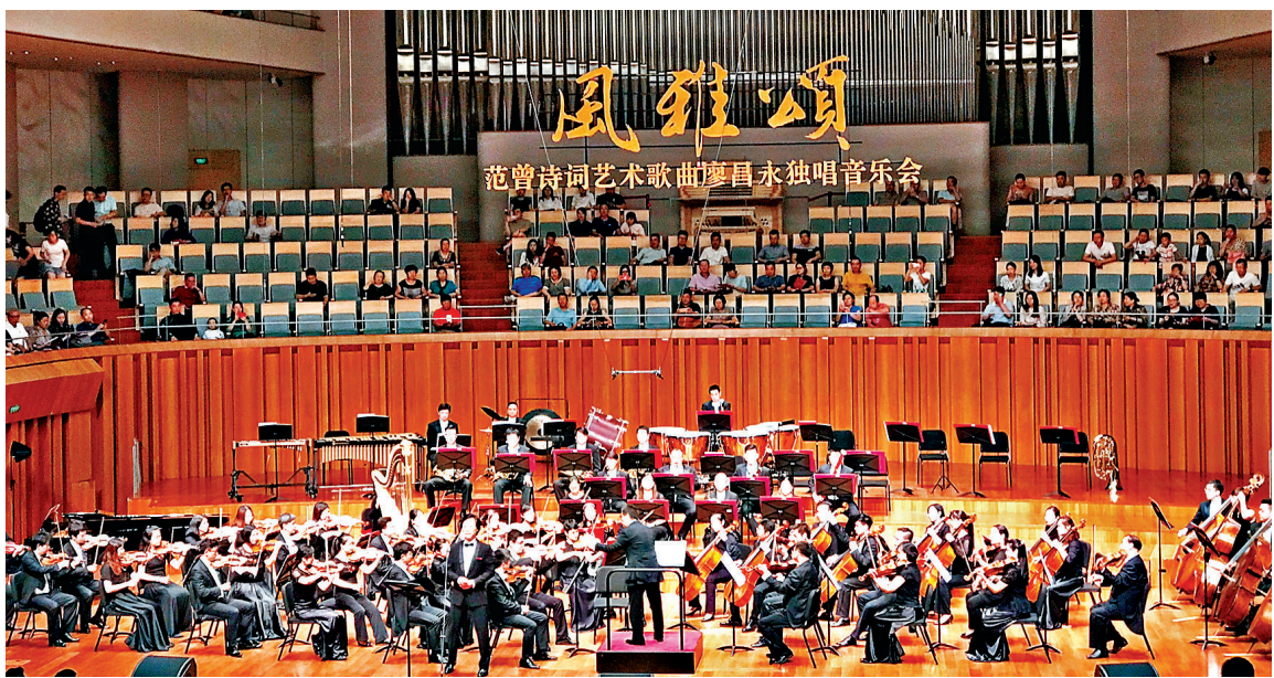
著名歌唱家廖昌永演唱范曾創作的詩詞。