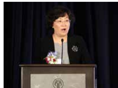
山東省商務廳副廳長呂偉

山東省商務廳副廳長呂偉表示，由於出臺了新政策以及出現了新的市場，山東出現了新的商業環境。文化產業是今後山東重點推動新舊動能轉化的十大重點產業之一。近年來，山東出臺了很多加強文化建設和走出去的政策，對山東的對外文化貿易在產業規劃、市場佈局、政策支持和便利化等方面做出明確而具體的部署。她特別提出了3個文化產業合作與交流的領域，首先是動漫及文化創意產業，其次是促進傳統文化的創新，第3是沈化新聞出版及影視業的合作。山東希望與各位美國朋友攜手並進，共用機遇，共謀發展，推動雙方經貿合作和文化交流。