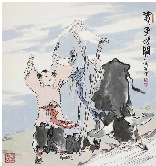
范曾作品《老子出關》。

國博館長呂章申介紹，此次藝文展中的《後赤壁賦》（2004年）、《老子出關》（2004年）、《固一世之雄也》（2004年）、《夢遊天姥吟留別》（2004年）、《無量壽》（2011年）、《愚公移山》（2017年）等6幅精品畫作將由范曾親自捐贈給中國國家博物館收藏。他認爲范曾的義舉再一次體現了這位心懷家國的大藝術家博雅胸襟。