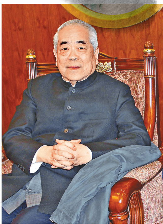
著名國學大師、書畫巨匠、詩人范曾。資料圖片