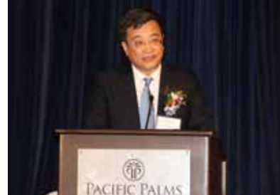
山東省委宣傳部副部長王少傑