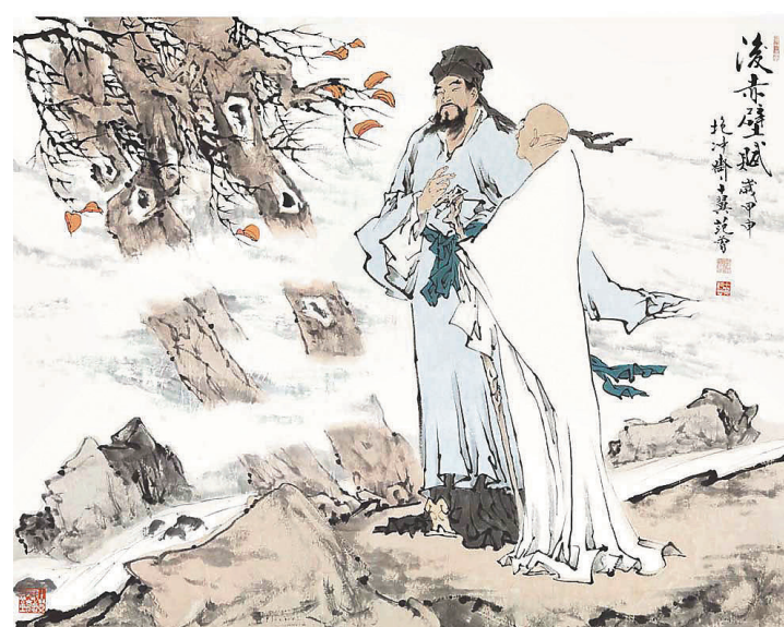
范曾作品《後赤壁賦》。網上圖片