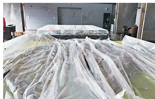
■無人居住並不代表無人購買，萬科金域灣灣樓處一期開盤後2個月就已售罄。

這些都表明了儘管上海一些區域沒有人居住，但房子照樣賣得飛快，空置率的存在，不代表着庫存的高企。