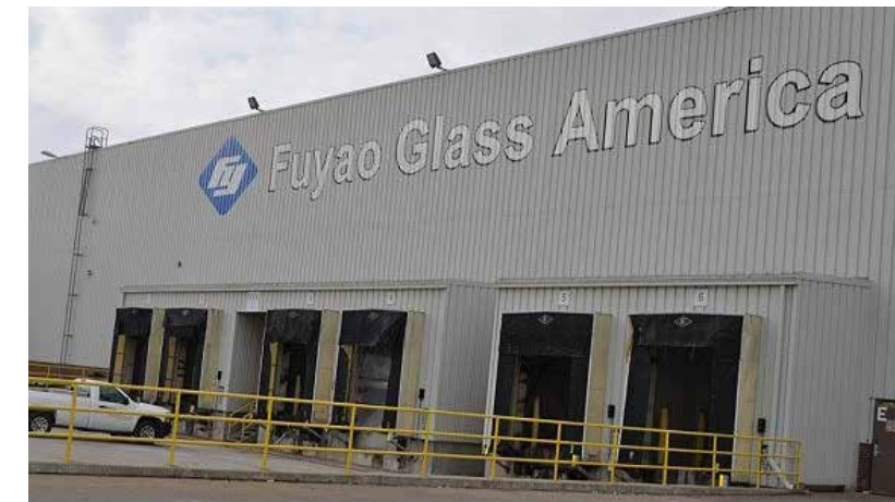
福耀美國工廠廠房