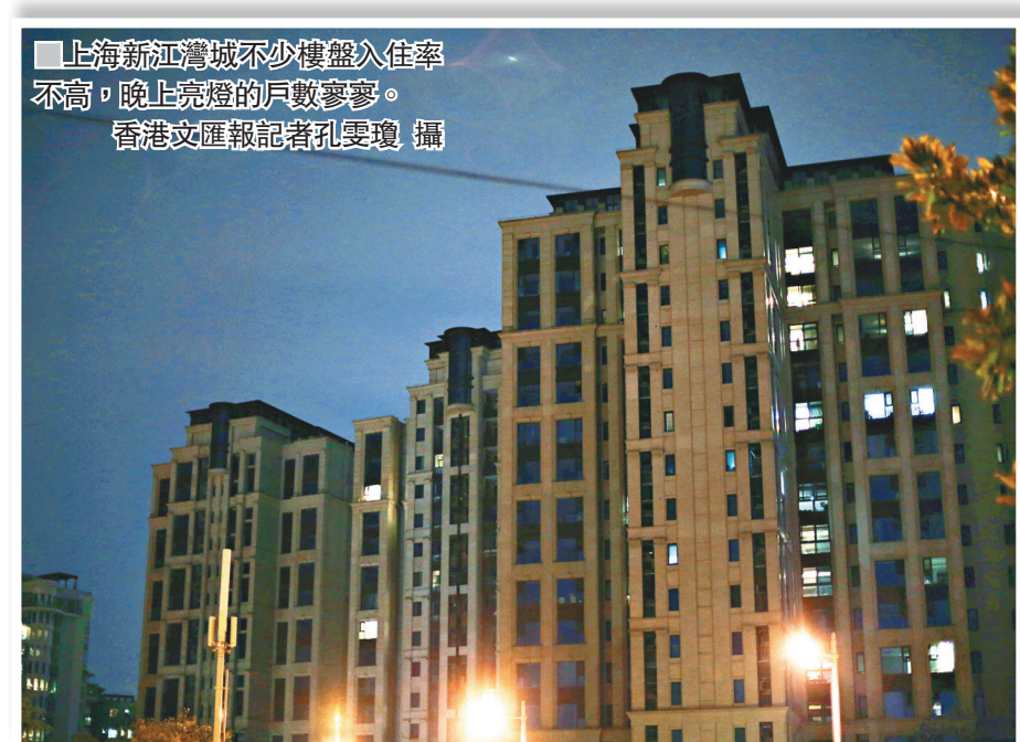
上海新江灣城不少樓盤入住率不高，晚上亮燈的戶數寥寥。

高，是由於人口規模沒有達標，住宅配套卻提前達標所造成。如臨港地區距離上海主城區70公里，人口沒有完全蔓延至此，房子卻都已經造好了，因此房多人少，看着一片空蕩蕩。