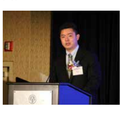
中國駐洛杉磯總領事館商務領事郭汝達

中國駐洛杉磯商務參贊郭汝達表示，中國是加州第一大交易夥伴、第一大進口來源地和第三大出口市場；加州也是中國企業在美投資最多的州，最新的統計資料顯示，在加州註冊的中資企業超過550家。前不久在中國國家主席習近平會見在中國訪問的加州州長布朗時，布朗表示加州也要積極參加中國“一帶一路”建設。他說，在這樣的背景下，他相信這次山東省代表團訪美推介活動，將有助於山東和加州兩地商界把握機遇，把山東與加州