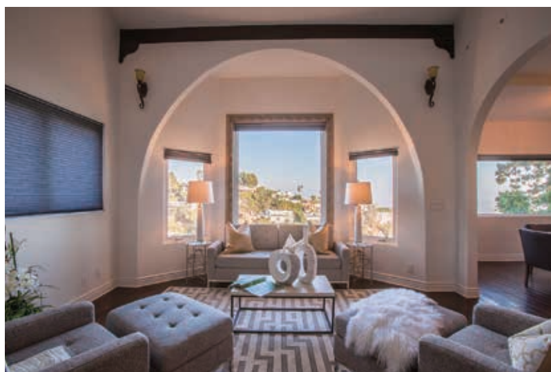
5房 5.5浴 5193平方尺 售: $4,490,000

3581 Multiview Dr. Los Angeles, CA 90068