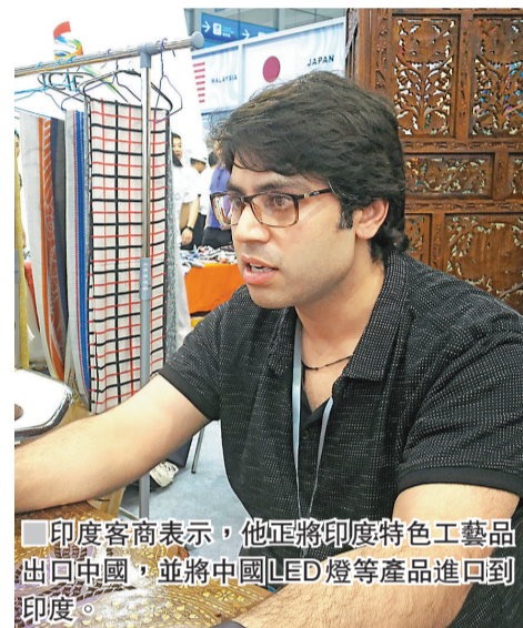
印度客商表示，他正將印度特色工藝品出口中國，並將中國LED燈等產品進口到印度。