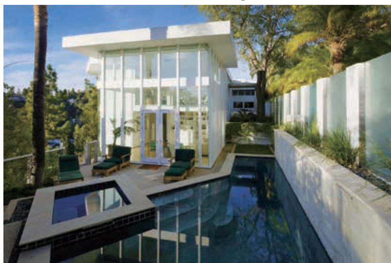
4房 3.5浴 3948平方尺 售: $4,250,000

9400 Readcrest Dr. Beverly Hills, CA 90210