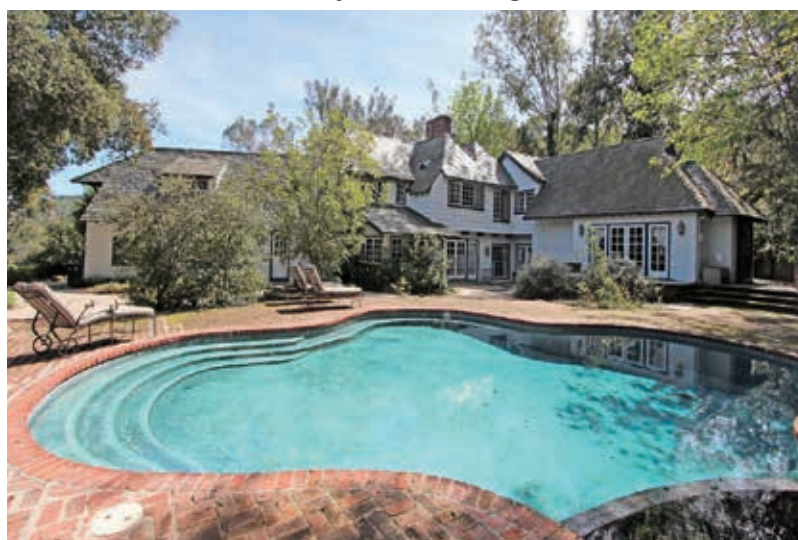
4房 4.5浴 4604平方尺 售: $5,500,000

9400 Readcrest Dr. Beverly Hills, CA 90210