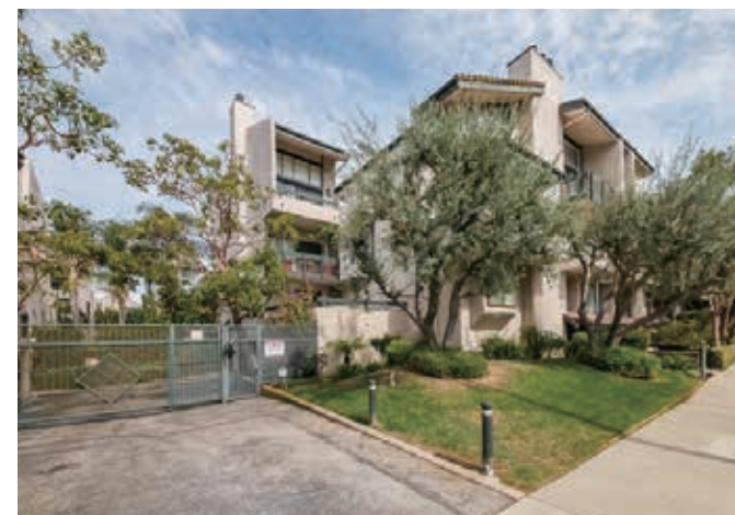
2房 2.5浴 1583平方尺 $3,700/月/出租

1920 Pandora Ave. #3 Los Angeles, CA 90025