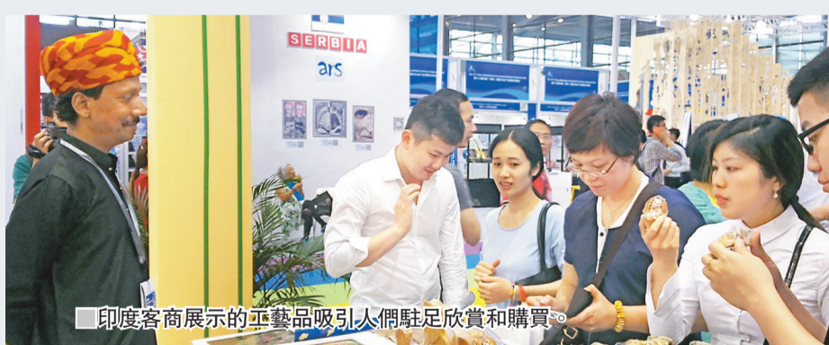
印度客商展示的工藝品吸引人們駐足欣賞和購買。

記者在埃及展位看到，他們在「一帶一路」展館中面積最大，推介埃及文化、藝術品和工藝品，他們展館負責人表示，他們看好中埃文化交流和合作機遇，重點是向中國顧客推介埃及深厚燦爛的文化，吸引中國遊客和客商前去投資和旅遊等。而