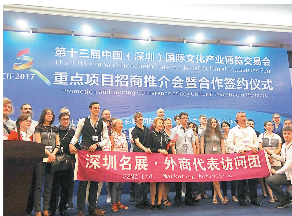
歐洲客商對中國許多文化感興趣，他們尋求投資機會。