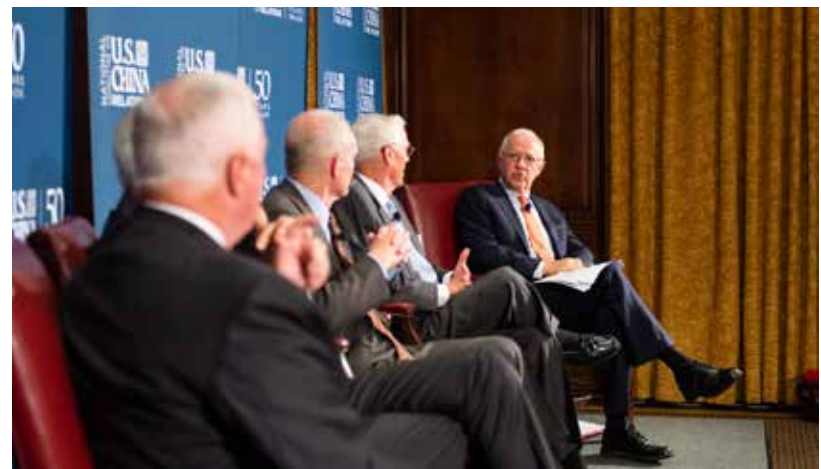
美中關係全國委員會主席史蒂芬·奧林斯(右一)主持對話