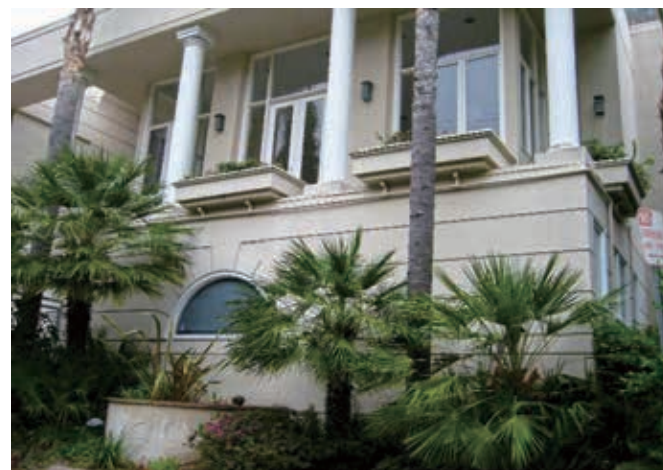
5房 4浴 5193平方尺 售: $3,750,000

6445 Deep Dell Pl. Los Angeles, CA 90068