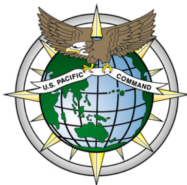
美國太平洋司令部標誌

期覆蓋了上世紀九十年代中期至今，期間中美兩國經歷了諸如台海危機、美國轟炸中國駐南使館、中美南海撞機事件、中國加入世界貿易組織、美國911恐怖襲擊、美國“小鷹”號航母事件、中國汶川地震救援、美國“亞太再平衡戰略”的外交政策調整等重要時刻。作為美國軍方在太平洋地區的最高軍事指揮官，這些前總司令們不但親自見證、參與和影響了期間的中美關係，對中美關係的發展以及目前的亞太安全局勢也有著自己獨到的見解。