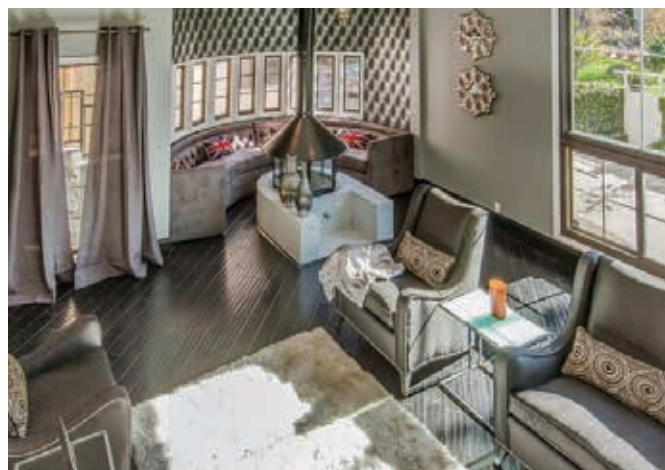
4房 3.5浴 3300平方尺 售: $1,695,000

531 N. La Jolla Ave. Los Angeles, CA 90048