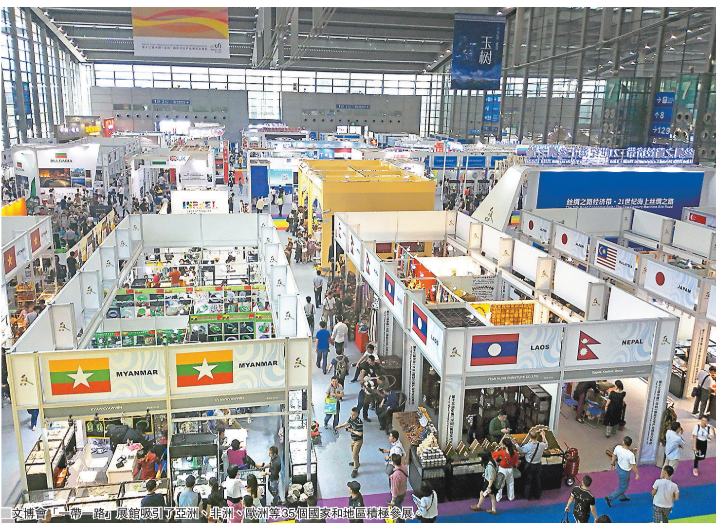
文博會「一帶一路」展館吸引了亞洲、非洲、歐洲等35個國家和地區積極參展。

「一帶一路」作為中國國家戰略，近幾年正在迅速推進，越來越多的國家積極加入，分享中國投資、建設等機遇，推進「一帶一路」的文化合作則是促進中外交流、友誼和合作的基礎。此次文博會吸引了來自歐洲、亞洲、非洲、南美洲、北美洲、大洋洲的35個國家和地區117家海外機構參展，並邀請了來自美國、英國、法國等全球99個國家和地