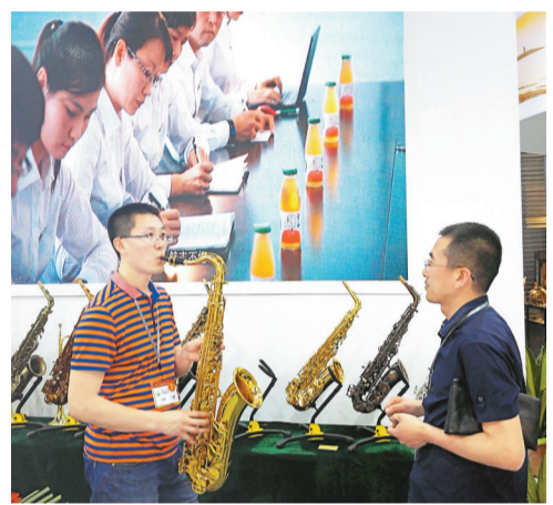
山東一企業生產的薩克斯樂器，廣受歐美消費者的熱捧。

中國許多文化產品也受到海外的歡迎和積極採購，山東龍口一生產相冊的企業出口歐洲年銷售額近億元（人民幣，下同）。因中國文化產業實現快速升級發展，深圳華強文化科技集團的主題樂園目前正吸引法國、阿聯酋等國客商前來洽談，也有不少歐洲客戶組成代表團前來文博會尋找合作機遇。