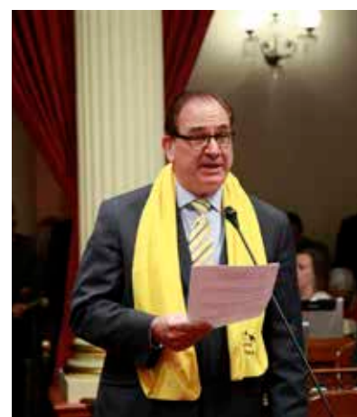
當地家長們 顛覆了。

5月16日的選舉顛覆教師工會的候選人不是只有在加州發生，在全國其他的學區選舉中也正一直在上演中。所以說不要等待超人來幫助我們，只要我們願意努力，我們就可以改變我們自己的命運。不信的話，看看在工會極力抵制的洛杉磯聯合學區大本營就在幾天前被多數