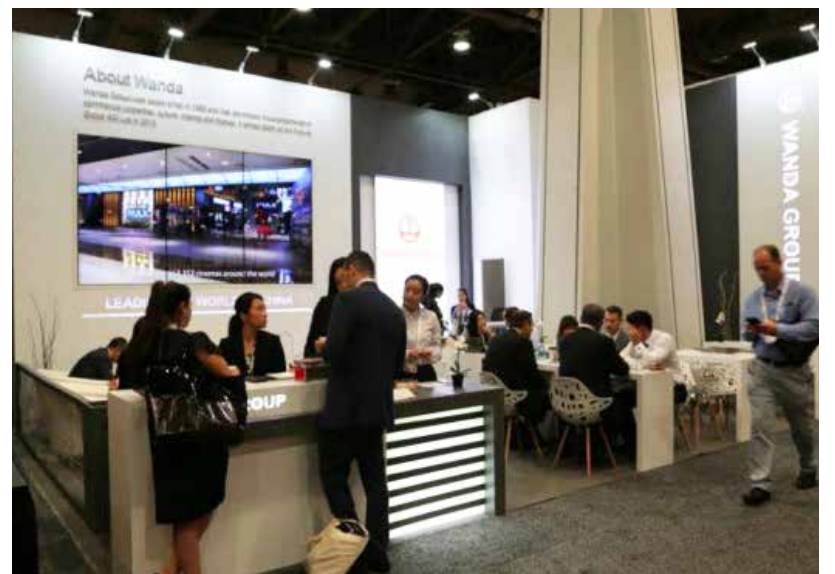
圖為：萬達集團展臺

此外，上海恒隆廣場的“Santa's Atelier 奇幻禮物工場”則透過洋溢節日氣氛的裝飾及橫跨整月的線上及線下趣味活動，成功打動評審委員。“亞洲—太平洋史蒂夫獎”是唯一一項表彰亞太區內22個地區的創新意念的企業獎項。今年，區內共有超過700家機構獲得提名，競逐獎項多個類別的殊榮，包括消費產品及服務業優秀創新獎、創新管理獎、企業網站創意獎等，其中包括恒隆廣場榮獲的消費者活動創新獎（廣告、市場策劃及公共關係）。