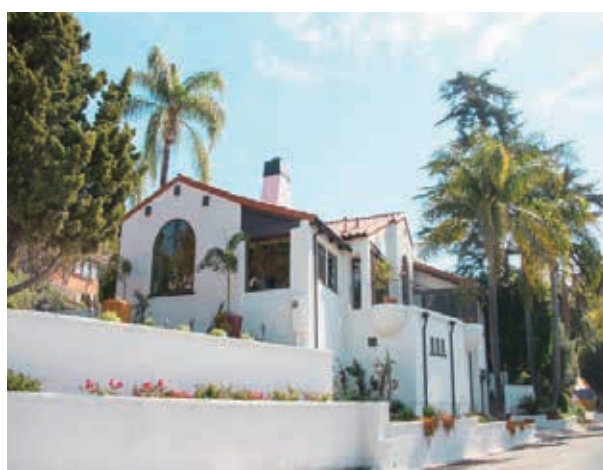
4房 4浴 3540平方尺 售: $1,995,000

3123 La Suvida Dr. Los Angeles, CA 90068