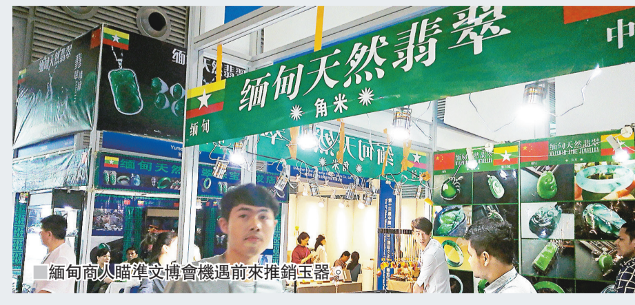
緬甸商人購進文博會機遇來推銷玉器。

緬甸一些玉器商則推出七八款新器，售價從1,000至5,000元不等，也吸引許多顧客駐足欣賞和購買。