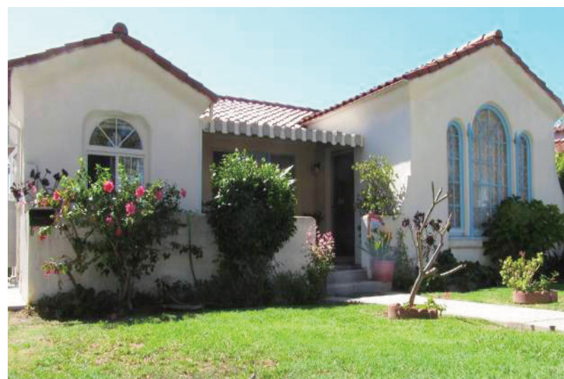
3房 3浴 2028平方尺 售: $1,699,000