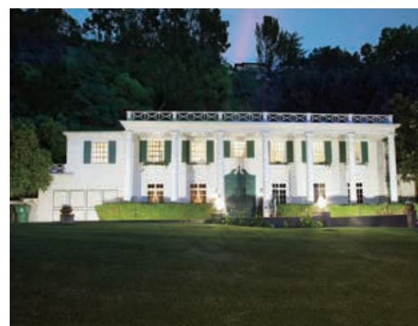
6房 7.5浴 5500平方尺 $25,000/月/出租

1148 Coldwater Canyon Dr. Beverly Hills, CA 90210