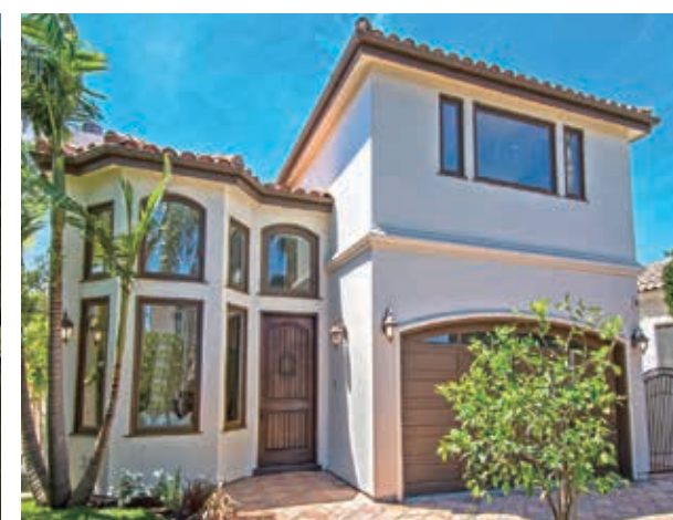
5房 4.5浴 3135平方尺 售: $2,675,000

1148 Coldwater Canyon Dr. Beverly Hills, CA 90210