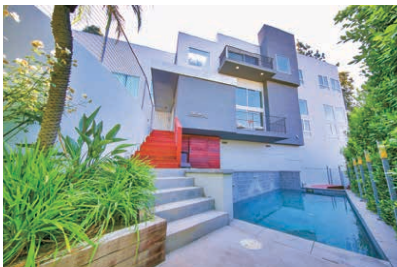
6房 6.5浴 9302平方尺 售: $4,895,000

3581 Multiview Dr. Los Angeles, CA 90068