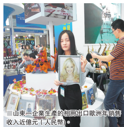
山東一企業生產的相冊出口歐洲年銷售收入近億元（人民幣）。

在文博會上，法國、俄羅斯等許多歐洲客商還組團前來考察和了解中國文化市場，通過交流和互動，發現中國文化精品，將其引入歐洲，並且還尋求投資一些他們感興趣的文化產業。