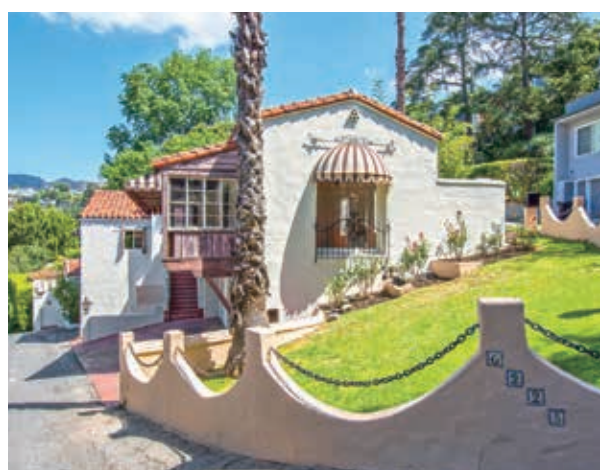
3房 4.5浴 3703平方尺 售: $2,450,000

3123 La Suvida Dr. Los Angeles, CA 90068