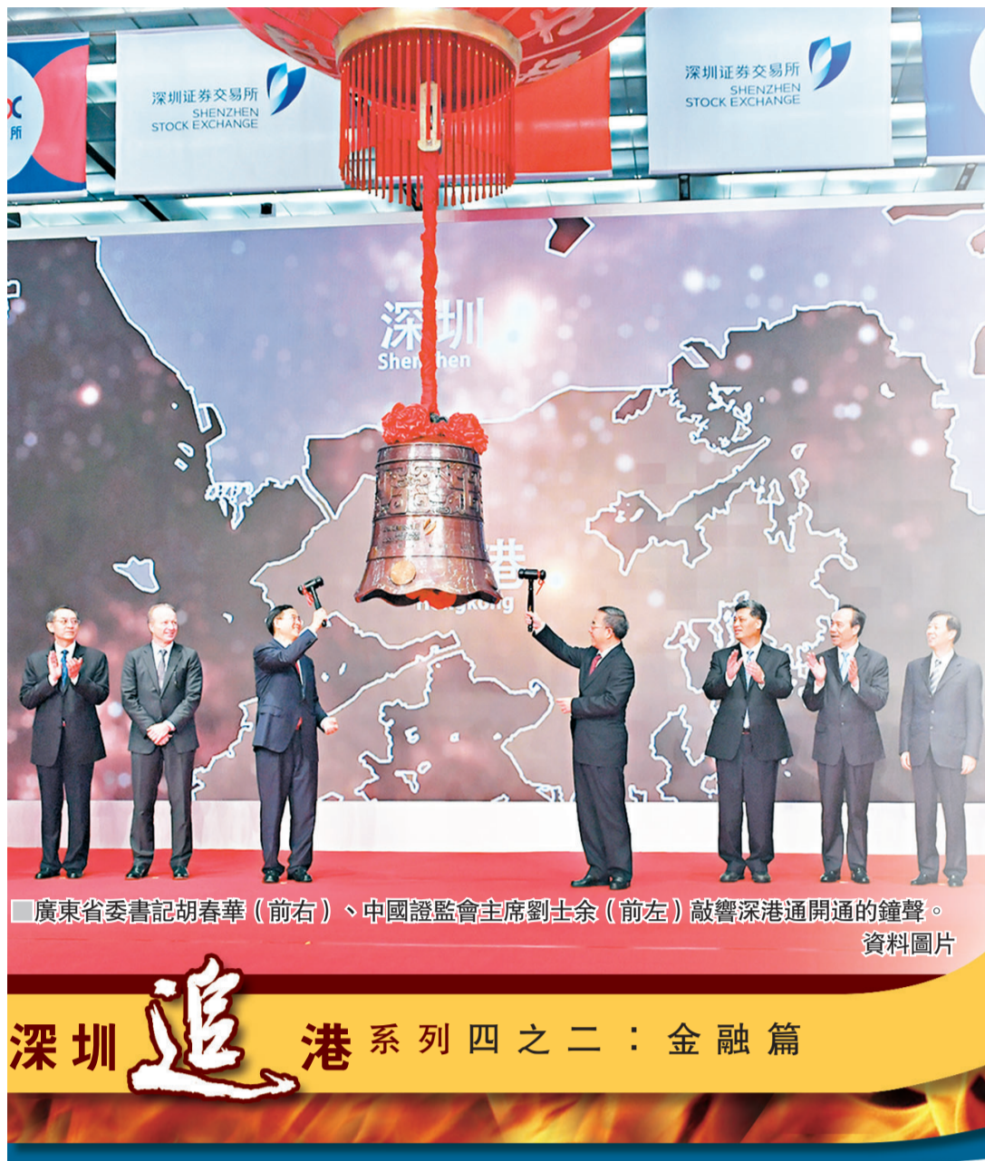
廣東省委書記胡春華(前右)、中國證監會主席劉士余(前左)敲響深港通開通的鐘聲。資料圖片