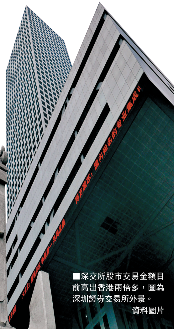
■深交所股市交易金額目前高出香港兩倍多，圖為深圳證券交易所外景。