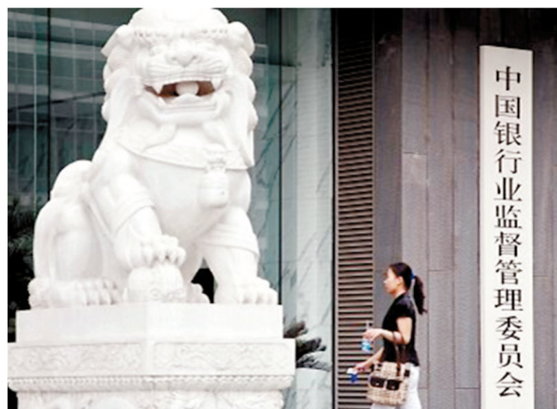
中國銀監會一季度對違規機構罰沒金額1.9億元人民幣，佔去年全年的70%。

有監管部門官員透露，今年證監會將在繼續嚴打場外配资、徹查違規槓桿資金、打擊虛假陳述、內幕交易和操縱市場等傳統違法違規行為同時，還將全面篩查可能產生系統性風險、影響市場穩定、干擾改革發展的各類違法案件，通過現場檢查、專項核查、市場監察、輿情監測、投訴舉報……為各種違法者佈下「天羅地網」。