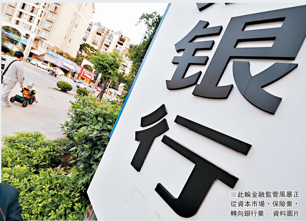
此輪金融監管風暴正從資本市場、保險業，轉向銀行業。資料圖片