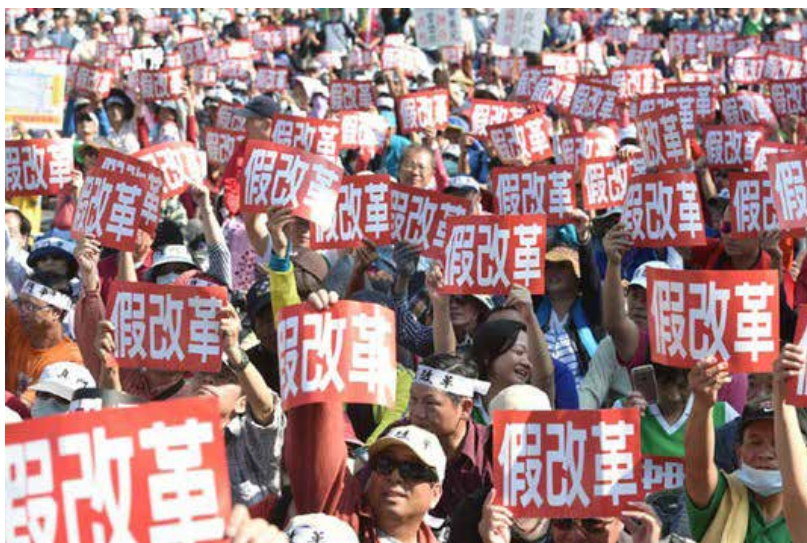
民眾抗議年金改革。