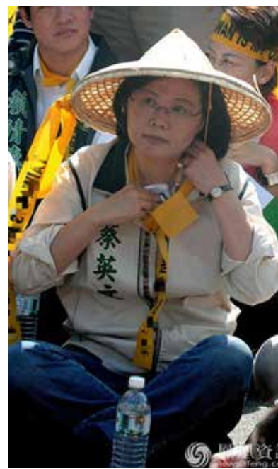
蔡英文街頭抗議

昨是今非 看到蔡當局和綠營人士現在的說法和行為，台灣的政治人物和民眾都感歎「昨是今非」，因為他們今天的所做所講和在野時的表現反差太大了。2008年馬英九當選台灣地區領