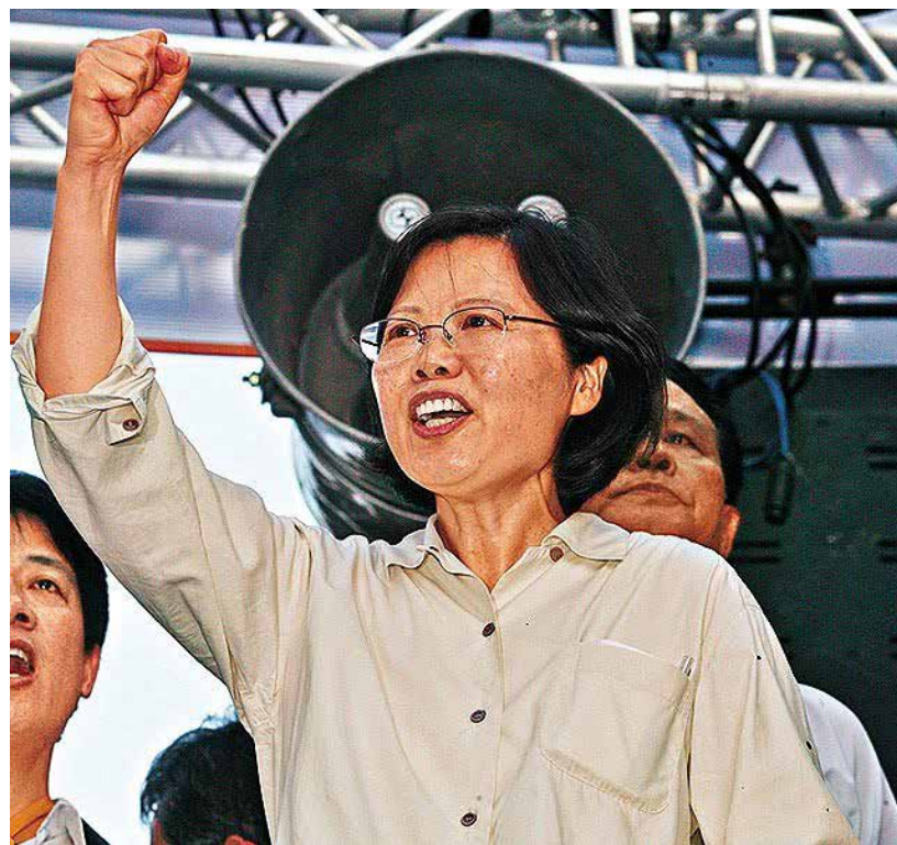
民進黨「綠巨人」蔡英文

蔡英文素有「暴力小英」的「雅號」，在馬英九時期，她橫衝直撞、大殺四方，簡直稱得上是民進黨的「女戰神」。都說歲月會磨平人的棱角，這才沒過幾年，她儼然又成了反暴力的代表。暴力小英反暴力，聽起來有些諷刺。蔡英文你可真在乎「人民的名義」？