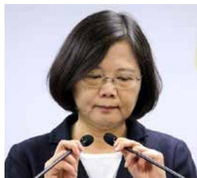
蔡英文被批「執政無能」

還有像「拒馬、蛇籠其實根本沒有法源依據設置」「集會遊行的民眾是你們的敵人嗎」，這些話也都是出自馬英九時期的綠營政治人物之口。可是現在，不管他們心裡怎