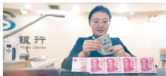
■近年不少內地客戶將資金轉到香港銀行後火速提現，銀行由此產生戒心。

上述接近香港銀行業的人士稱，現在的確很多香港銀行要求充分了解客戶，不少銀行甚至直接要求開戶人有香港戶口或香港地址，而這些也是為了反洗錢的目的。此前有地下錢莊花錢僱用內地人來開戶，受僱者開戶後，會將卡和密碼交給錢莊用於洗