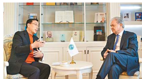
上海合作組織秘書長阿利莫夫接受香港文匯報副總編輯尹樹廣專訪。

阿利莫夫特別告訴記者，他從2006年開始，便每年獲邀去人民大會堂旁聽中國總理的政府工作報告，今年已是第12次了。他說，他一邊聽李克強總理作政府