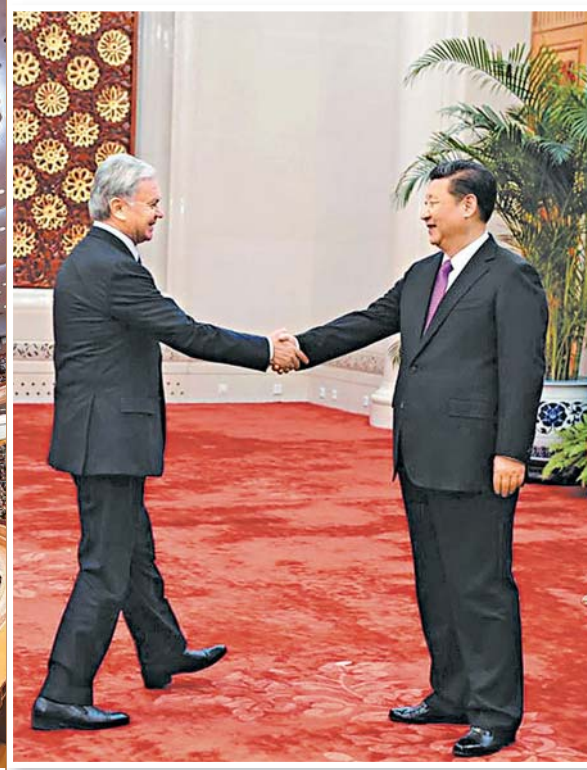
2016年2月29日，習近平在人民大會堂會見阿利莫夫，希望他為推動上合組織各領域合作作出新貢獻。資料圖片

阿利莫夫特別告訴記者，他從2006年開始，便每年獲邀去人民大會堂旁聽中國總理的政府工作報告，今年已是第12次了。他說，他一邊聽李克強總理作政府