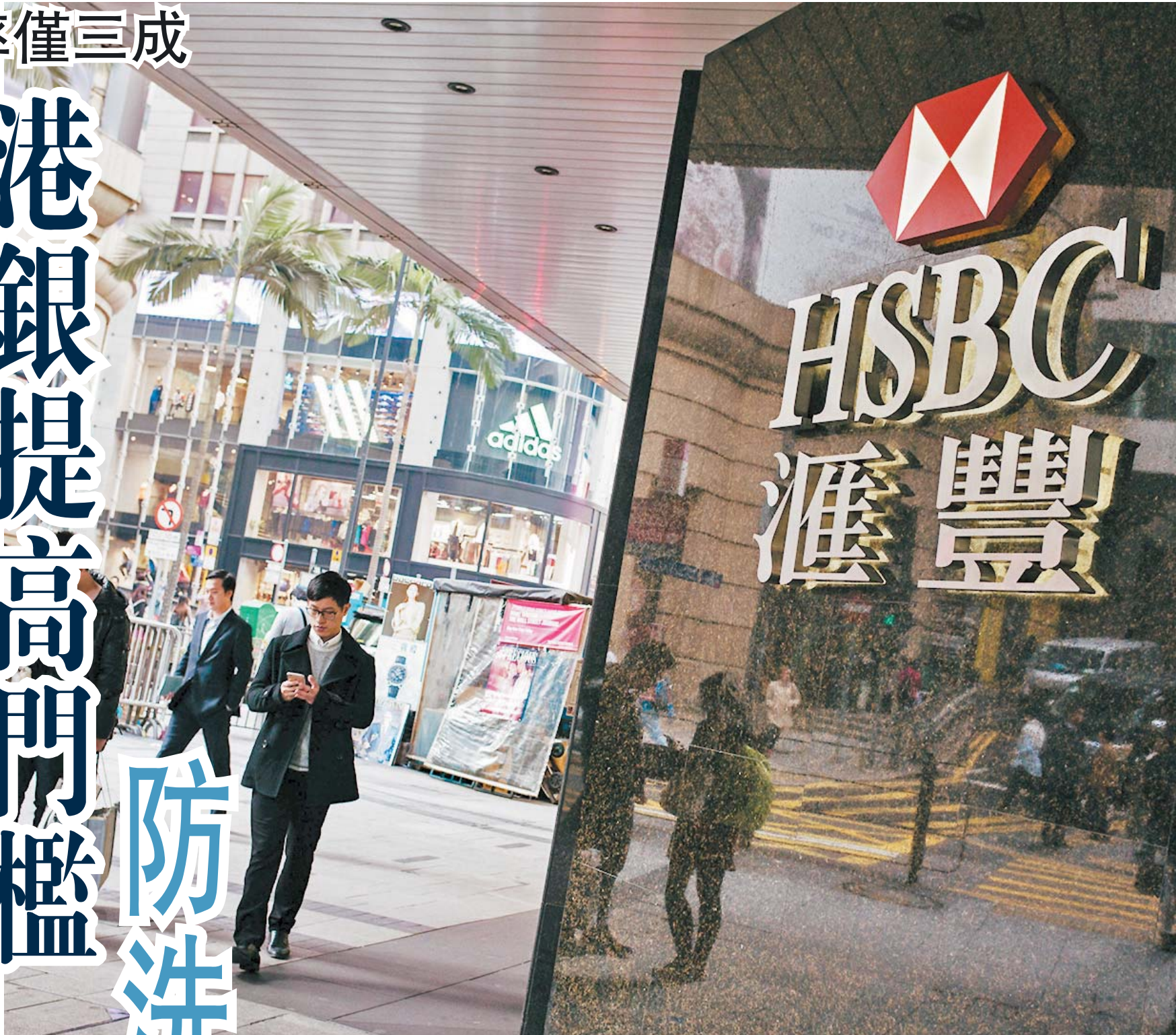
之前開戶與現在開戶對比 (部分據受訪者提供)