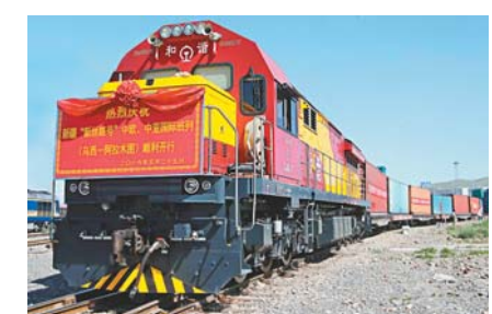
「新絲路號」國際班列已於去年在新疆開通，滿載貨物前往哈薩克斯坦阿拉木圖。資料圖片

合多邊經濟合作問題。近年來，上合組織一直在經濟合作方面投入巨大力量，相信經過一段時間有望取得突破。