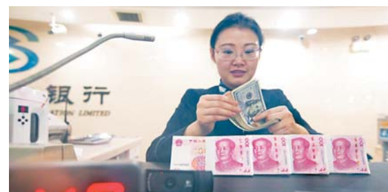
■近年不少內地客戶將資金轉到香港銀行後火速提現，銀行由此產生戒心。

上述接近香港銀行業的人士稱，現在的確很多香港銀行要求充分了解客戶，不少銀行甚至直接要求開戶人有香港戶口或香港地址，而這些也是為了反洗錢的目的。此前有地下錢莊花錢僱用內地人來開戶，受僱者開戶後，會將卡和密碼交給錢莊用於洗