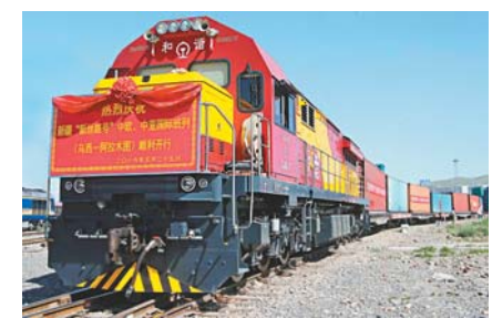
「新絲路號」國際班列已於去年在新疆開通，滿載貨物前往哈薩克斯坦阿拉木圖。 資料圖片

合多邊經濟合作問題。近年來，上合組織一直在經濟合作方面投入巨大力量，相信經過一段時間有望取得突破。