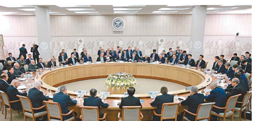
2015年在俄羅斯烏法舉行的上合峰會現場。

他特別提到，2014年簽署的上合關於建立國際公路運輸無障礙通行的協議意義重大。這份今年1月20日生效的文件奠定了歐亞大陸跨國公路聯運的法律基礎。目前，上合各國正在就貨物報關、交通運輸工具通過對方國家的過關手續、海關報表等其他文件的互認工作展開積極工作。