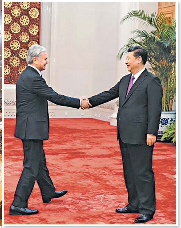
2016年2月29日，習近平在人民大會堂會見阿利莫夫，希望他為推動上合組織各領域合作作出新貢獻。 資料圖片

阿利莫夫特別告訴記者，他從2006年開始，便每年獲邀去人民大會堂旁聽中國總理的政府工作報告，今年已是第12次了。他說，他一邊聽李克強總理作政府