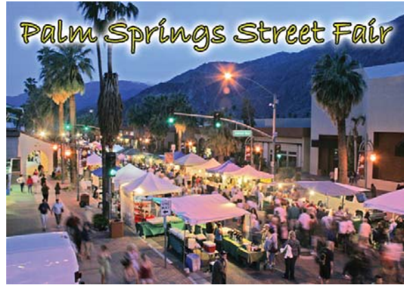
Palm Springs Street Fair

辛托州立公園和自然保護區的林間小道。空中纜車即使在冬天也仍然運營，還經常可以看到有些纜車乘客攜帶雪靴或越野雪機去白雪皚皚的偏遠地區探險(遊客可在Mountain Station 站的冬季探險中心(Winter Adventure Center)租用這