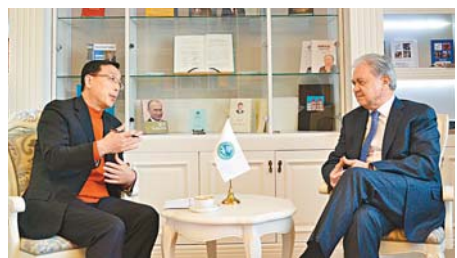
上海合作組織秘書長阿利莫夫接受香港文匯報副總編輯尹樹廣專訪。

阿利莫夫特別告訴記者，他從2006年開始，便每年獲邀去人民大會堂旁聽中國總理的政府工作報告，今年已是第12次了。他說，他一邊聽李克強總理作政府