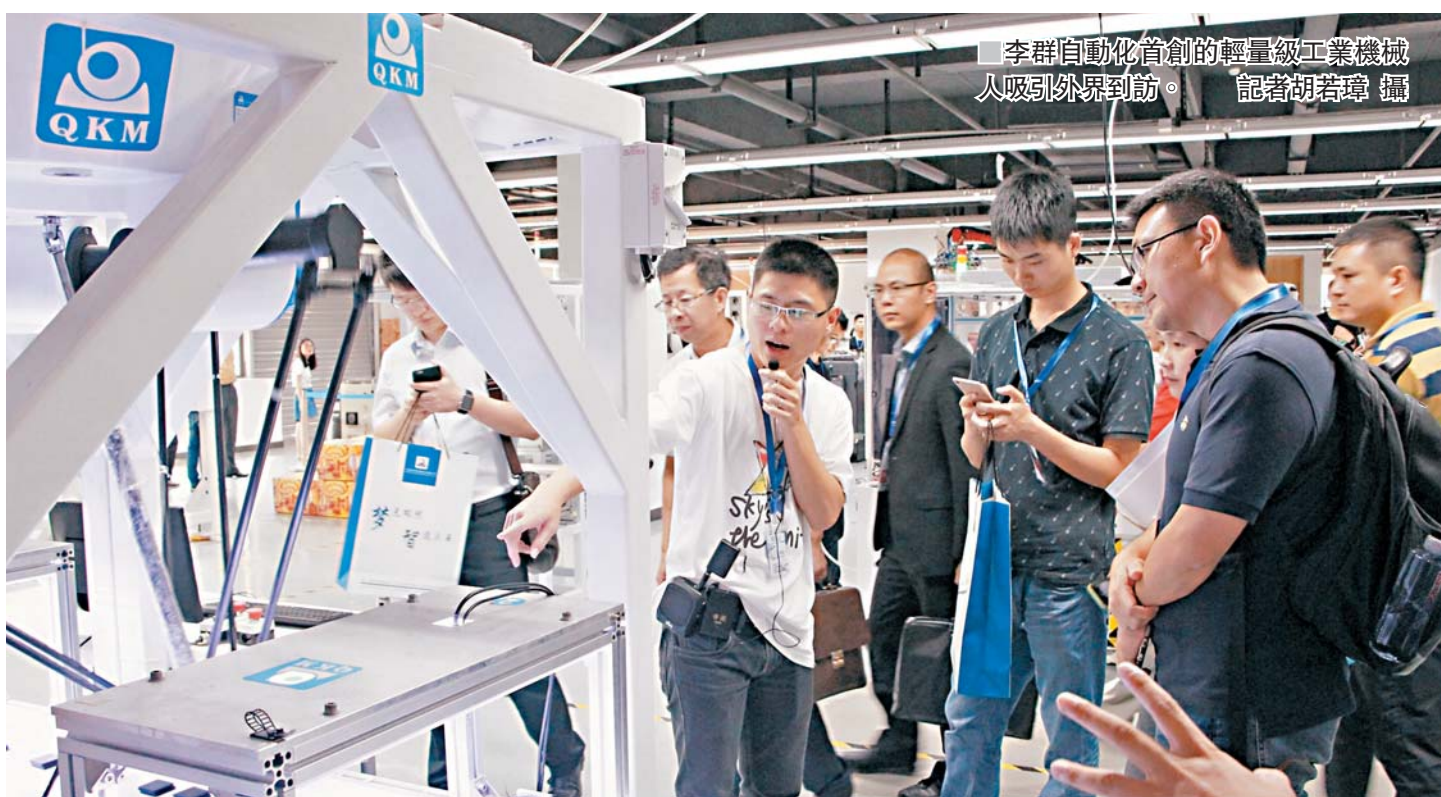
李群自動化首創的輕量級工業機械人吸引外界到訪。

記者在採訪中也了解到，在廣東自貿區市場開放、制度創新和便利營商措施推動下，越來越多的港企進駐其中，從事新興產業和專業服務業。截至去年中，就有超過3,500家港企落戶廣東自貿區，合同利用港資達3,000多億元。