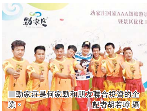
勁家莊是家勁和朋友聯合投資的企業。

工廠雲集的珠三角自從大力發展工業旅遊以來，落戶在惠州的勁家莊一直是外界關注與遊玩的熱點。記者在採訪中得知，自2013年底開放工業遊以來，香港影星何家勁與香