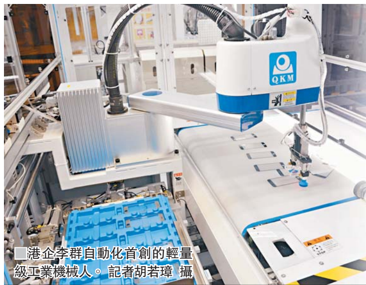
港企李群自動化首創的輕量級工業機械人。