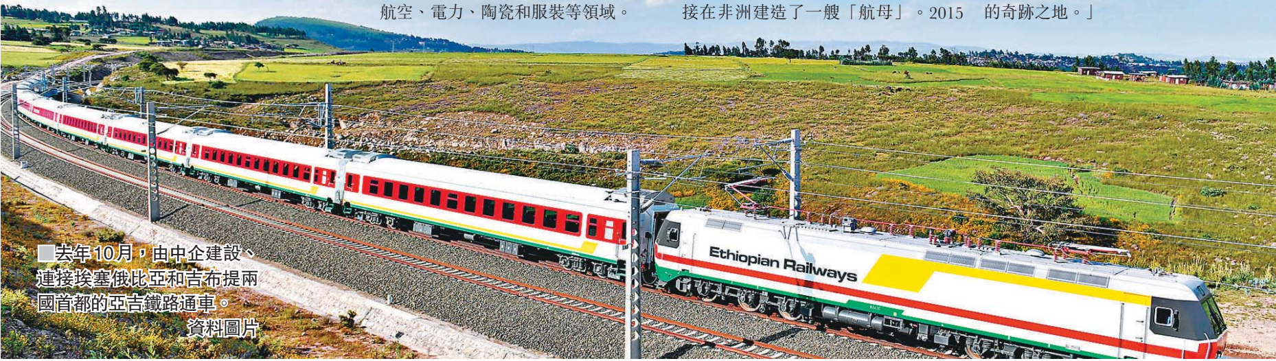
去年10月，由中企建設、連接埃塞俄比亞和吉布提兩國首都的亞吉鐵路通車。