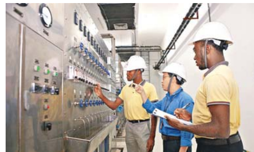
深圳能源安所固電廠的中國和加納雙方工作人員。

對於大多數中國企業家來說，非洲可能是這個地球上最後一塊陌生的土地。隨着中國正快速崛起為世界經濟的主導力量之一，非洲不少國家認定中國的發展道路和經驗適合自己國家的發展，紛紛向中國企業家伸出橄欖枝。一旦認準了機會，中國企業家們往往展現了堅實的敢闖精神和驚人的「中國速度」。